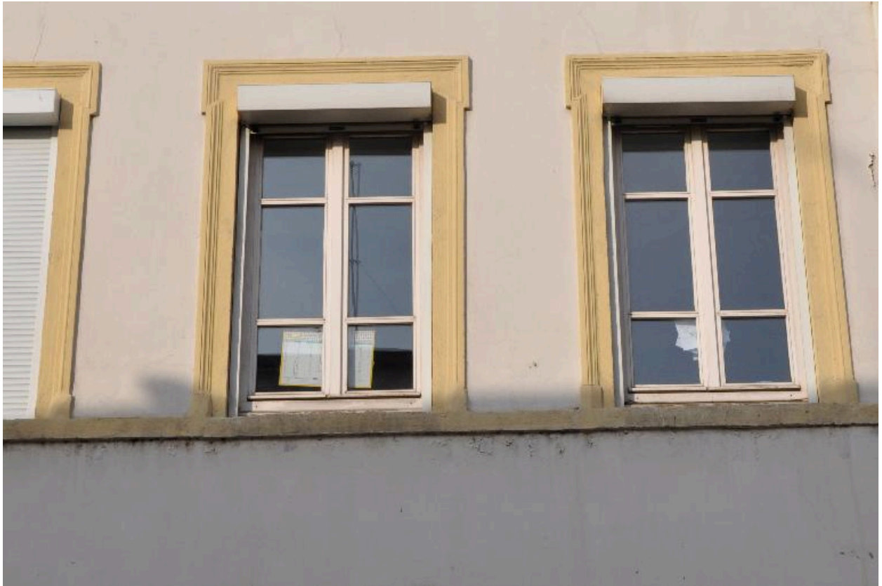
Élévation sur rue, encadrements de baies à crossettes