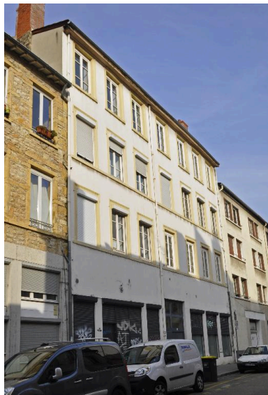
Elévation sur rue, vue générale IVR84_20166902211NUCA