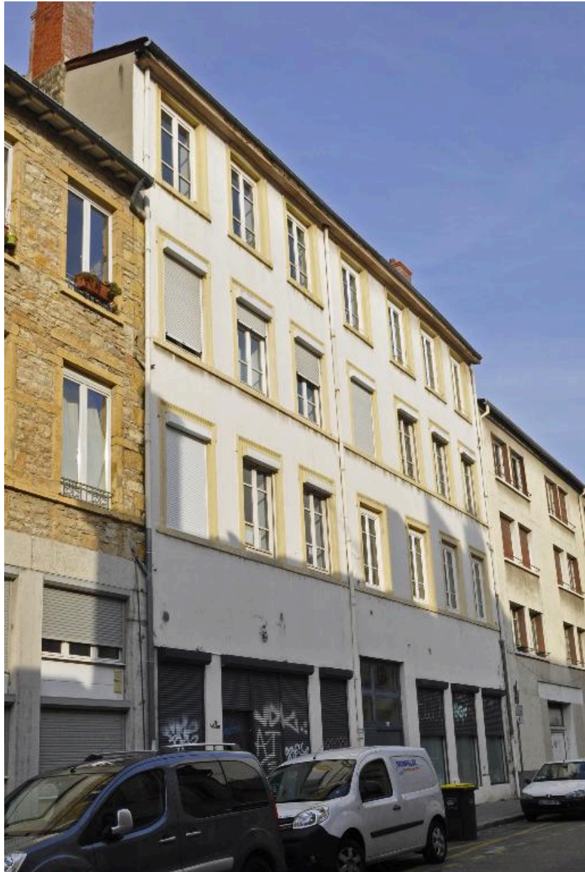
Elévation sur rue, vue générale