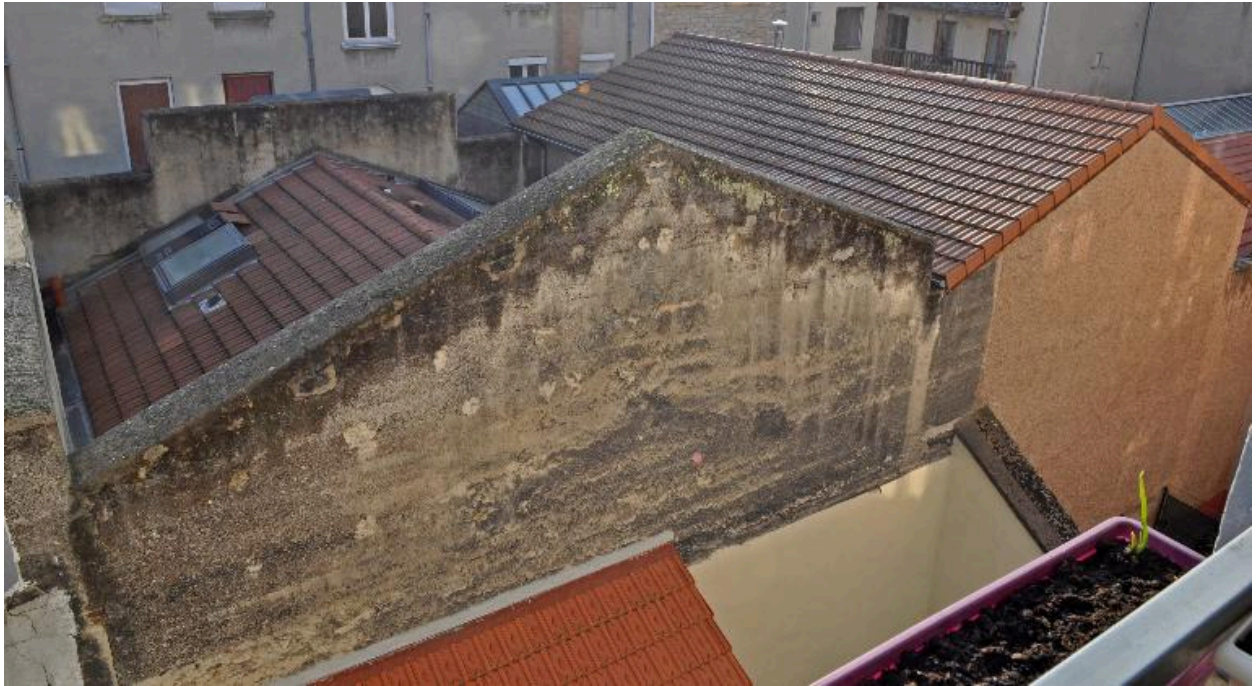
Vue des deux entrepôts en fond de cour