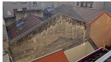
Vue des deux entrepôts en fond de cour