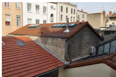
Entrepôt sud, en fond de cour IVR84_20166902214NUCA