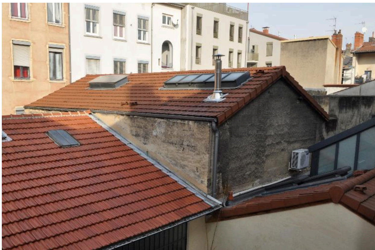
Entrepôt sud, en fond de cour