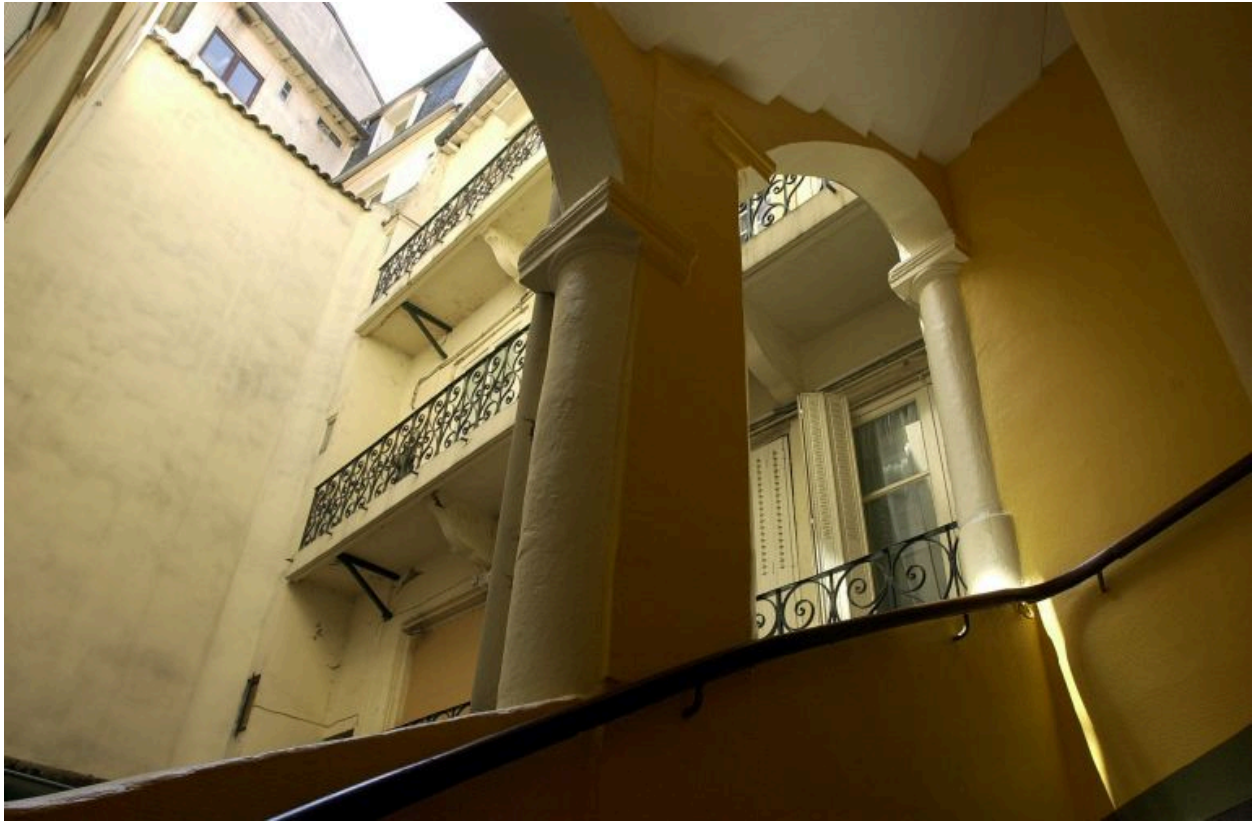
Pavillon d'escalier, vue intérieure au niveau de la 1ère volée