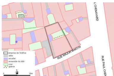
Plan-masse, d'après le système urbain de référence, version 1999 IVR82_20056902722NUDA