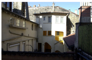
Pavillon d'escalier, élévation, détail de la partie supérieure IVR82_20036901267NUCA