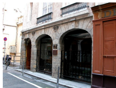
Façade sur rue, rez-de-chaussée IVR82_20036901266NUCA