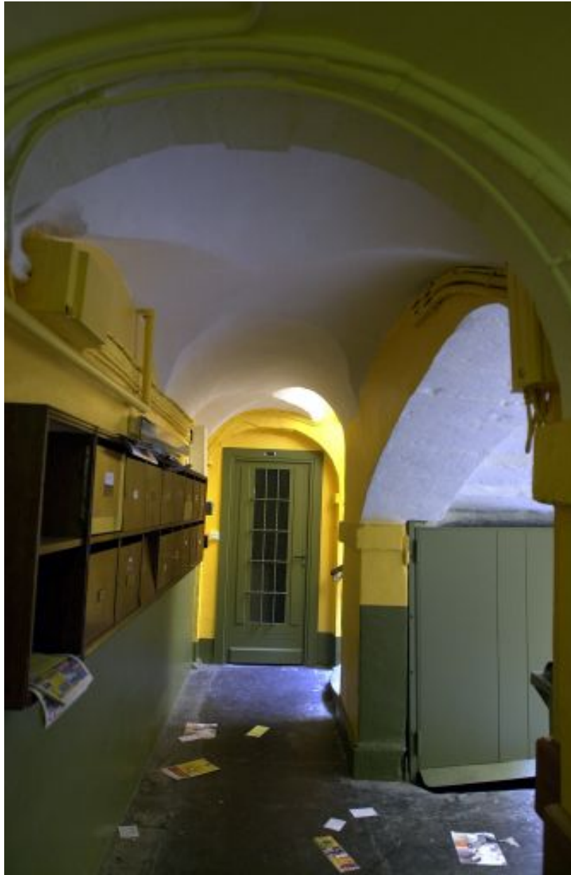
Palier du rez-de-chaussée de l'escalier, dans le prologement de l'allée