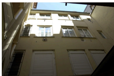
2e corps de logis, façade sur cour IVR82_20036901205NUCA