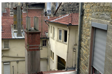
Pavillon d'escalier, élévation, vue latérale de la partie supérieure IVR82_20036901192NUCA