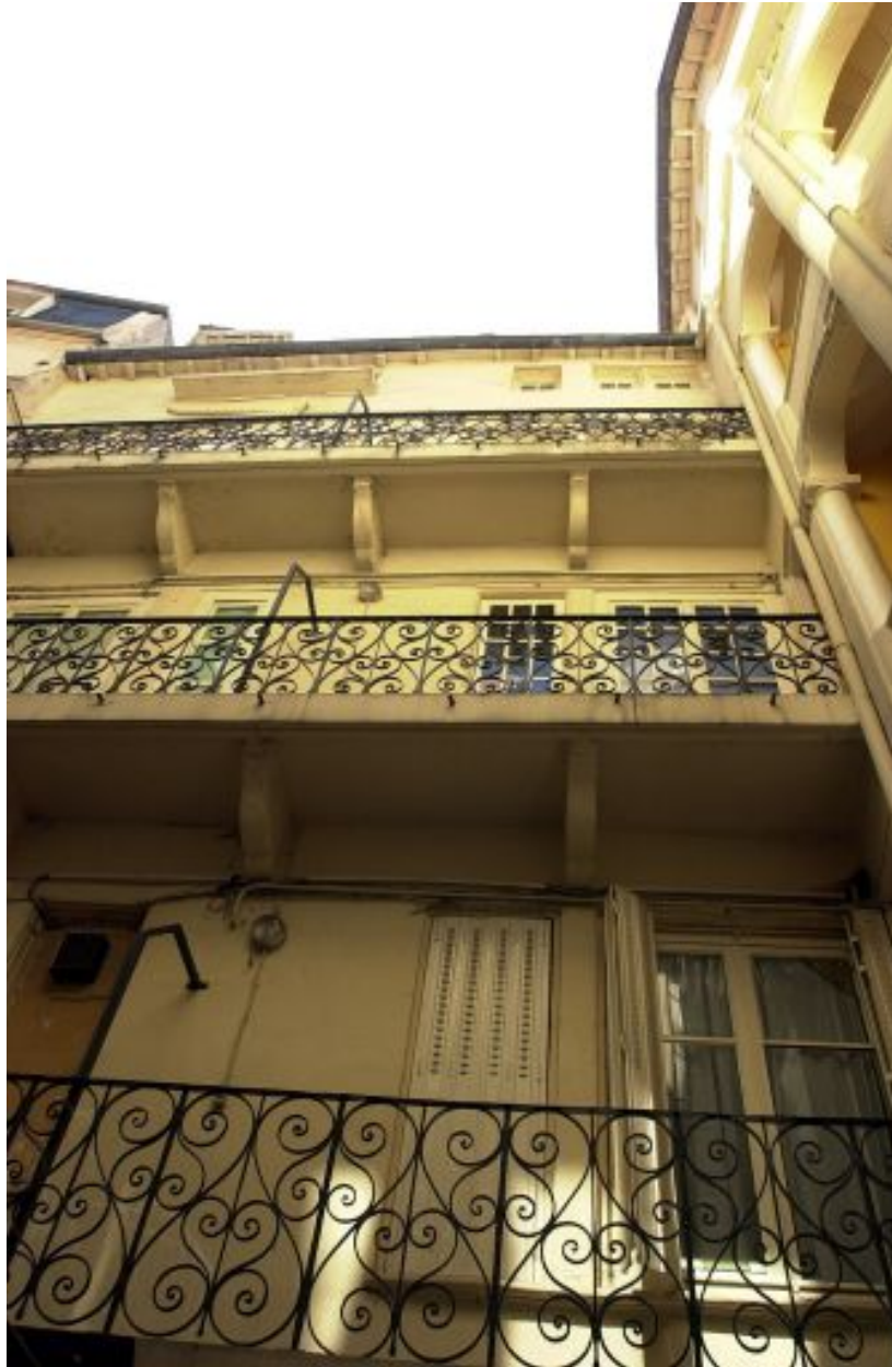
1er corps de logis, façade sur cour, partie droite