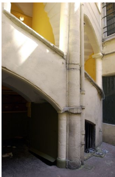
Pavillon d'escalier, élévation, détail de la partie inférieure IVR82_20036901211NUCA