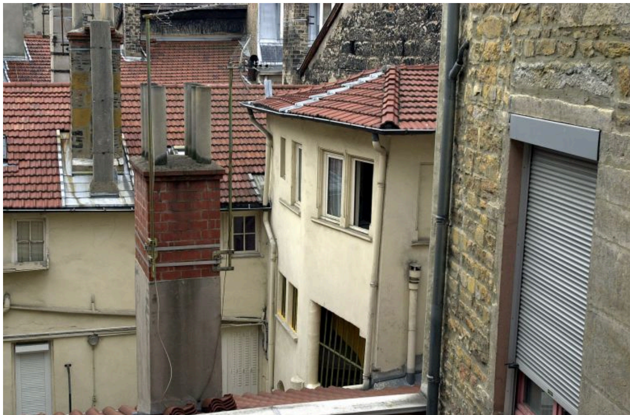
Pavillon d'escalier, élévation, vue latérale de la partie supérieure