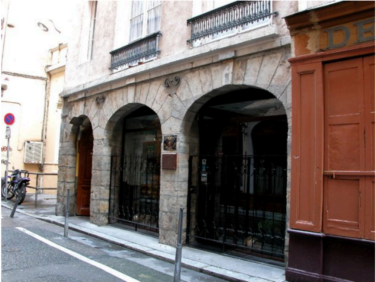
Façade sur rue, rez-de-chaussée