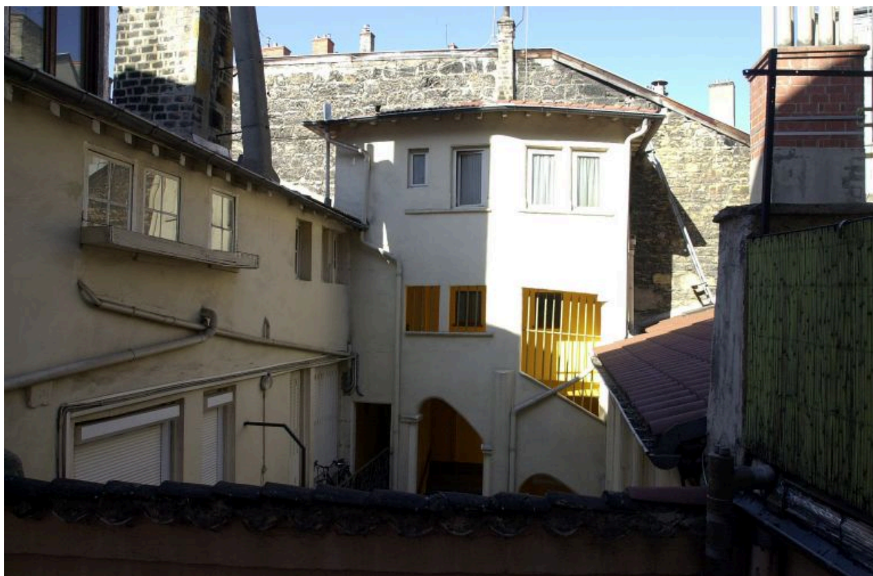
Pavillon d'escalier, élévation, détail de la partie supérieure