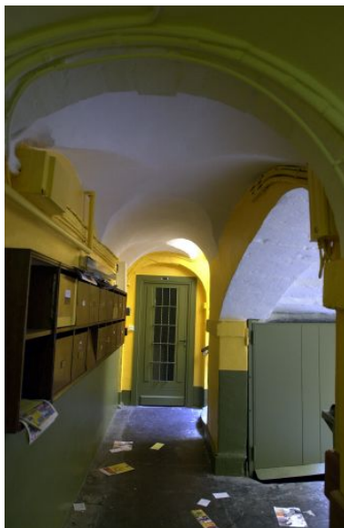
Palier du rez-de-chaussée de l'escalier, dans le prolongement de l'allée