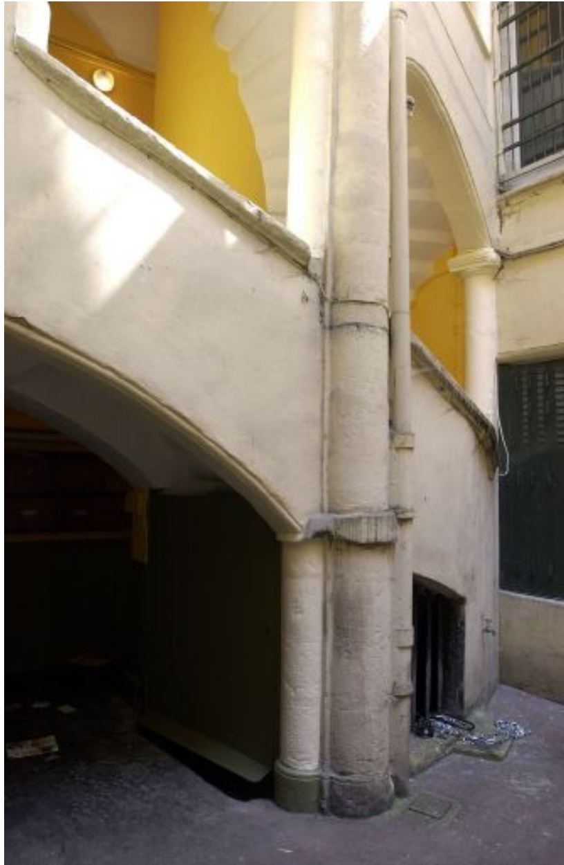
Pavillon d'escalier, élévation, détail de la partie inférieure