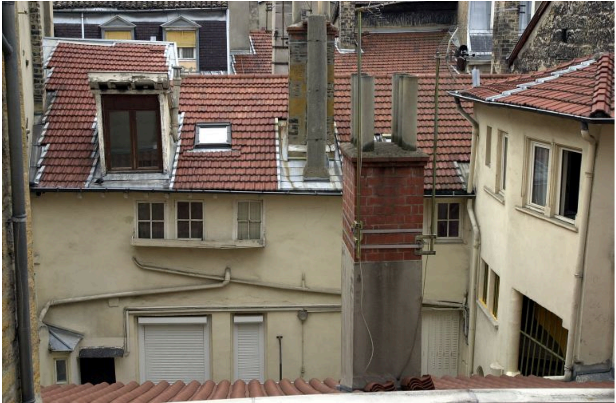
1er corps de logis, façade sur cour, partie supérieure