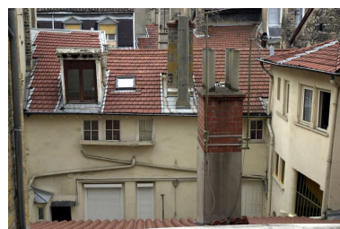
1er corps de logis, façade sur cour, partie supérieure IVR82_20036901193NUCA