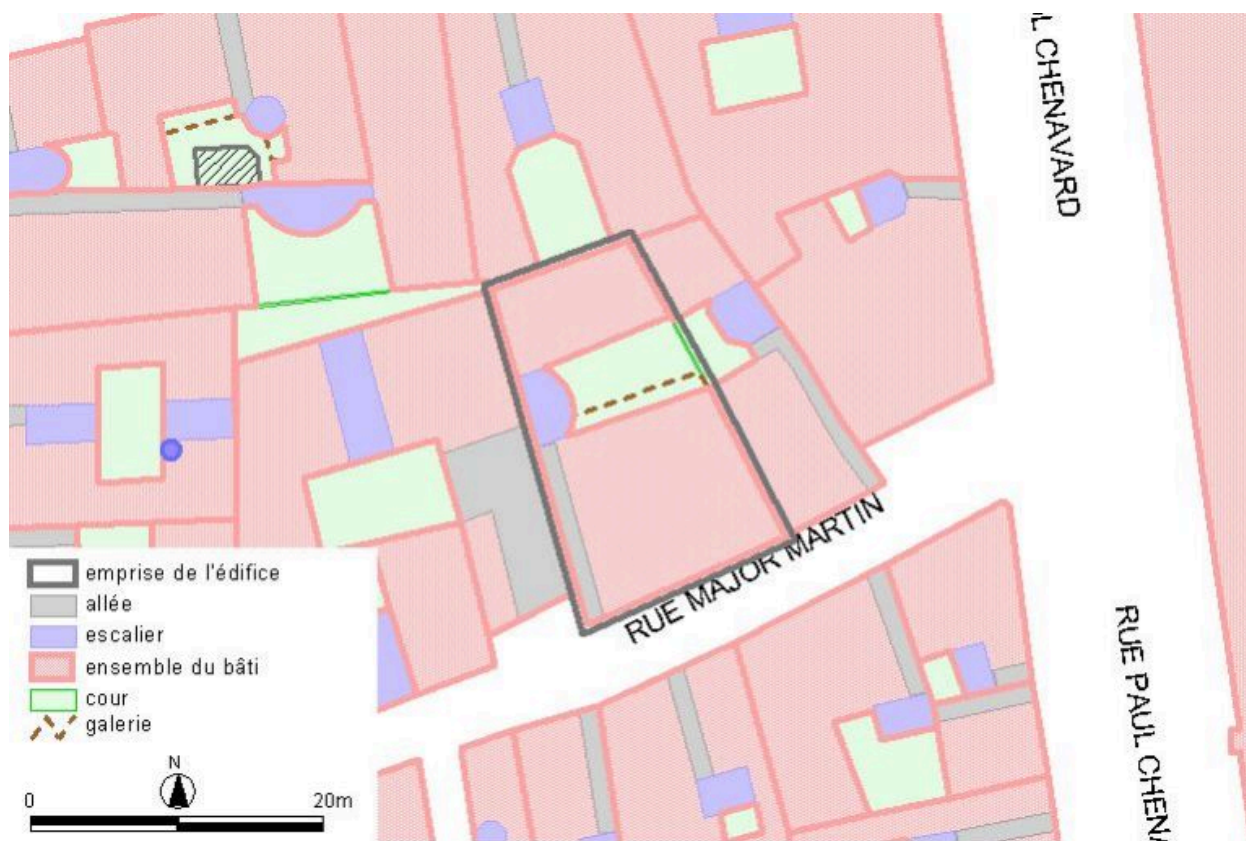
Plan-masse, d'après le système urbain de référence, version 1999