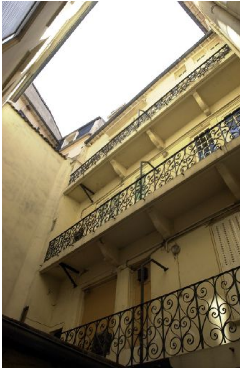
1er corps de logis, façade sur cour, partie gauche