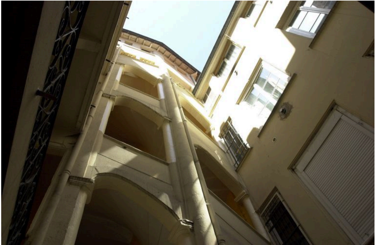
Pavillon d'escalier, élévation, détail de la partie médiane