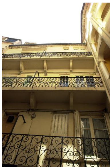
1er corps de logis, façade sur cour, partie droite IVR82_20036901206NUCA