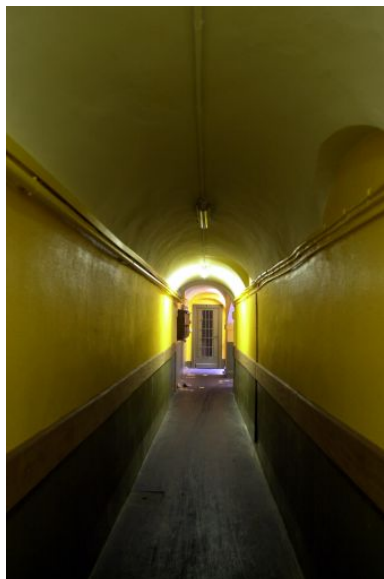
Allée