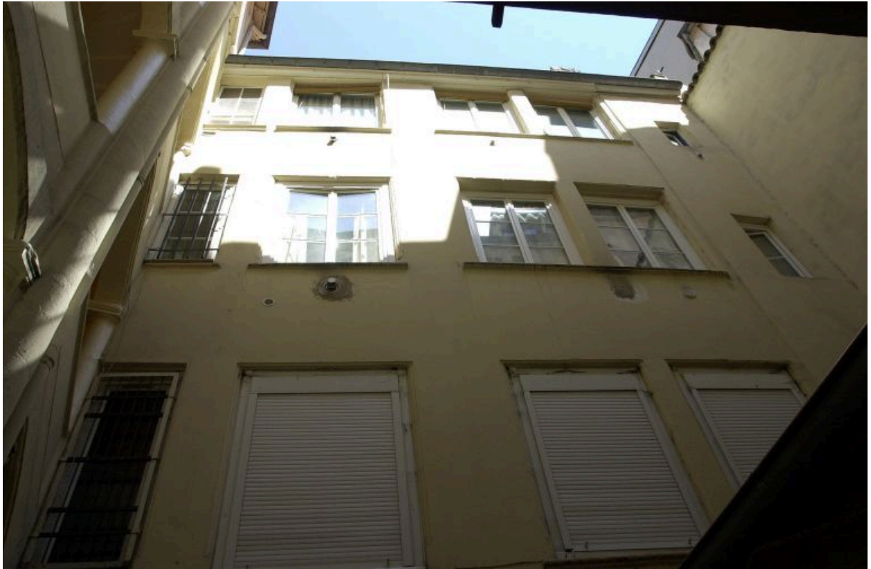
2e corps de logis, façade sur cour