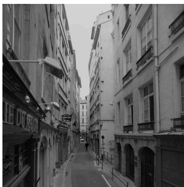
Façade sur rue IVR82_20056900406NUC