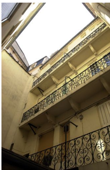
1er corps de logis, façade sur cour, partie gauche IVR82_20036901207NUCA