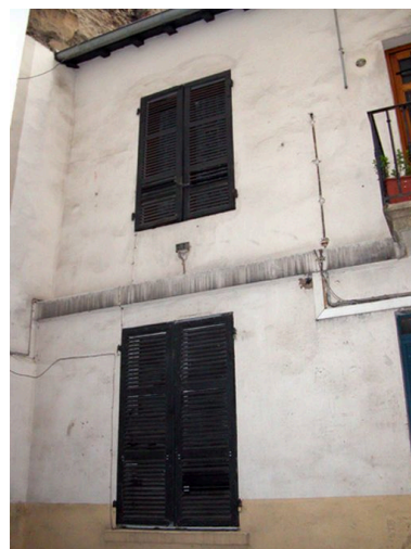
Partie gauche de l'élévation IVR82_20046904118NUCA