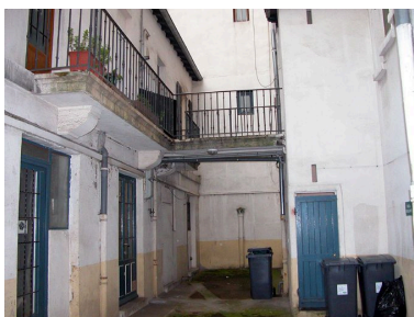
Vue générale de l'élévation et de la passerelle reliant l'escalier de l'immeuble sur rue à la coursière IVR82_20046904121NUCA