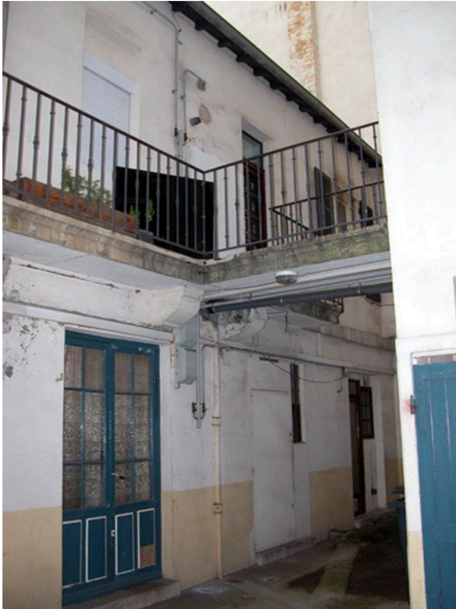
Partie centrale de l'élévation