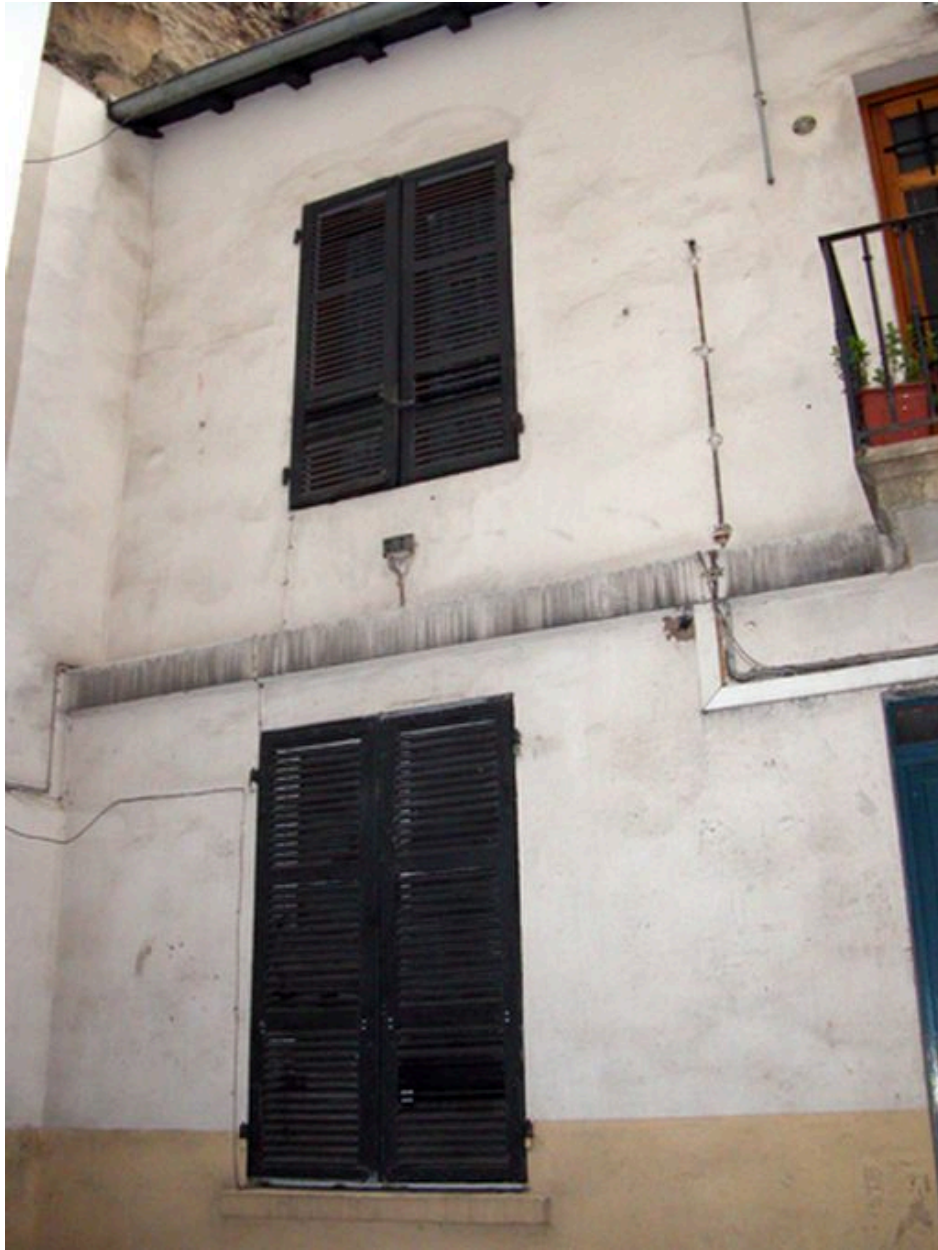
Partie gauche de l'élévation