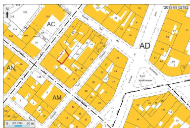
Plan masse et de situation, extrait de http://cadastre.gouv.fr IVR82_20136902182NUDA