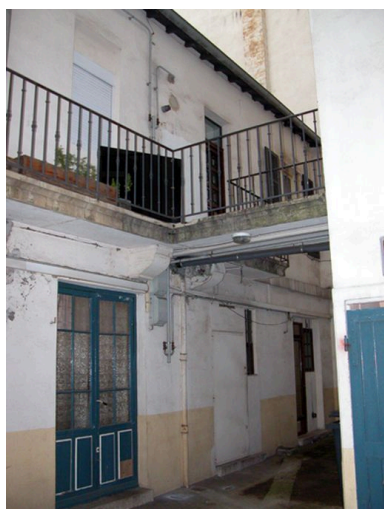
Partie centrale de l'élévation IVR82_20046904119NUCA