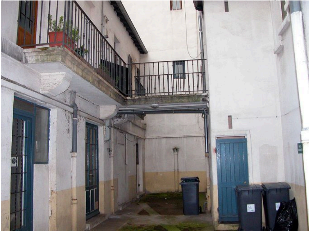
Vue générale de l'élévation et de la passerelle reliant l'escalier de l'immeuble sur rue à la coursière