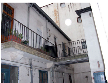
Vue de la coursière distribuant l'étage IVR82_20046904120NUCA