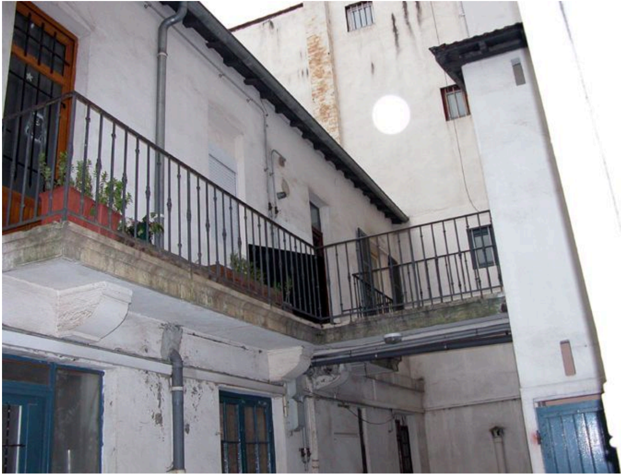
Vue de la coursière distribuant l'étage