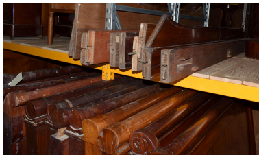
Vue générale des traverses.