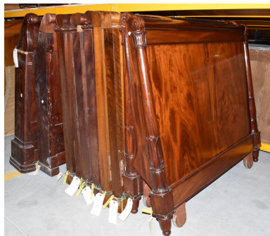
Vue des montants du lit (quatrième à partir de la droite)