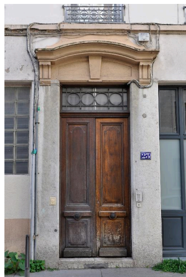
Vue rapprochée de la porte bâtarde, fronton et imposte en ferronnerie