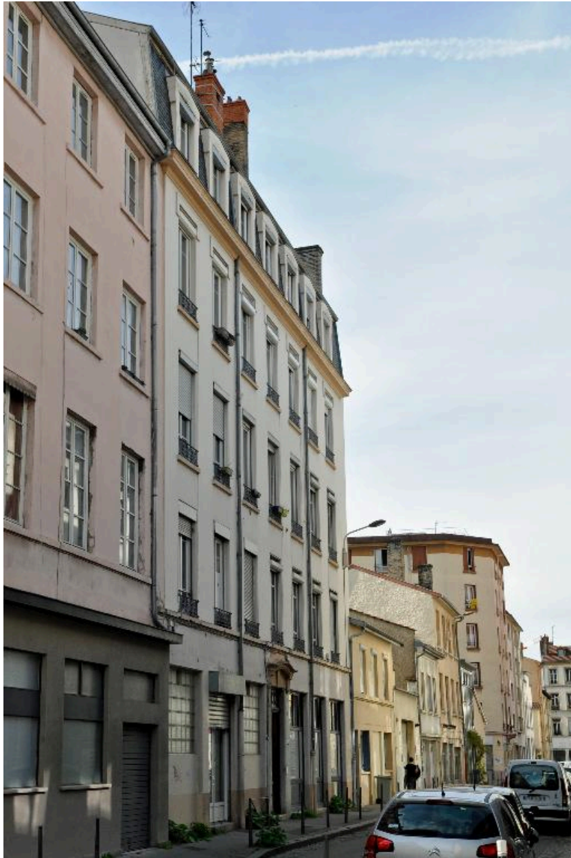
Vue générale, élévation sur rue