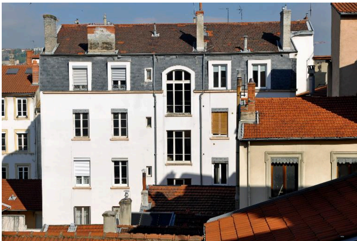
Vue générale, élévation sur cour