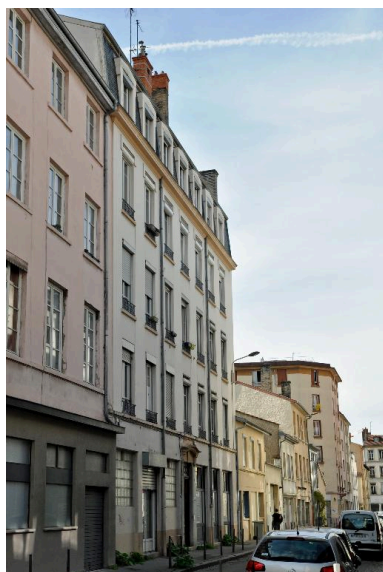
Vue générale, élévation sur rue IVR84_20176901065NUCA