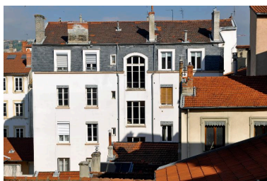
Vue générale, élévation sur cour IVR84_20176901066NUCA