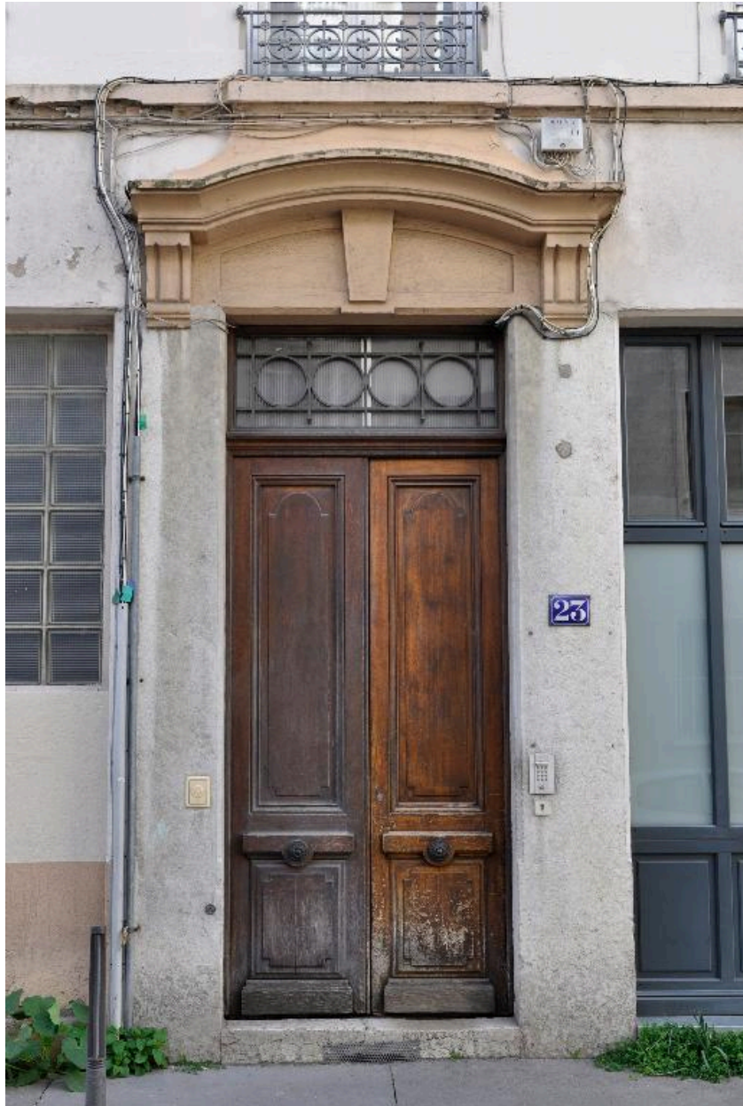
Vue rapprochée de la porte bâtarde, fronton et imposte en ferronnerie