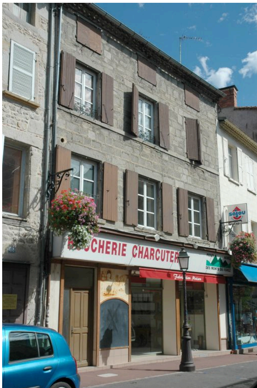
Vue générale sur la rue Tupinerie.