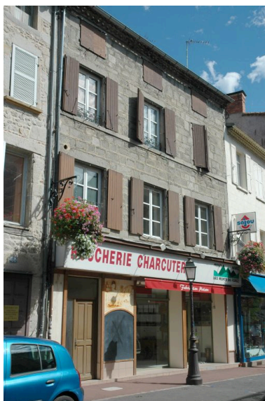
Vue générale sur la rue Tupinerie. IVR82_20134200502NUCA