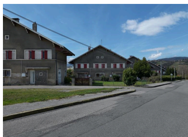
Maison ouvrière type chalet IVR84_20163800171NUCAQ