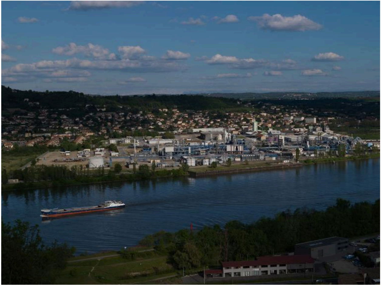
Vue d'ensemble de l'usine Prayon