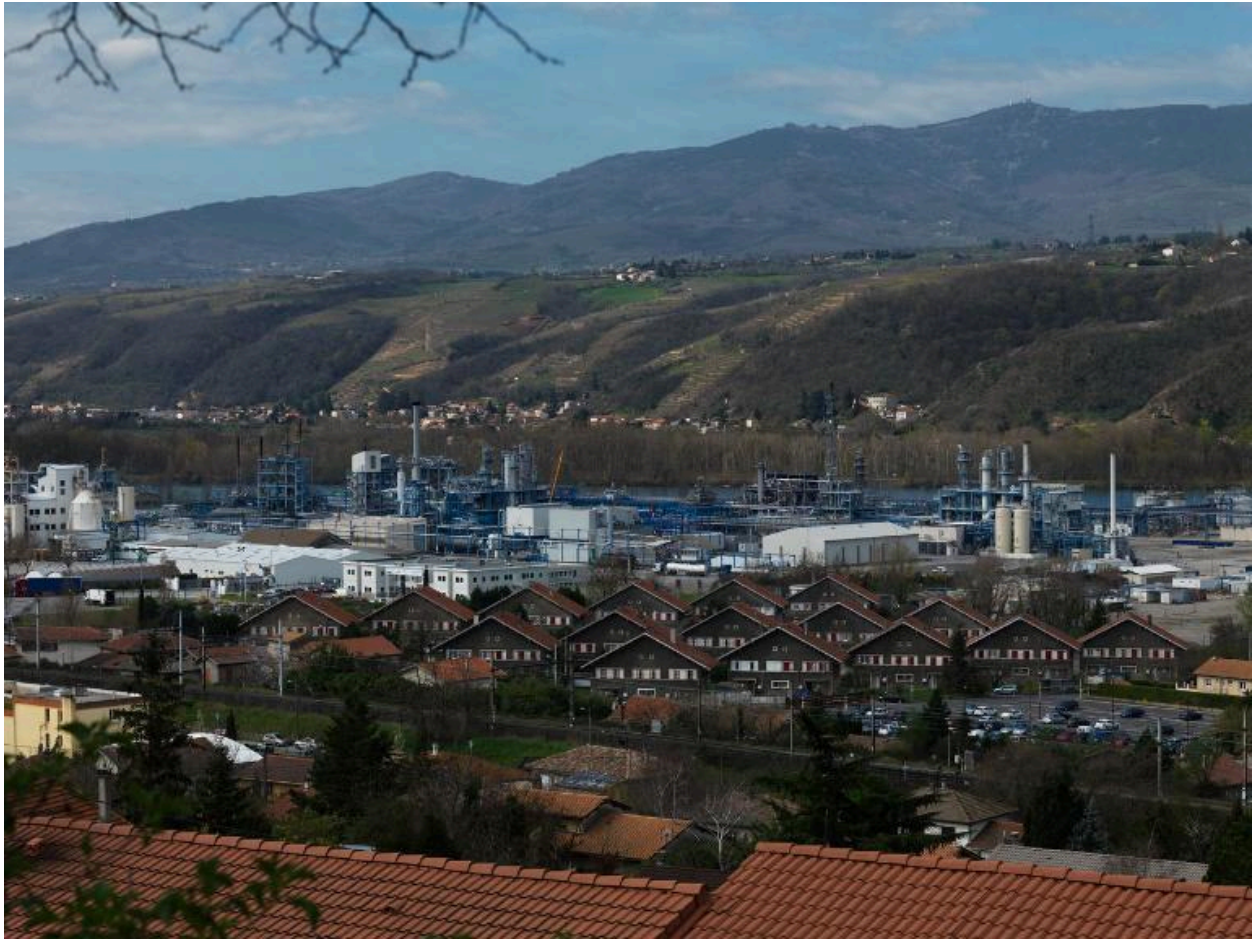
Vue d'ensemble de l'usine et de la cité type chalets