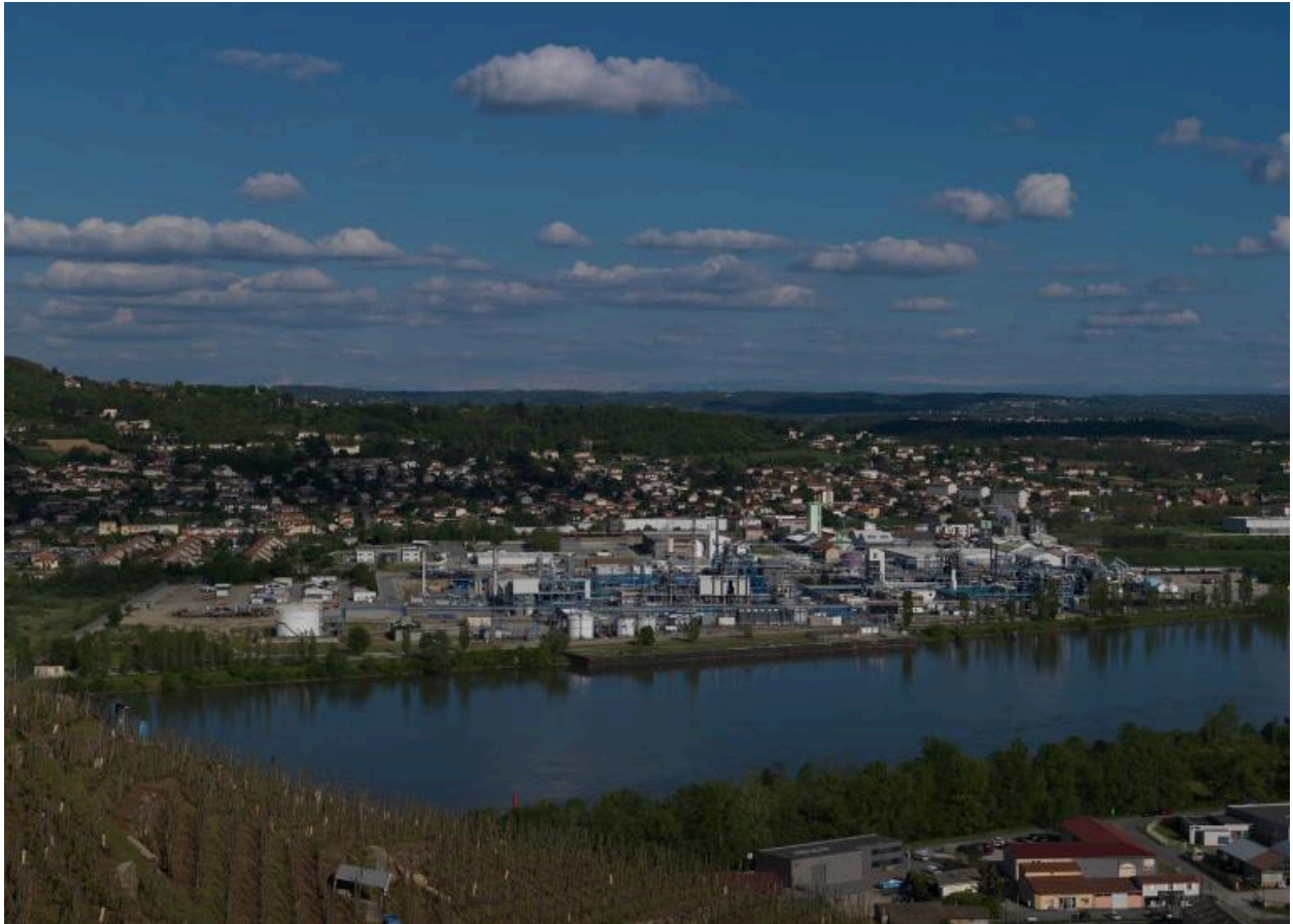
Vue d'ensemble ouest de l'usine Adisséo