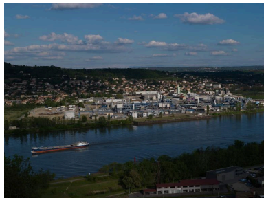
Vue d'ensemble de l'usine Prayon