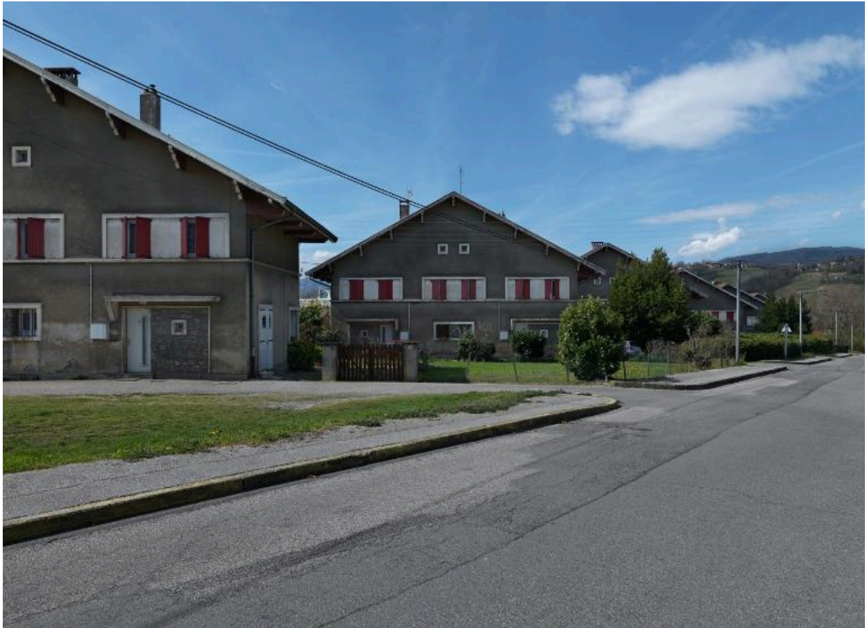
Maison ouvrière type chalet