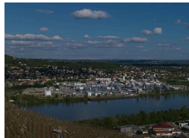
Vue d'ensemble ouest de l'usine Adisséo IVR84_20163800165NUCA