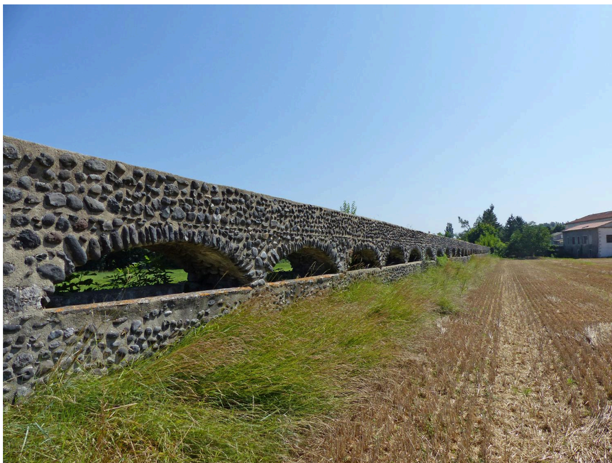
Vue de l'aqueduc du moulinage de la Neuve à Chomérac