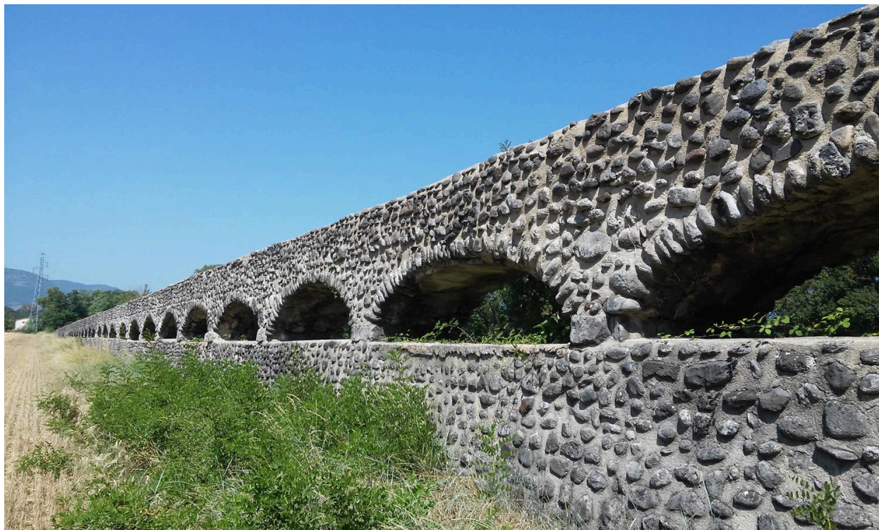
Aqueduc vue ouest