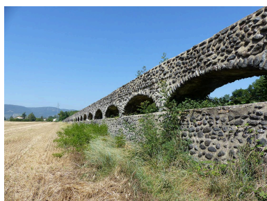
Aqueduc détail IVR84_20180700070NUCA