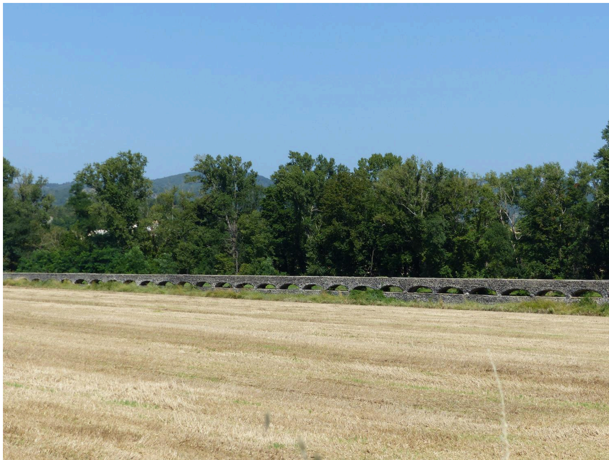
Vue d'ensemble de l'aqueduc dans un grand paysage