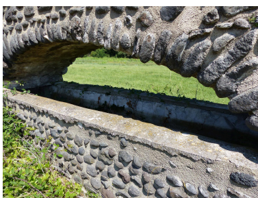
Détail arche aqueduc IVR84_20180700074NUCA