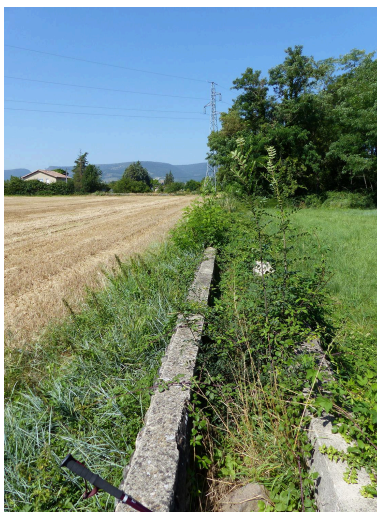
Aqueduc : vue du canal par en-dessus