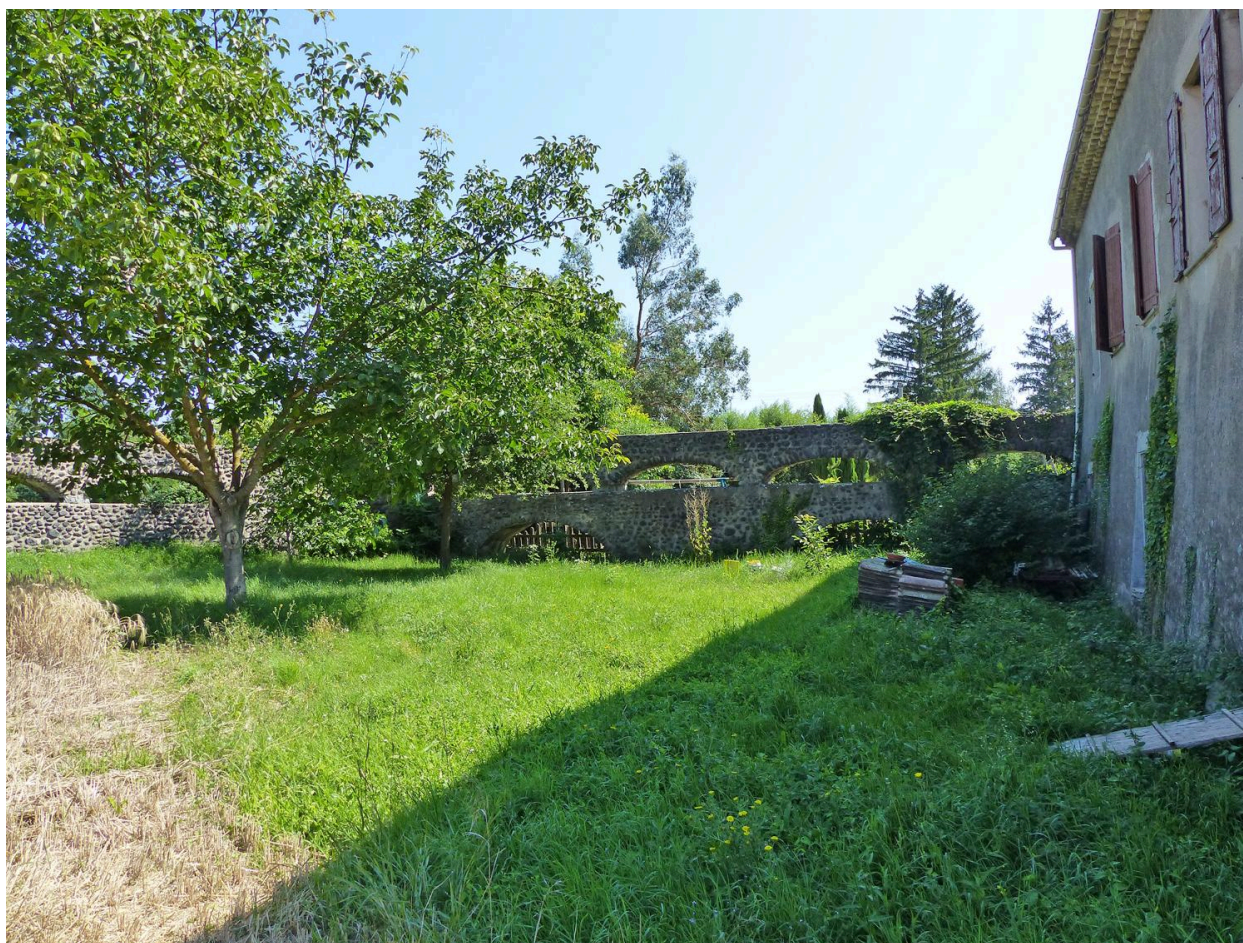
Angle de l'aqueduc avec le moulinage