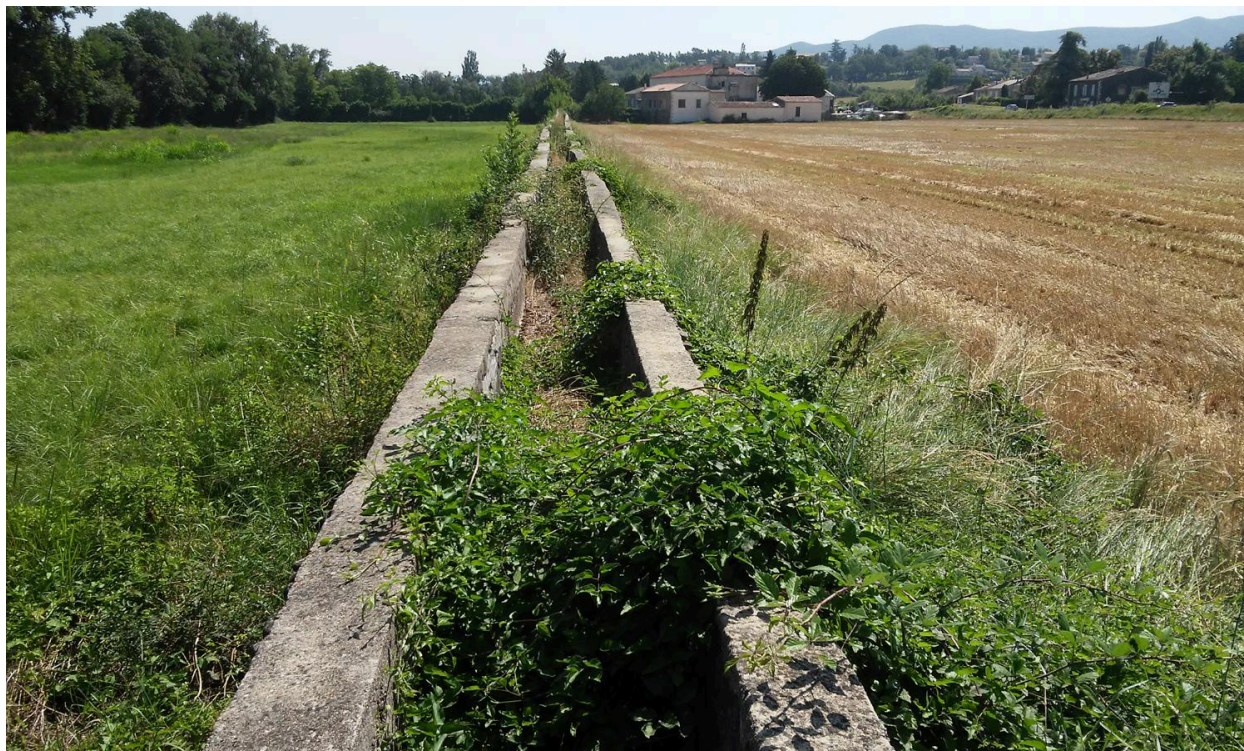
Aqueduc vue du canal par en-dessus