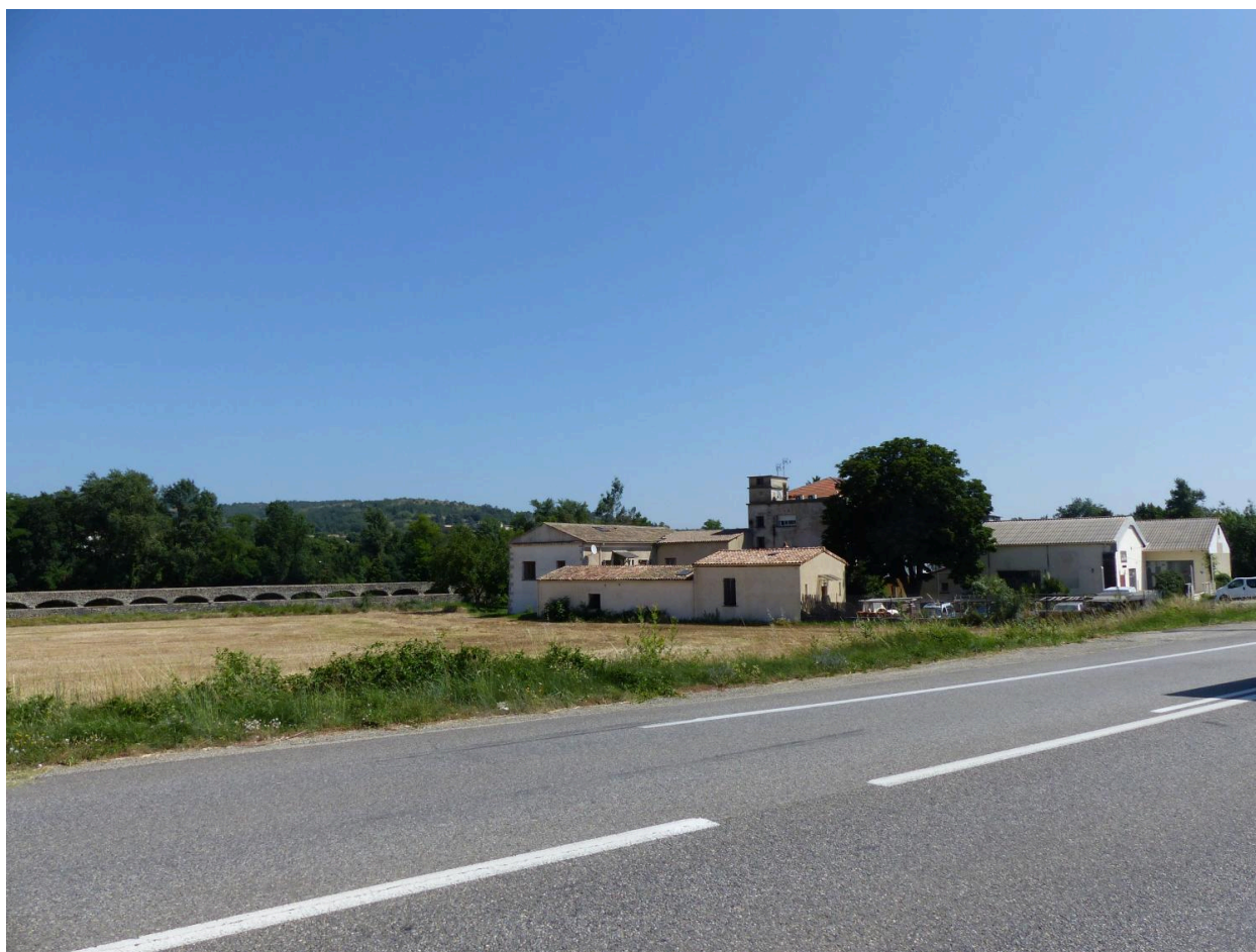
Moulinage de la Neuve et aqueduc à Chomérac vue d'ensemble