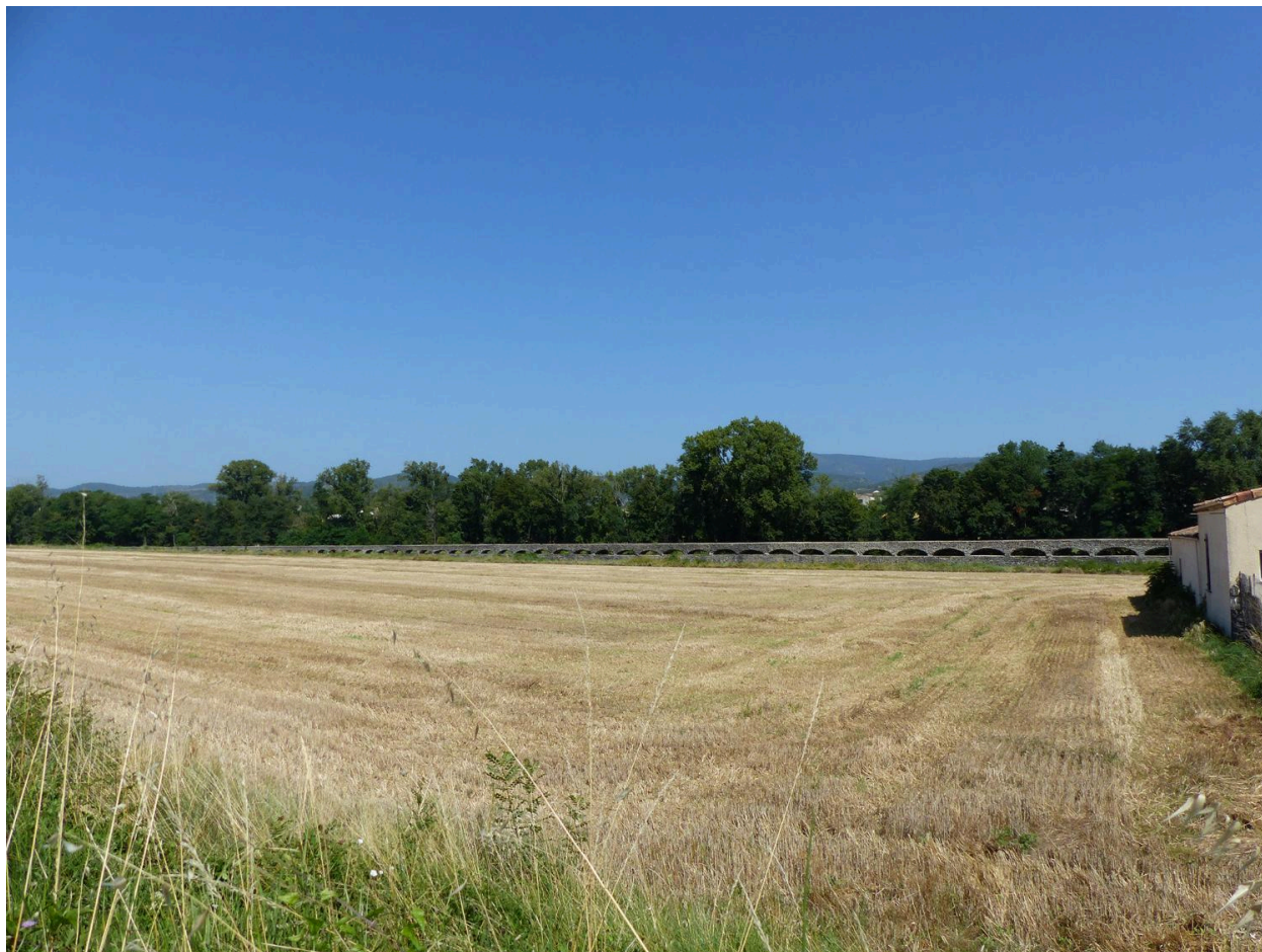
Vue d'ensemble de l'aqueduc dans le grand paysage