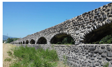
Aqueduc vue ouest IVR84_20180700066NUCA