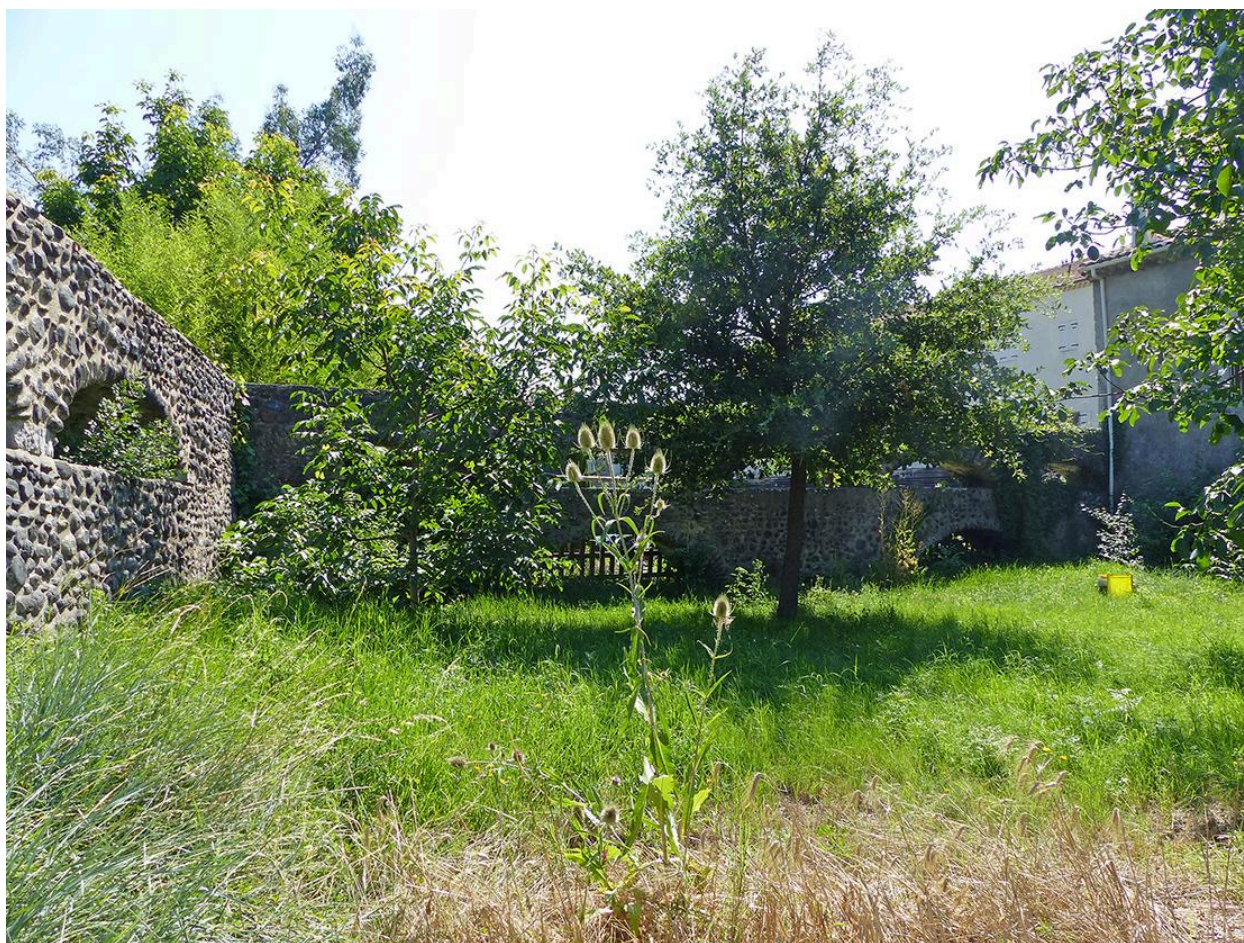
Départ de l'aqueduc