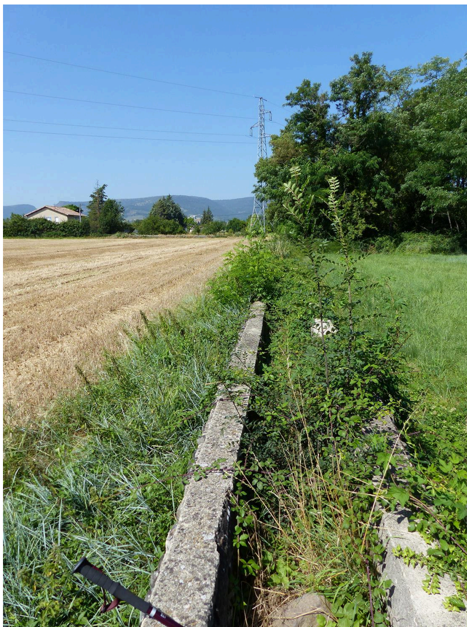
Aqueduc : vue du canal par en-dessus