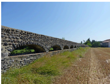
Vue de l'aqueduc du moulinage de la Neuve à Chomérac