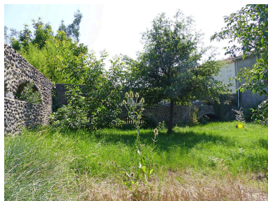
Départ de l'aqueduc IVR84_20180700073NUCA