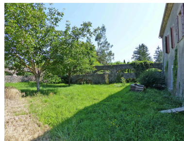
Angle de l'aqueduc avec le moulinage