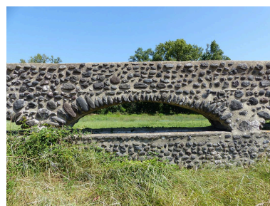
Aqueduc : détail arche maçonnée en galets IVR84_20180700078NUCA