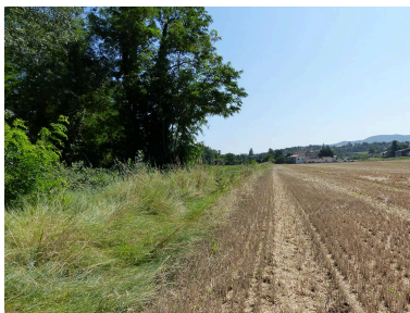
Vue d'ensemble du site IVR84_20180700077NUCA