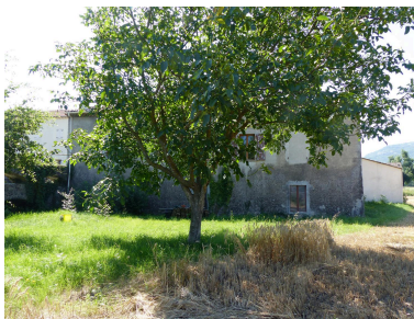
Détail départ de l'aqueduc en accroche au bâtiment.