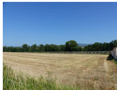
Vue d'ensemble de l'aqueduc dans le grand paysage IVR84_20180700072NUCA