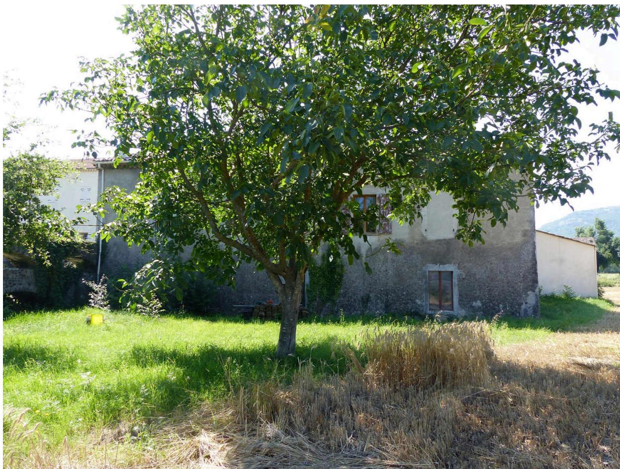
Détail départ de l'aqueduc en accroche au bâtiment.