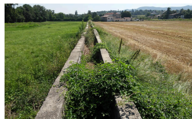
Aqueduc vue du canal par en-dessus IVR84_20180700080NUCA