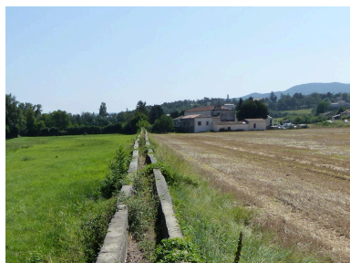
Aqueduc vue du canal par en-dessus, moulinage de la Neuve à Chomérac