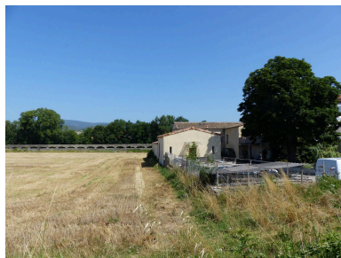
Moulinage de la Neuve à Chomérac, vue sud IVR84_20180700063NUCA