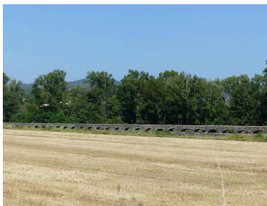
Vue d'ensemble de l'aqueduc dans un grand paysage