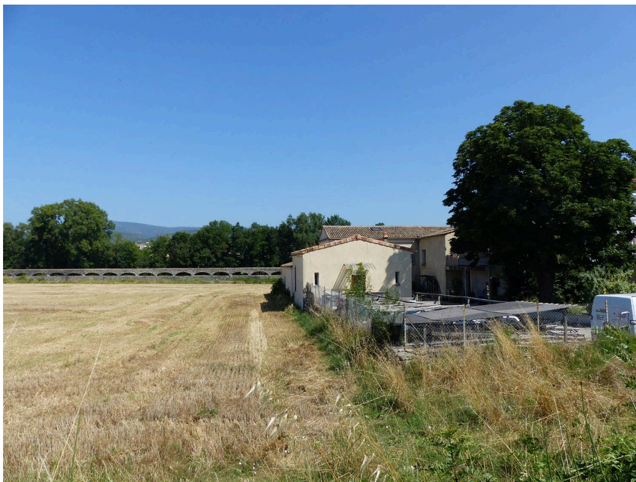
Moulinage de la Neuve à Chomérac, vue sud