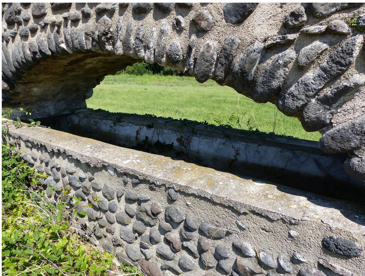
Détail arche aqueduc