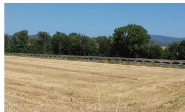
Aqueduc : vue d'ensemble dans un grand paysage IVR84_20180700079NUCA