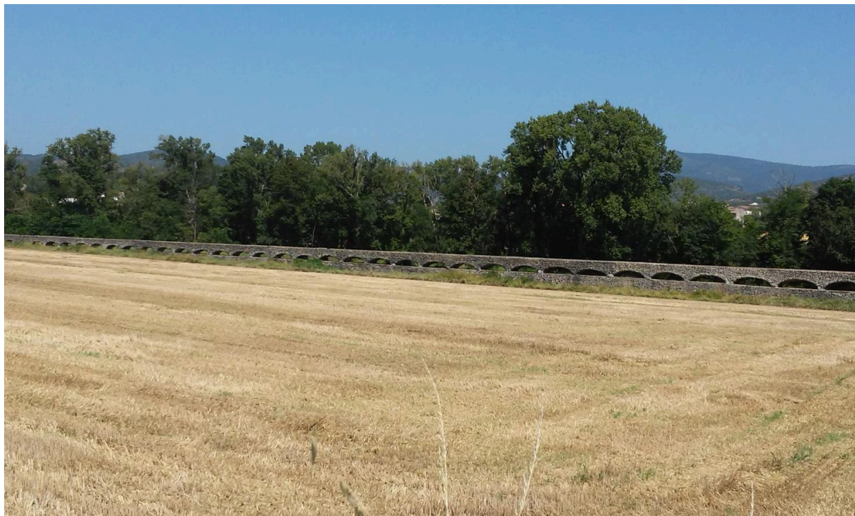
Aqueduc : vue d'ensemble dans un grand paysage