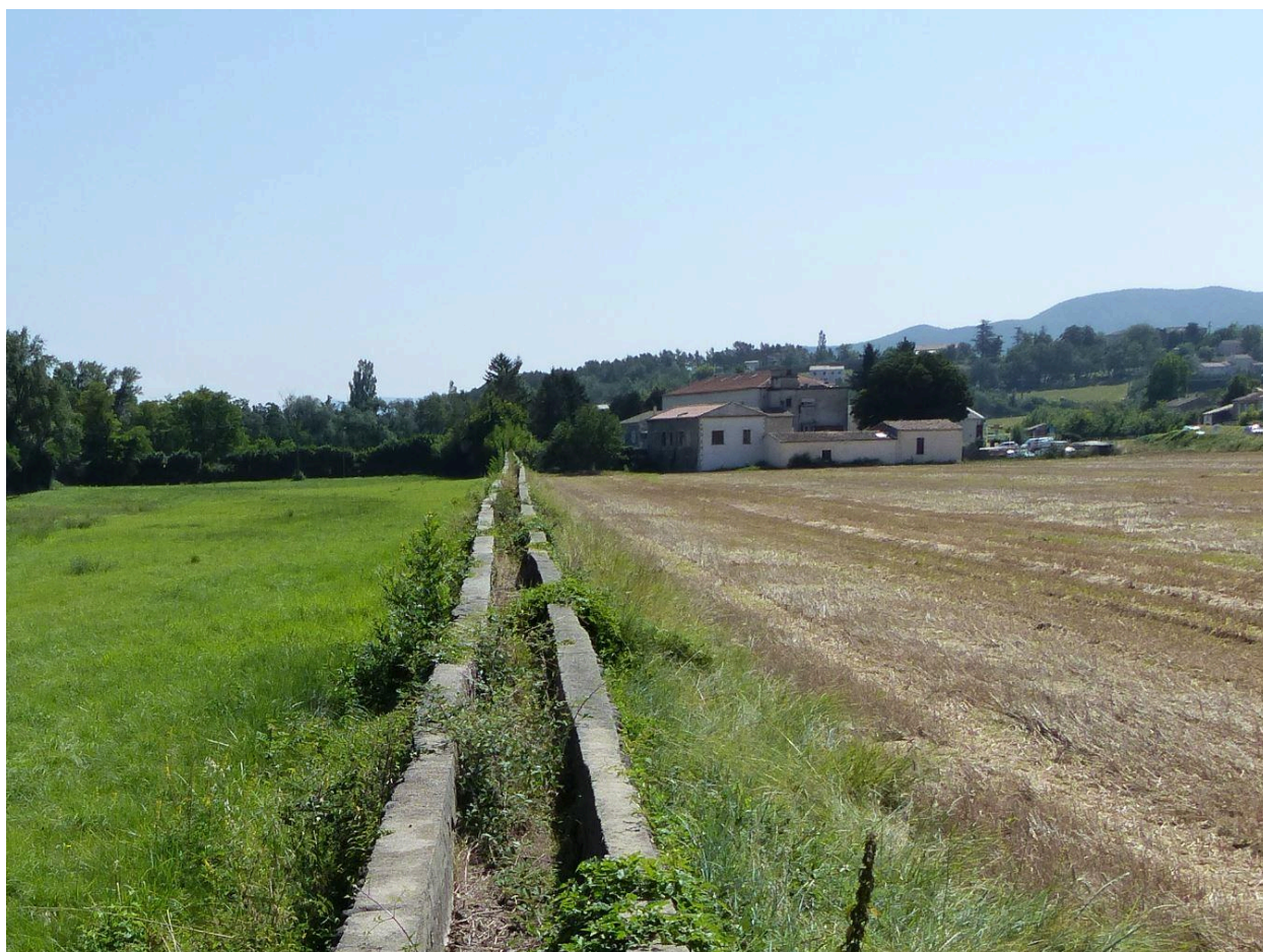
Aqueduc vue du canal par en-dessus, moulinage de la Neuve à Chomérac