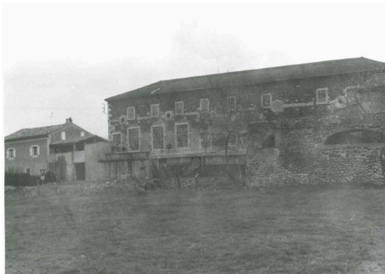
Moulinage de la Neuve à Chomérac vers 1990