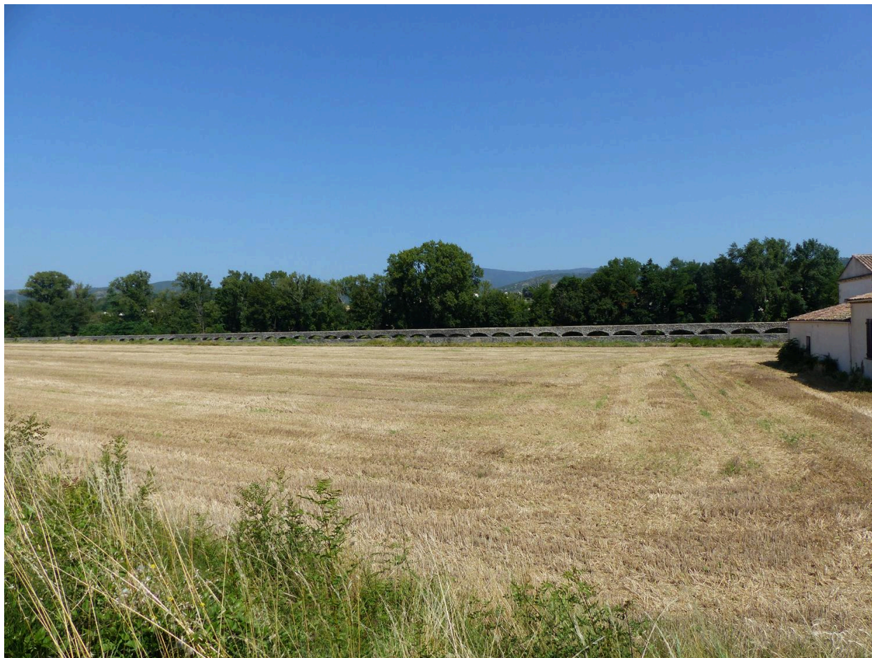
Vue générale de l'aqueduc