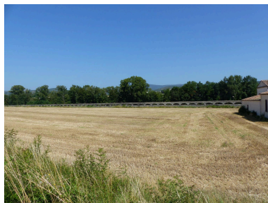
Vue générale de l'aqueduc