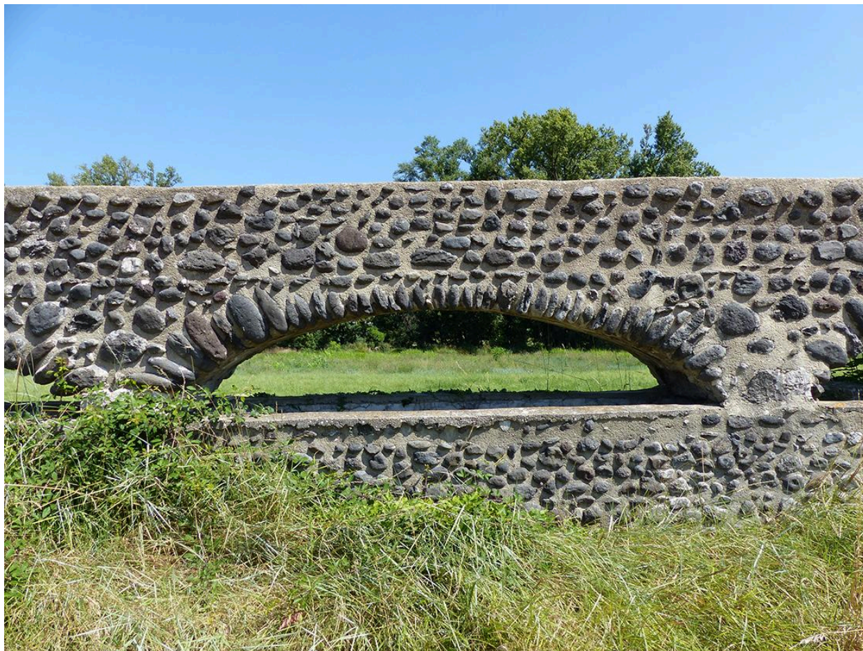
Aqueduc : détail arche maçonnée en galets