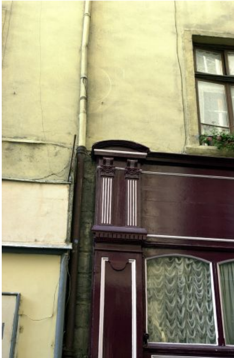
Façade nord sur la rue Chavanne, devanture de boutique, détail