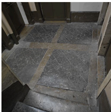
Escalier, sol du palier du 1er étage IVR82_20056901717NUCA