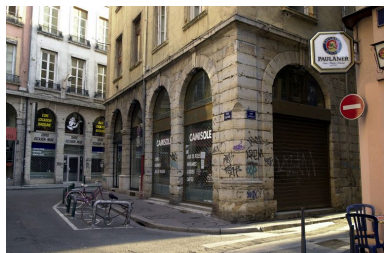
Façade ouest sur la rue Chavanne, rez-de-chaussée IVR82_20036904504NUCA

IVR82_20036904502NUCA