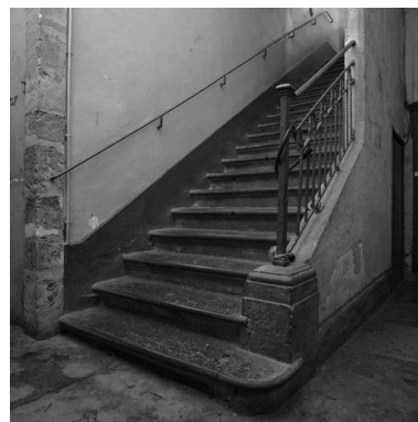
Départ de l'escalier IVR82_20056901715NUC