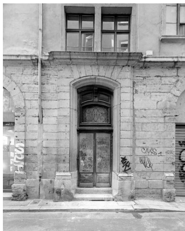
Façade sur la rue Longue, porte IVR82_20056902853V