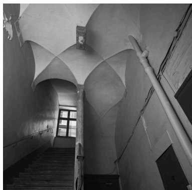
Escalier, voûte du palier du rez-de-chaussée