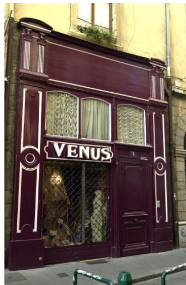
Façade nord sur la rue Chavanne, devanture de boutique IVR82_20036904507NUCA