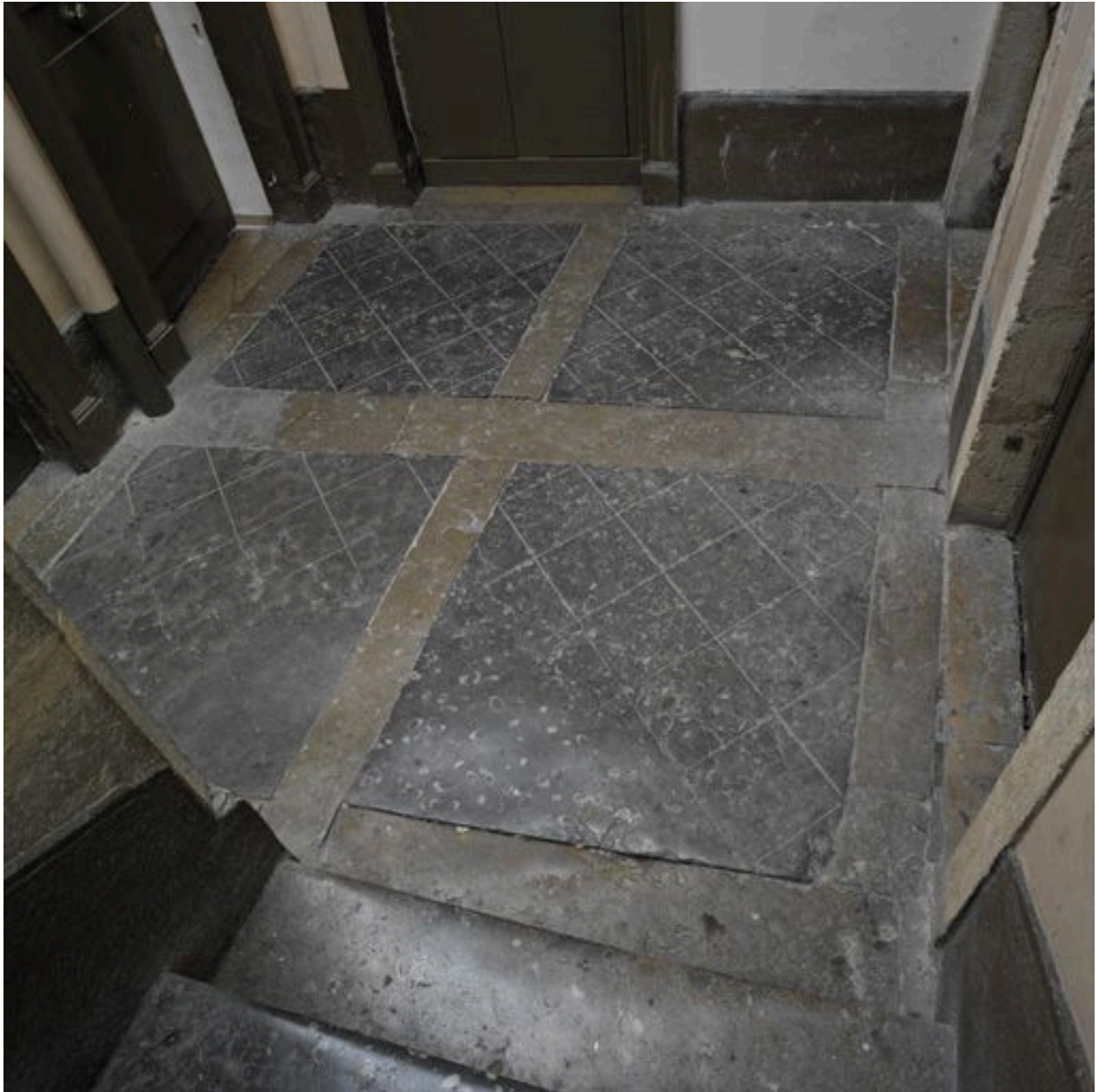
Escalier, sol du palier du 1er étage