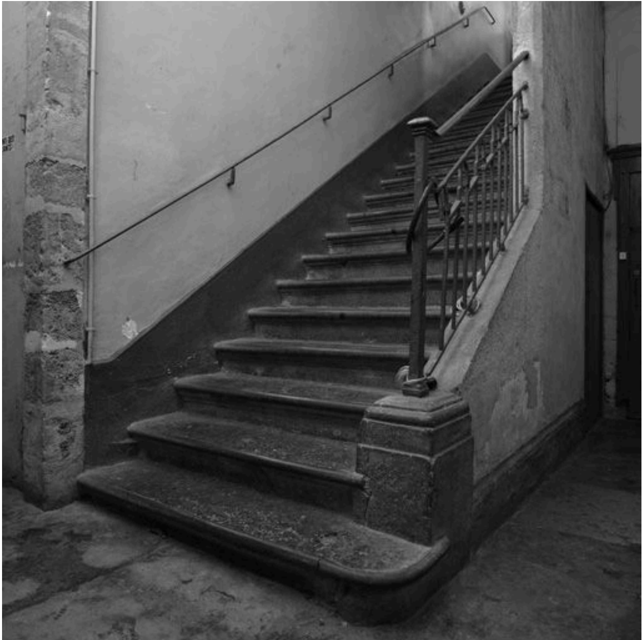
Départ de l'escalier