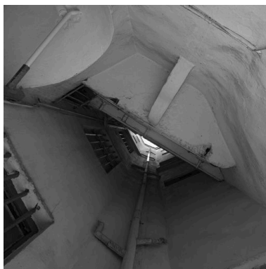
Cour, vue par-dessous depuis la coursière du 1er étage IVR82_20056901718NUC