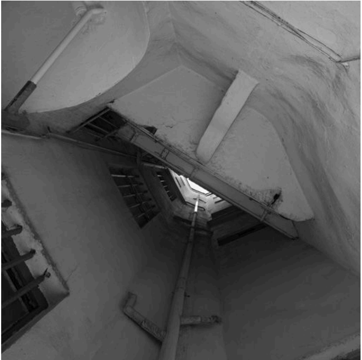
Cour, vue par-dessous depuis la coursière du 1er étage