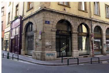
Façade nord sur la rue Chavanne, rez-de-chaussée IVR82_20036904506NUCA