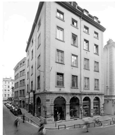
Vue générale des façades ouest et nord sur la rue Chavanne