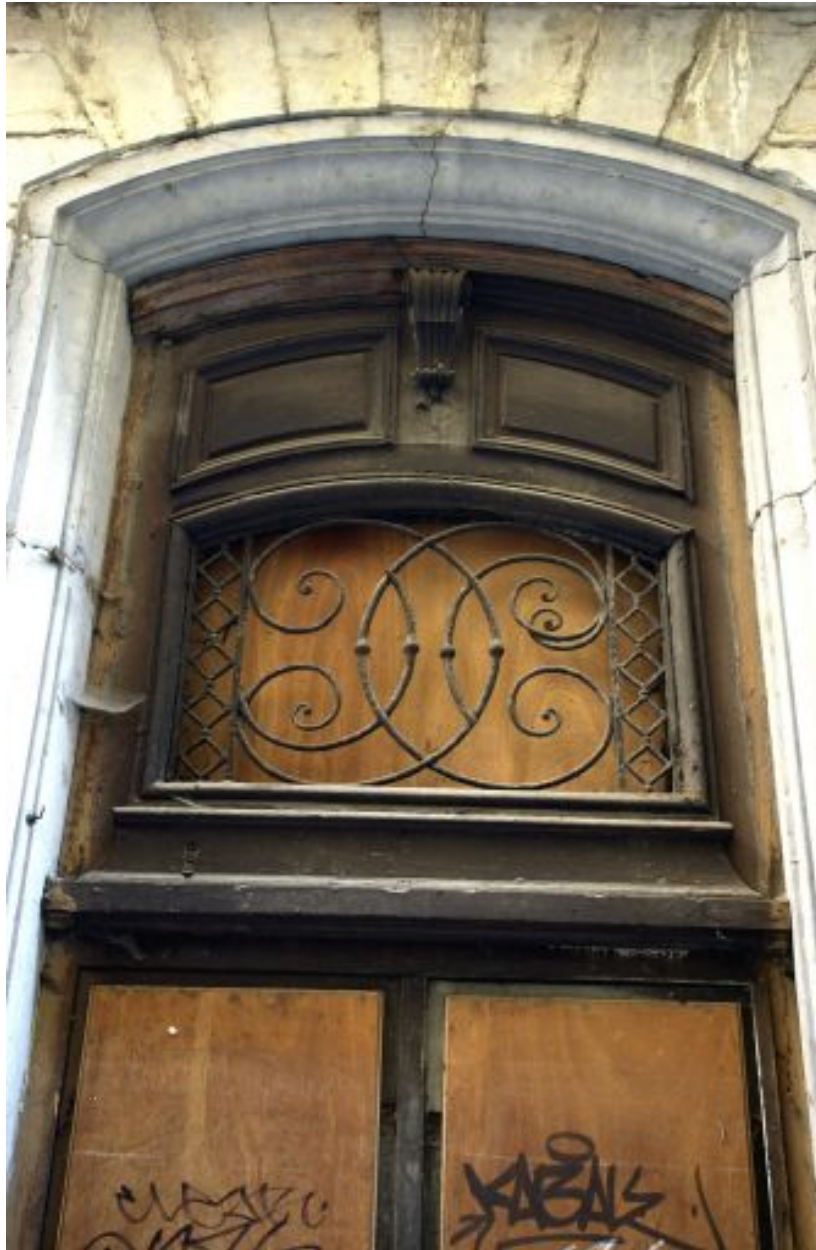
Façade sur la rue Longue, porte, détail