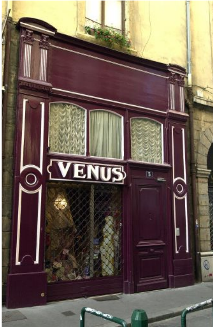
Façade nord sur la rue Chavanne, devanture de boutique