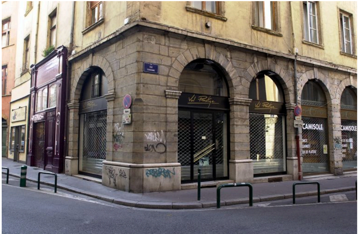
Façade nord sur la rue Chavanne, rez-de-chaussée