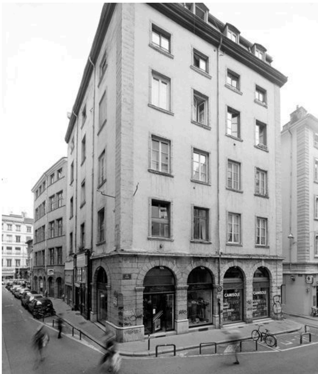
Vue générale des façades ouest et nord sur la rue Chavanne