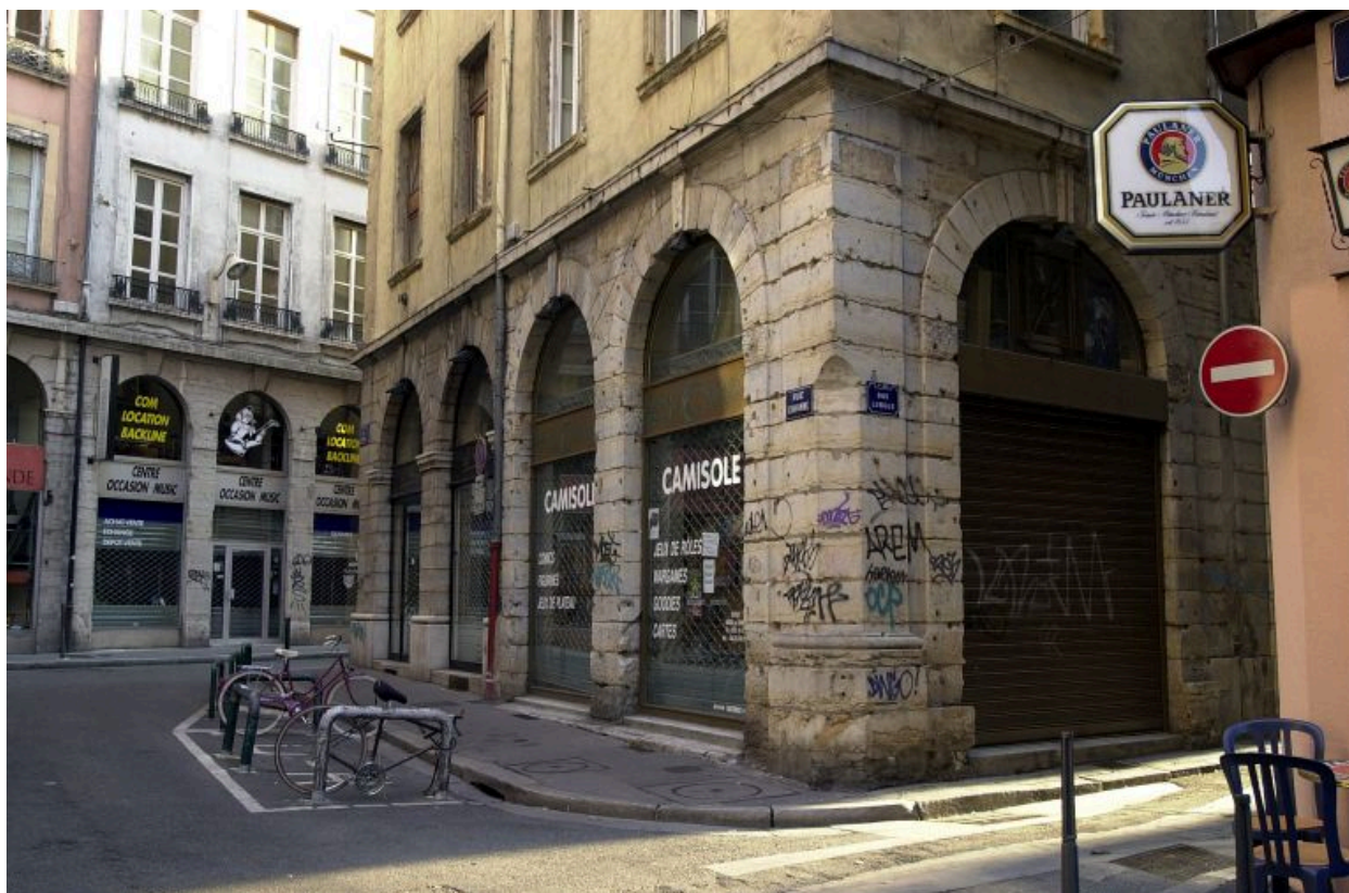
Façade ouest sur la rue Chavanne, rez-de-chaussée