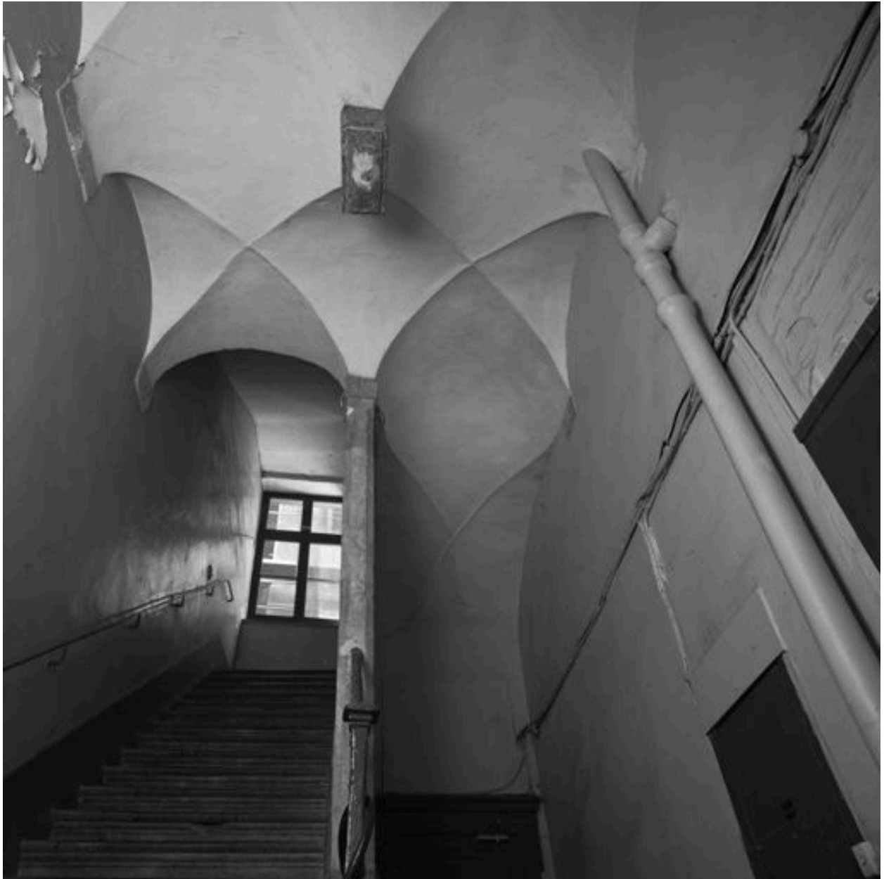
Escalier, voûte du palier du rez-de-chaussée