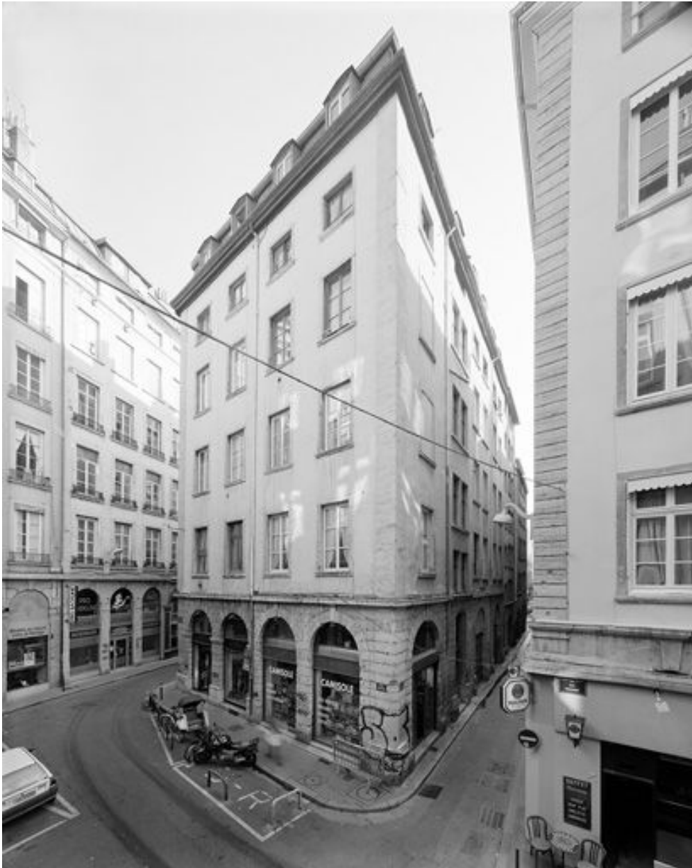
Vue générale de la façade sur la rue Longue et de la façade ouest sur la rue Chavanne