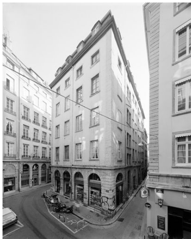
Vue générale de la façade sur la rue Longue et de la façade ouest sur la rue Chavanne IVR82_20056902655V