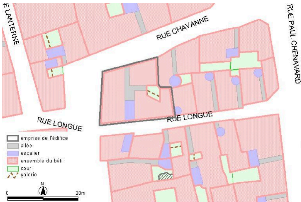
Plan-masse, d'après le système urbain de référence, version 1999