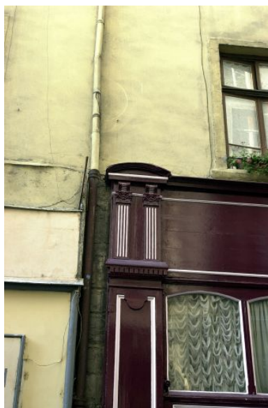
Façade nord sur la rue Chavanne, devanture de boutique, détail IVR82_20036904508NUCA