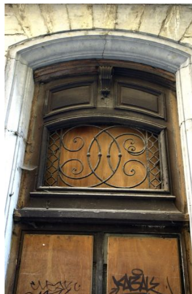
Façade sur la rue Longue, porte, détail