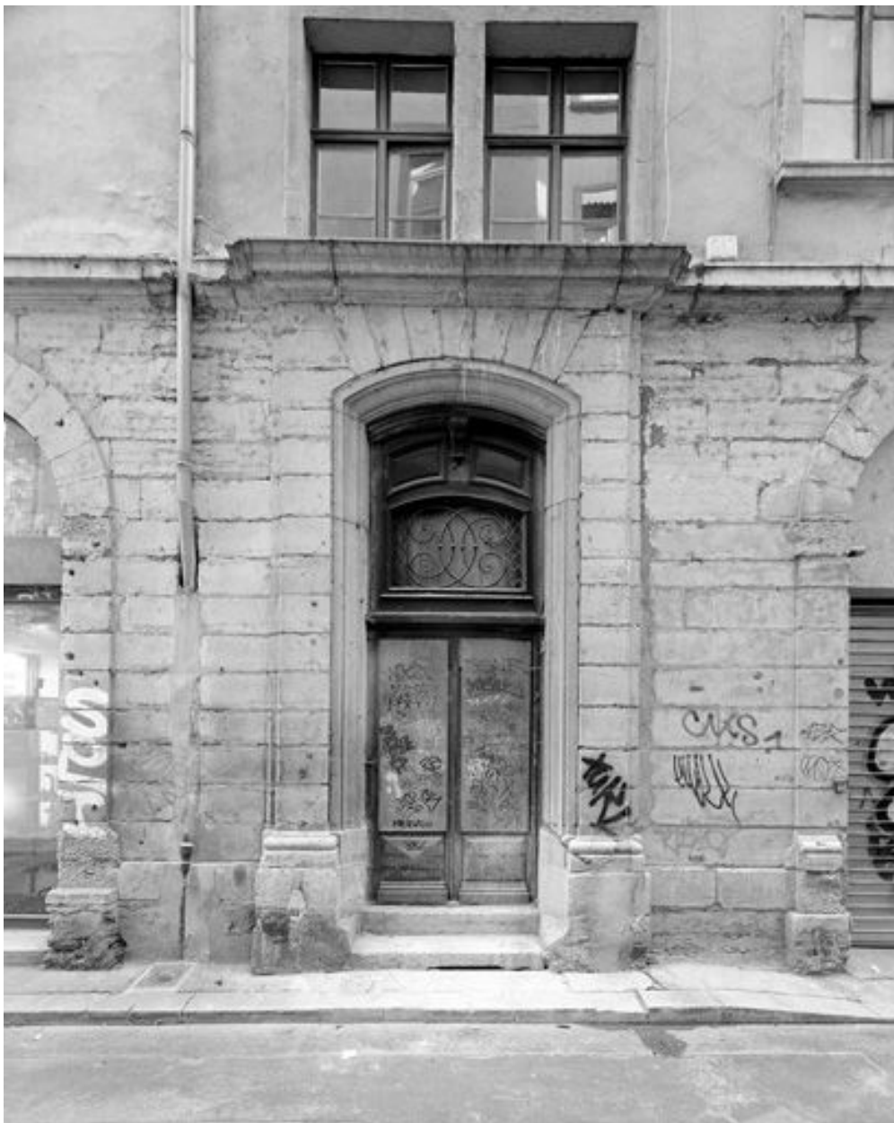
Façade sur la rue Longue, porte