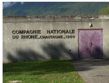
Façade, vue partielle : date portée IVR82_20107300031NUCA