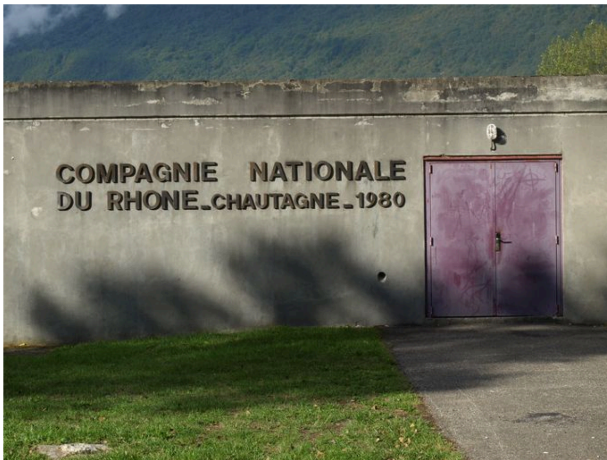
Façade, vue partielle : date portée