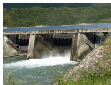
Passe, vue partielle face aval (depuis la rive gauche) IVR82_20107300028NUCA