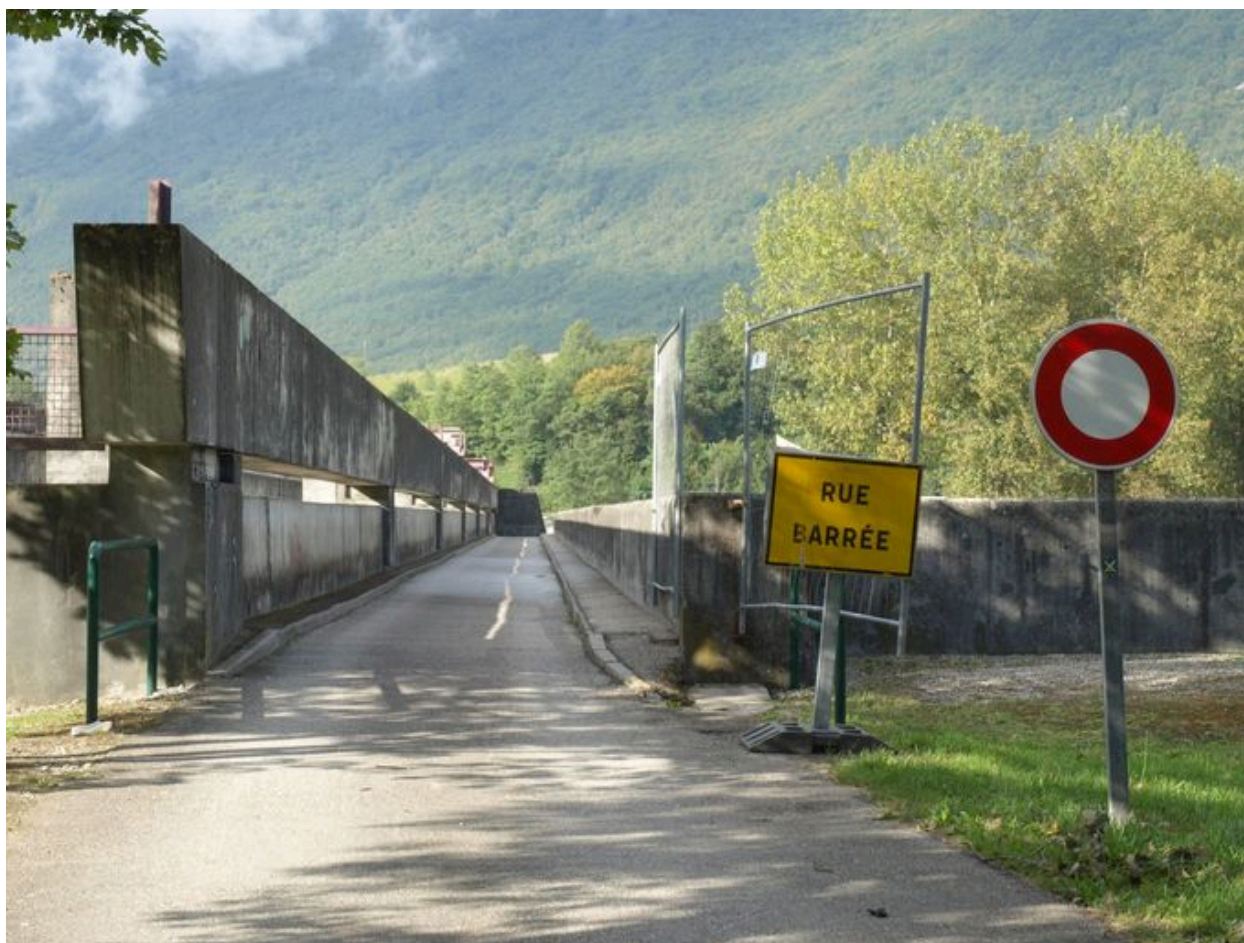
Vue du pont