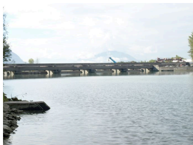
Vue générale, face amont (depuis la rive gauche) IVR82_20107300029NUCA