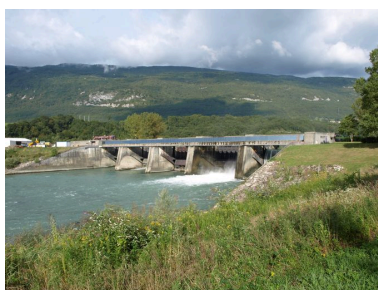
Vue générale, face aval (depuis la rive gauche)