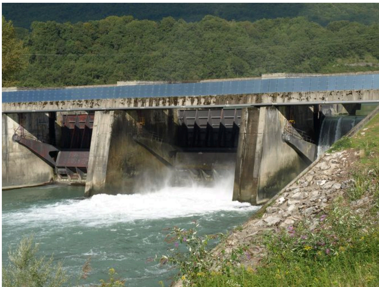
Passé, vue partielle face aval (depuis la rive gauche)