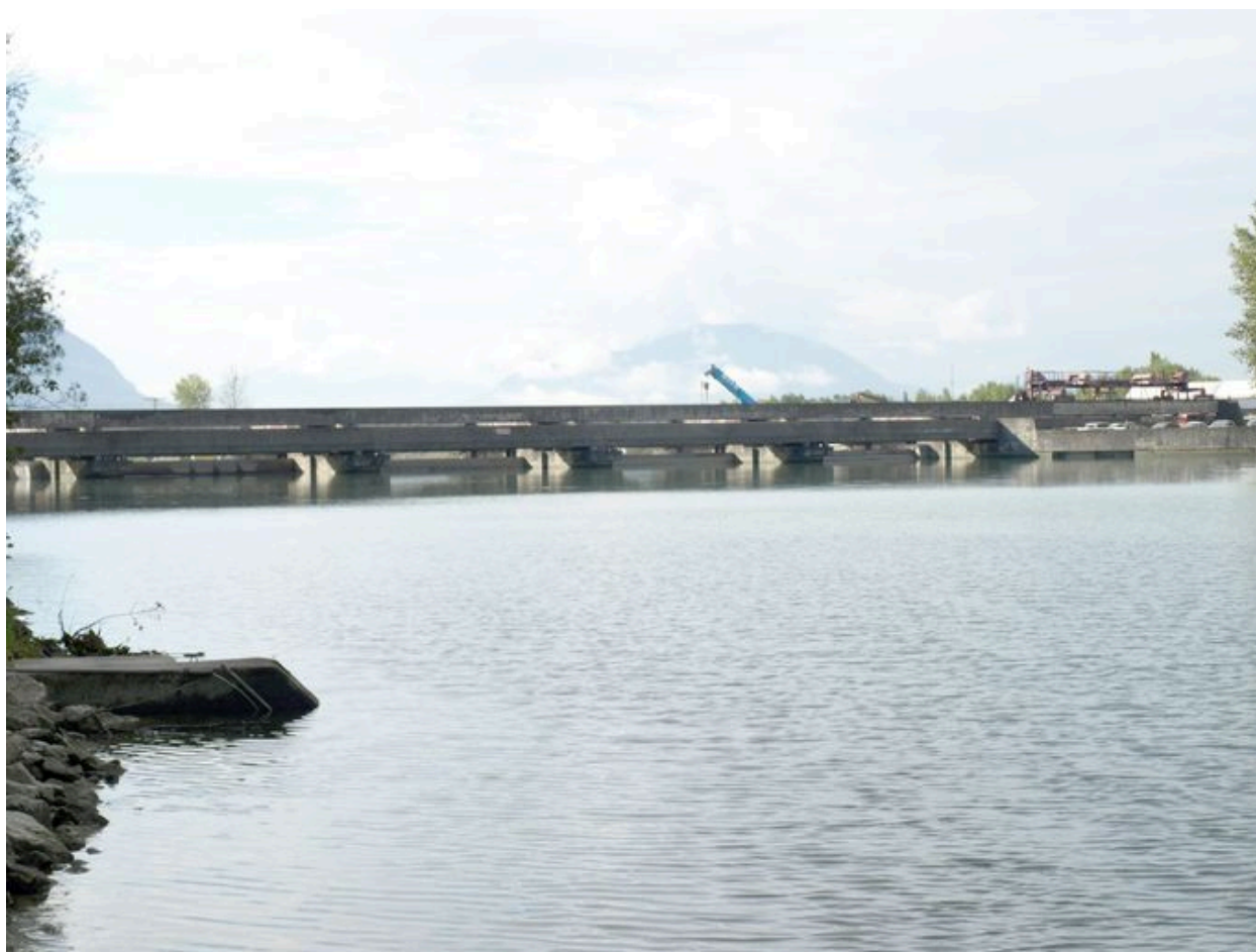
Vue générale, face amont (depuis la rive gauche)