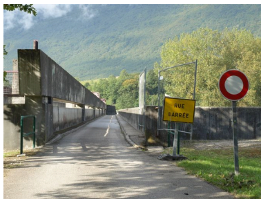
Vue du pont IVR82_20107300030NUCA