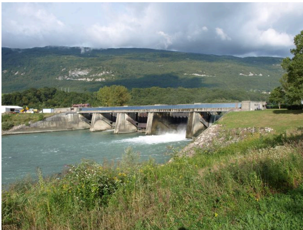
Vue générale, face aval (depuis la rive gauche)