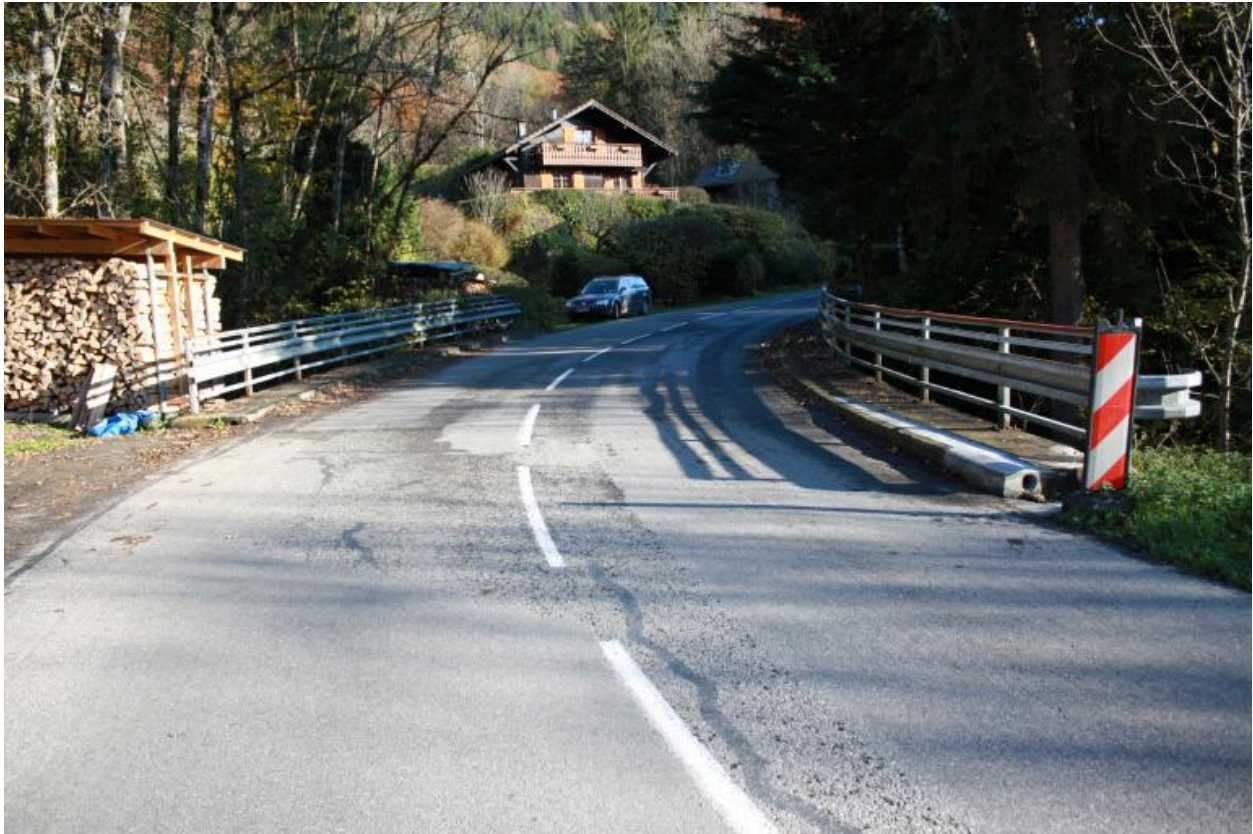
Pont du Martelet, contexte, chaussée et garde corps