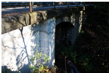
Pont du Martelet, face aval IVR84_20207401285NUCA