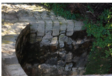
Pont du Martelet, détails bandeau et harpage IVR84_20207401288NUCA