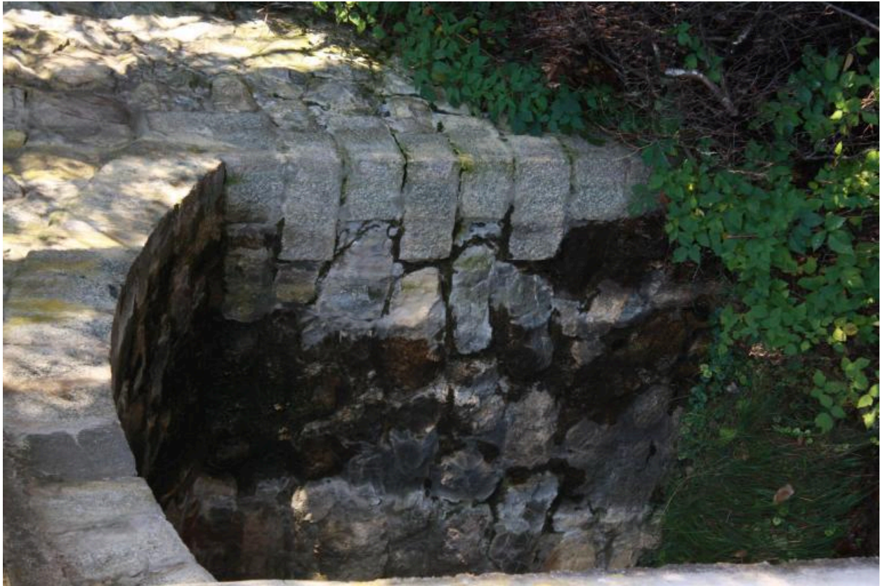
Pont du Martelet, détails bandeau et harpage