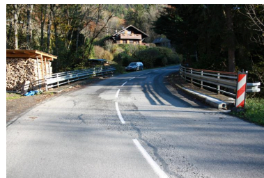
Pont du Martelet, contexte, chaussée et garde corps IVR84_20207401286NUCA