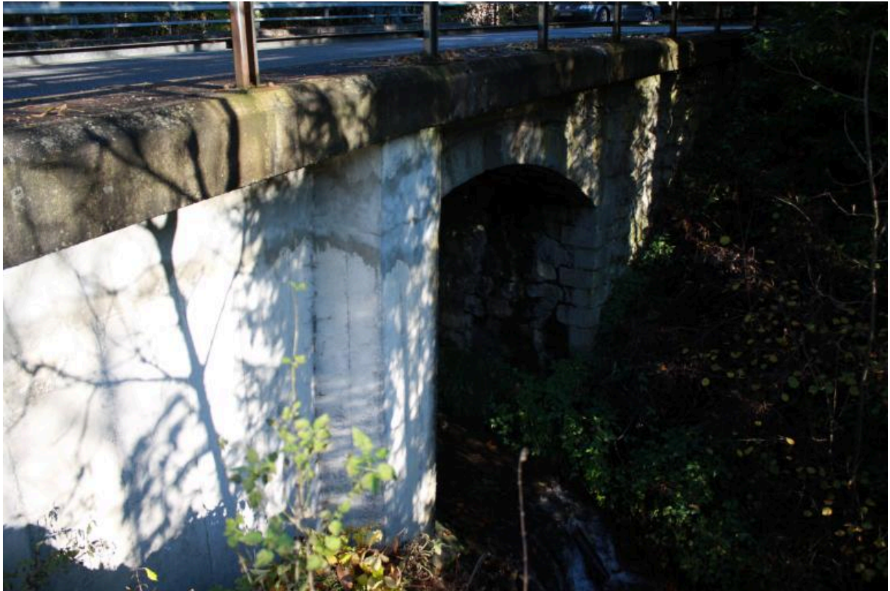
Pont du Martelet, face aval