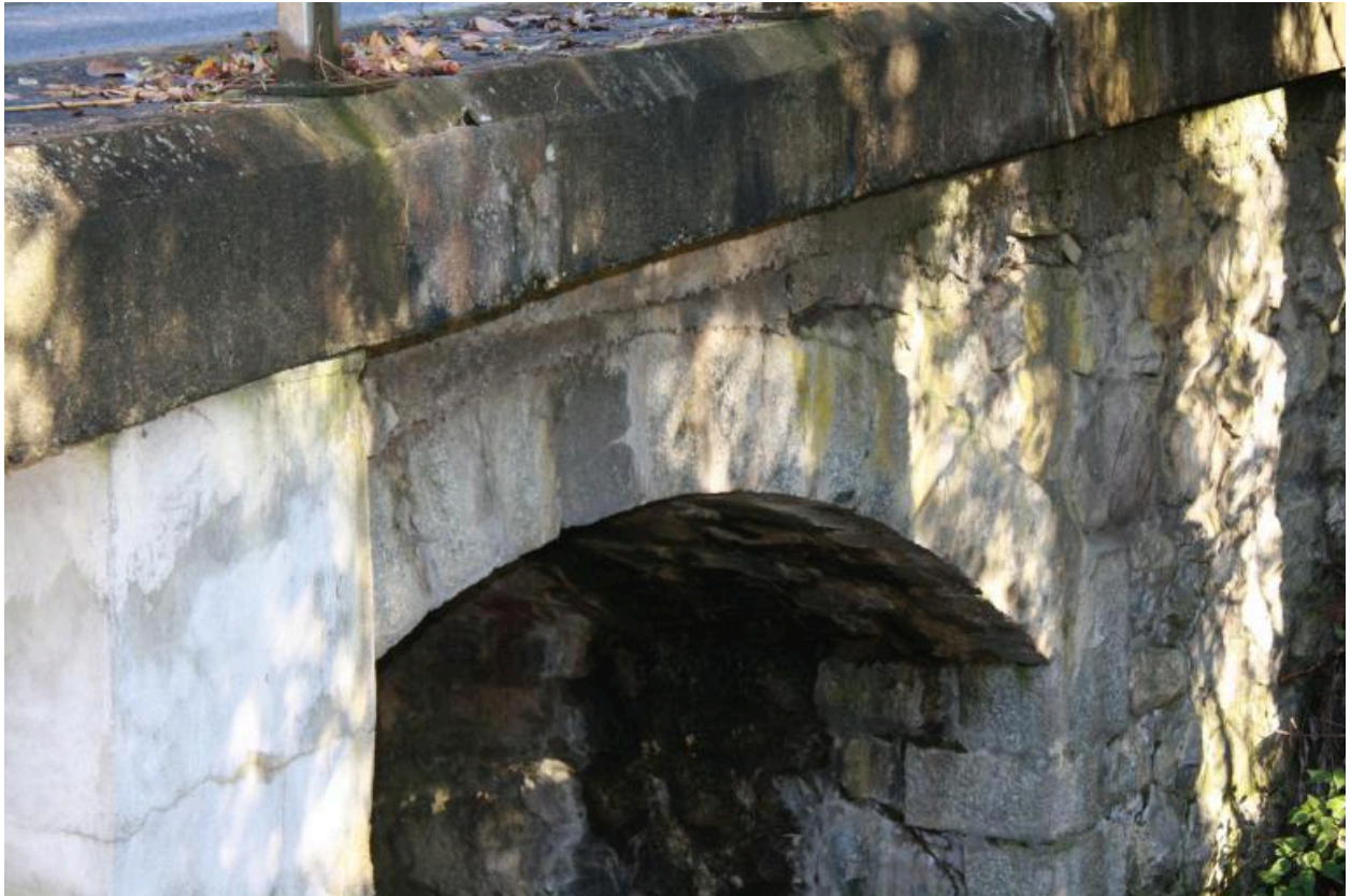
Pont du Martelet, détail voute