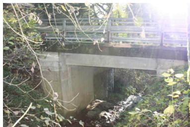
Pont du Martelet, face amont IVR84_20197401285NUCA