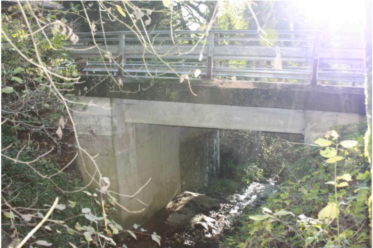
Pont du Martelet, face amont