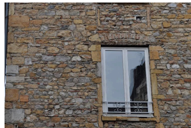
Bâtiment d'angle, détail d'une fenêtre IVR84_20166902258NUCA