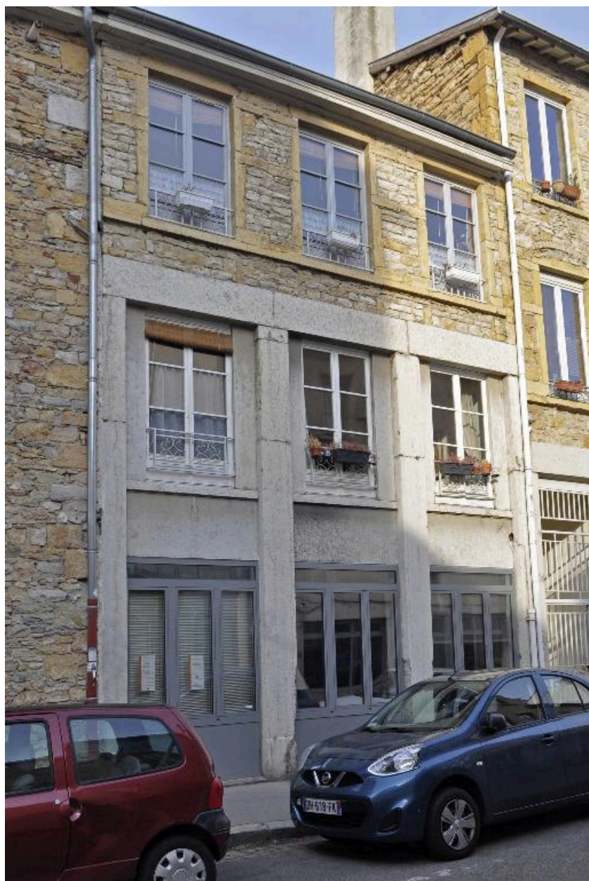
Bâtiment nord, élévation sur la rue Chalopin