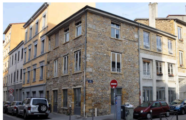
Vue générale depuis l'est