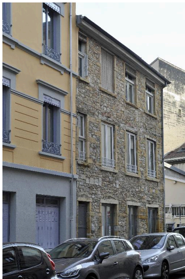
Bâtiment d'angle, élévation principale rue de la Thibaudière IVR84_20166902257NUCA