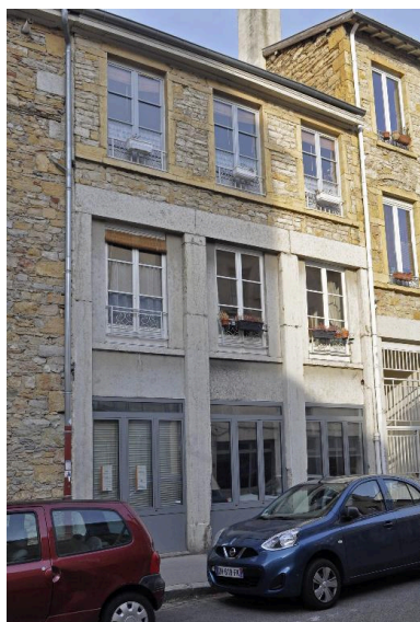
Bâtiment nord, élévation sur la rue Chalopin