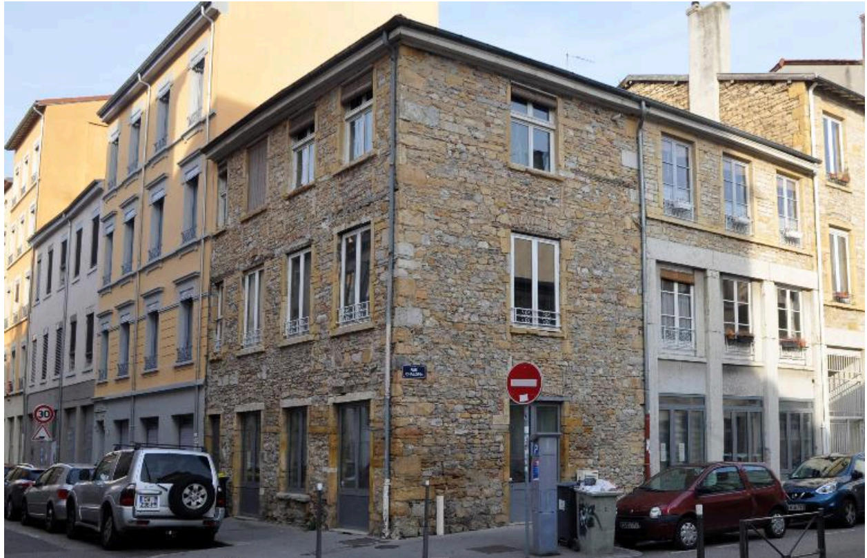
Vue générale depuis l'est