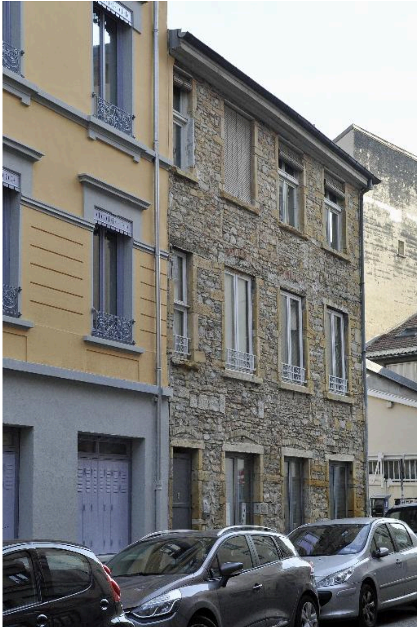
Bâtiment d'angle, élévation principale rue de la Thibaudière