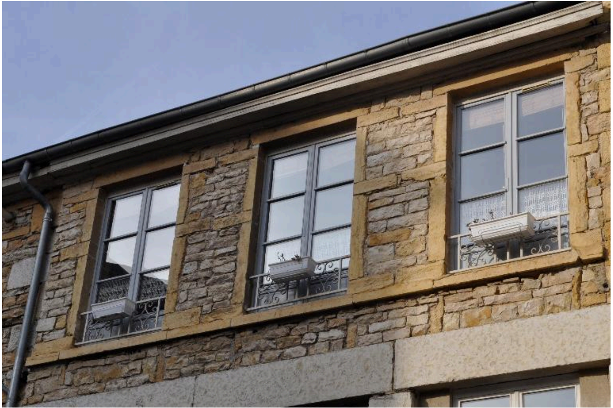
Bâtiment nord, détail des fenêtres