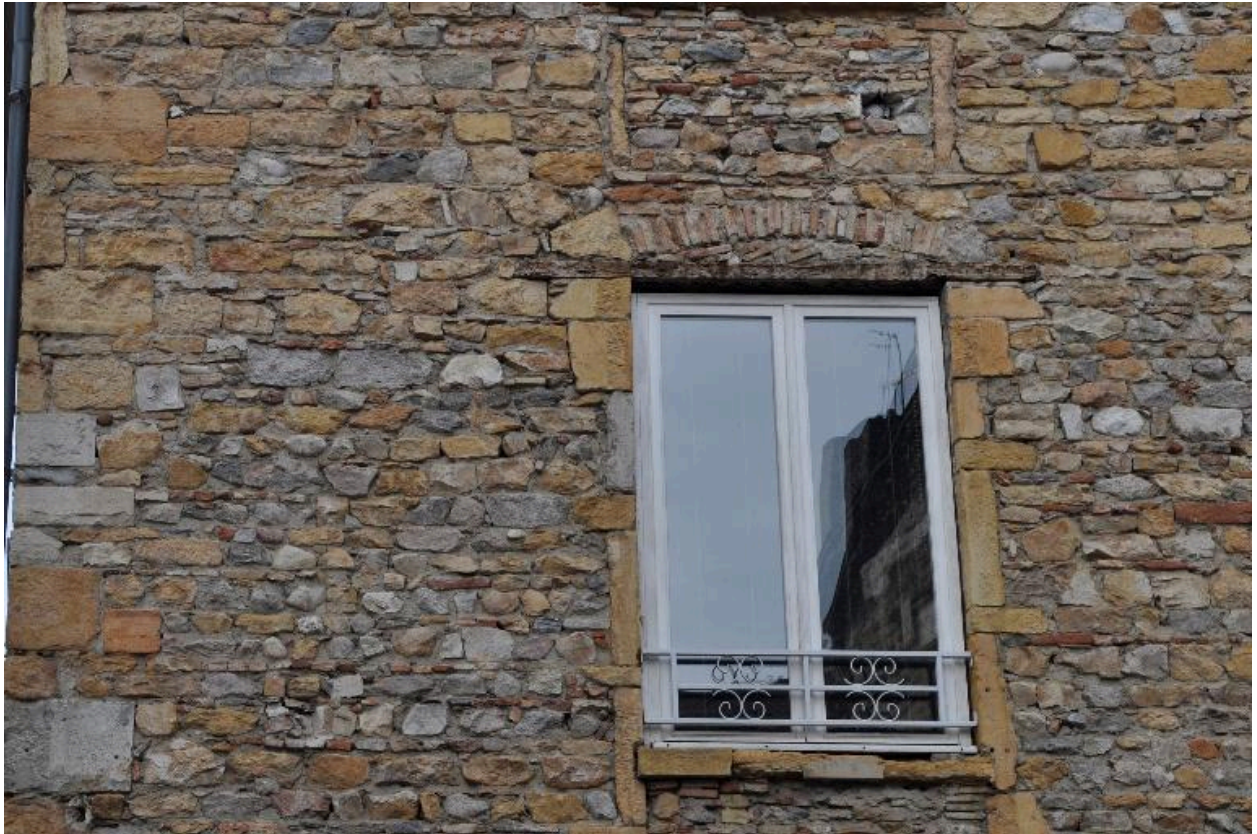
Bâtiment d'angle, détail d'une fenêtre