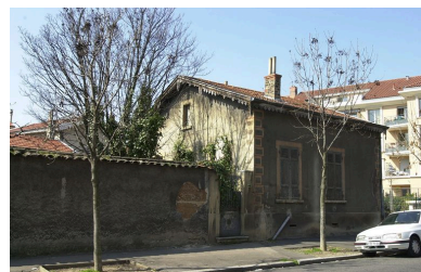
Vue générale de la maison IVR82_20036903176NUCA