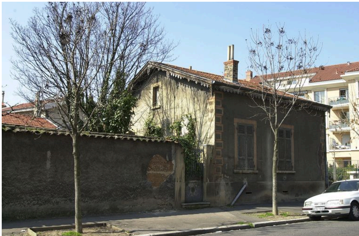
Vue générale de la maison