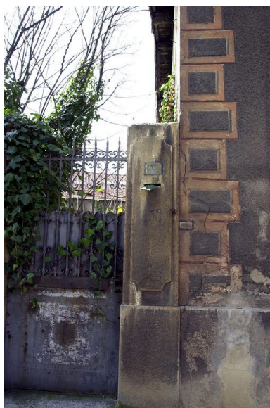
Entrée piétonne, boîte aux lettres encastrée dans le pilier de la porte et détail de l'enduit avec fausse chaîne d'angle harpée