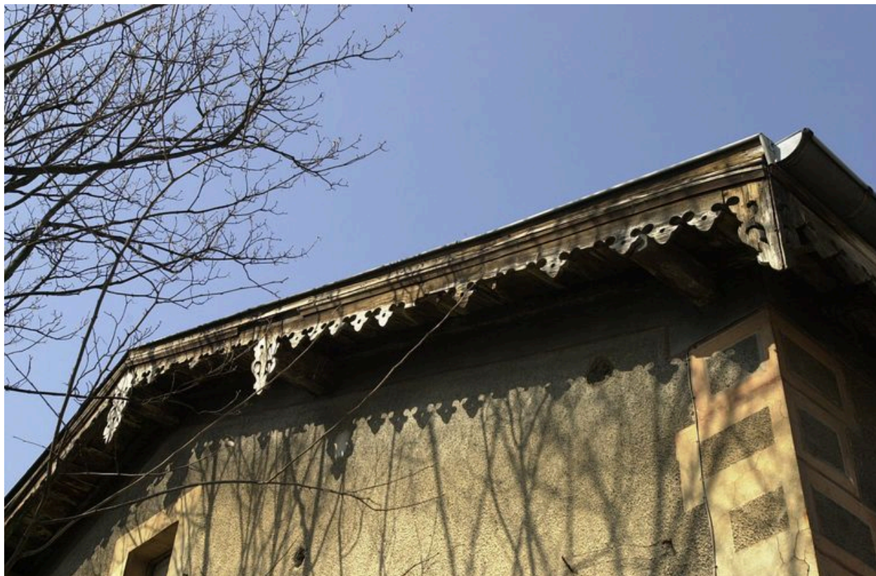
Détail du lambrequin de bois ornant l'avant-toit