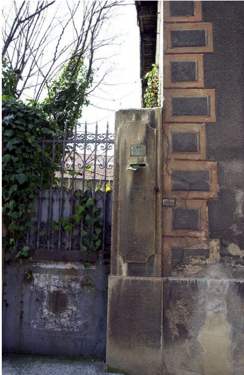
Entrée piétonne, boîte aux lettres encastrée dans le pilier de la porte et détail de l'enduit avec fausse chaîne d'angle harpée