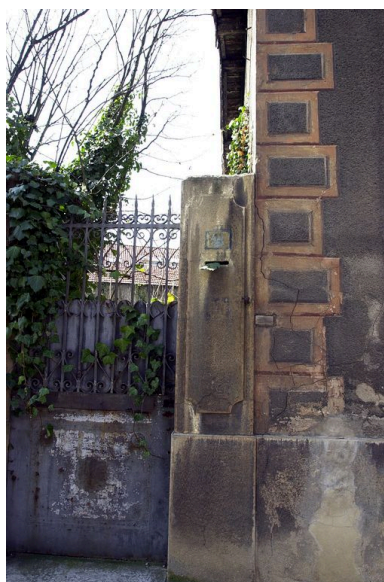
Entrée piétonne, boîte aux lettres encastrée dans le pilier de la porte et détail de l'enduit avec fausse chaîne d'angle harpée