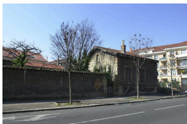
Vue générale IVR82_20036903175NUCA