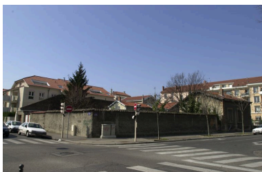
Vue de situation IVR82_20036903174NUCA