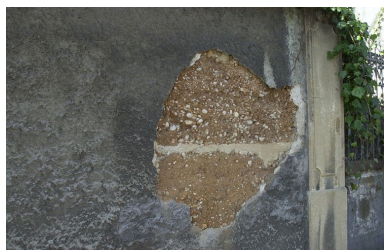
Détail du pisé de terre revêtu d'enduit du mur de clôture