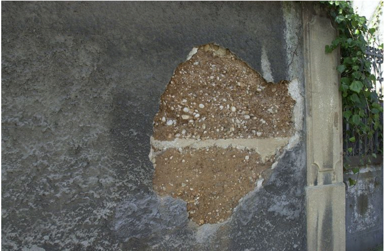
Détail du pisé de terre revêtu d'enduit du mur de clôture