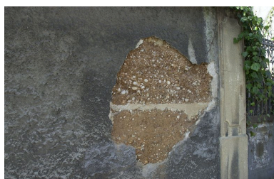
Détail du pisé de terre revêtu d'enduit du mur de clôture