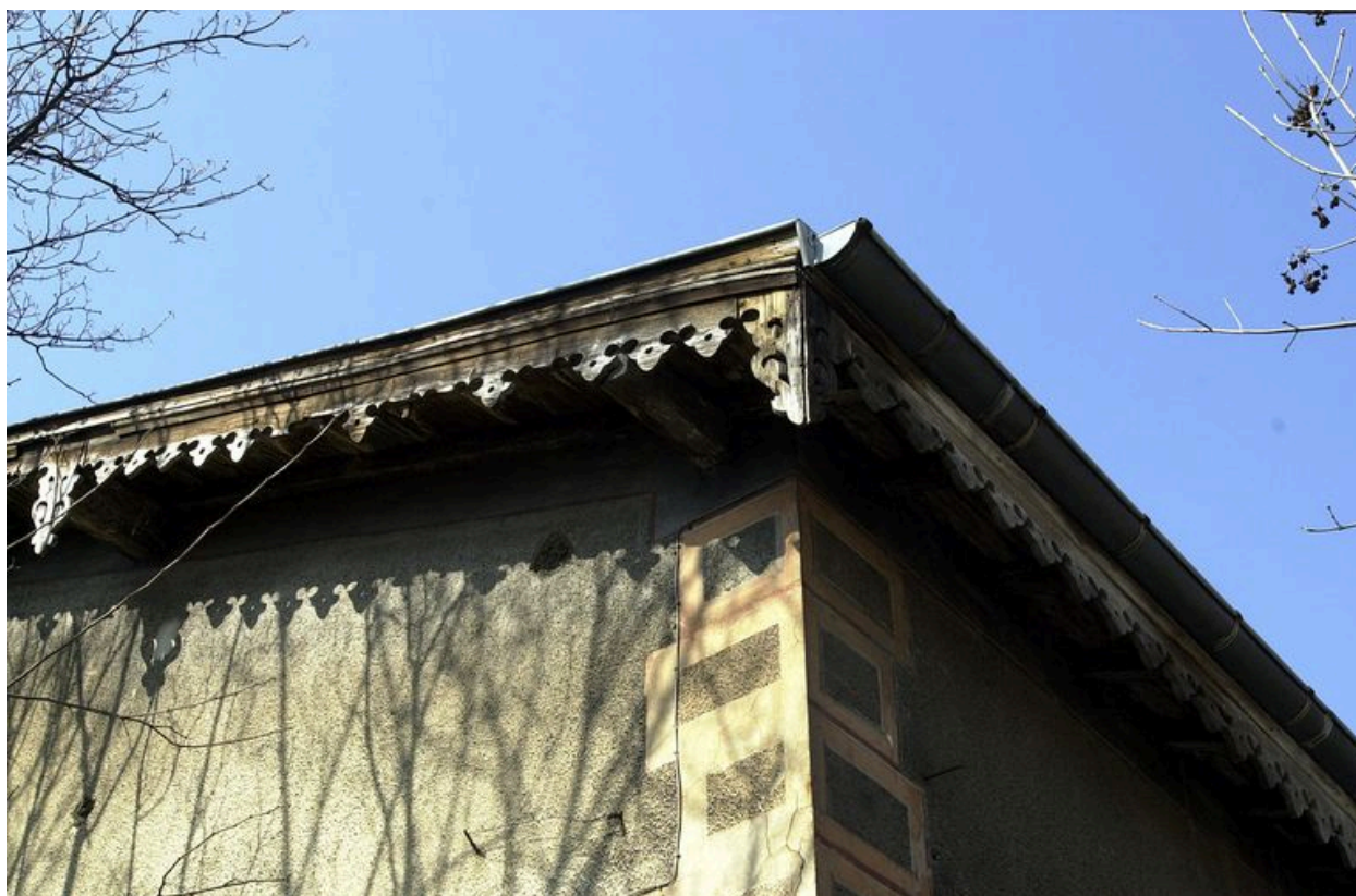
Détail du lambrequin de bois à l'angle du toit