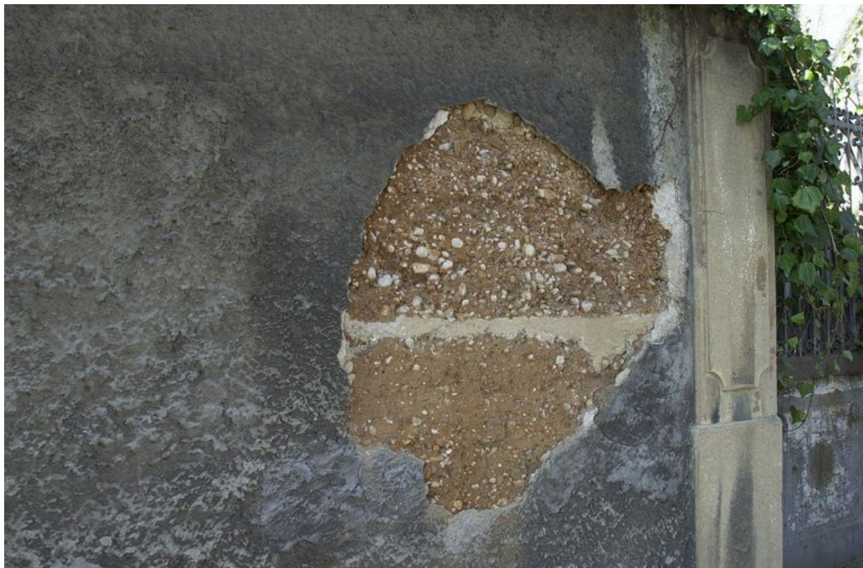
Détail du pisé de terre revêtu d'enduit du mur de clôture