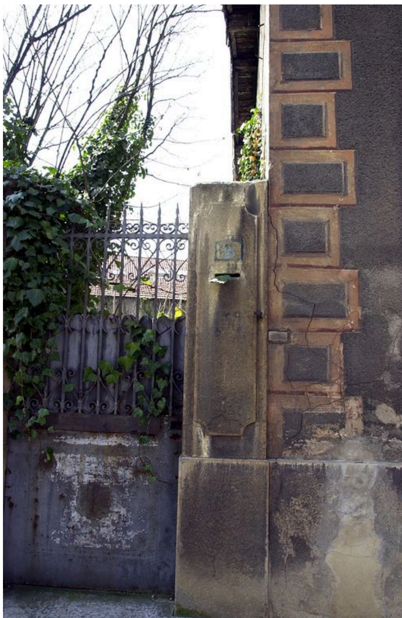
Entrée piétonne, boîte aux lettres encastrée dans le pilier de la porte et détail de l'enduit avec fausse chaîne d'angle harpée