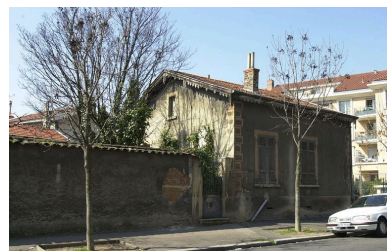
Vue générale de la maison