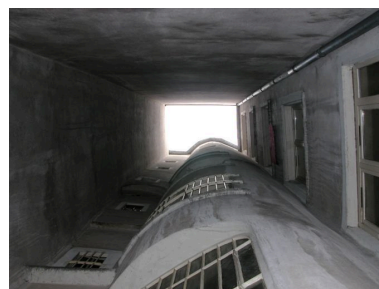
Cour, vue générale par-dessous IVR82_20046900907NUCA