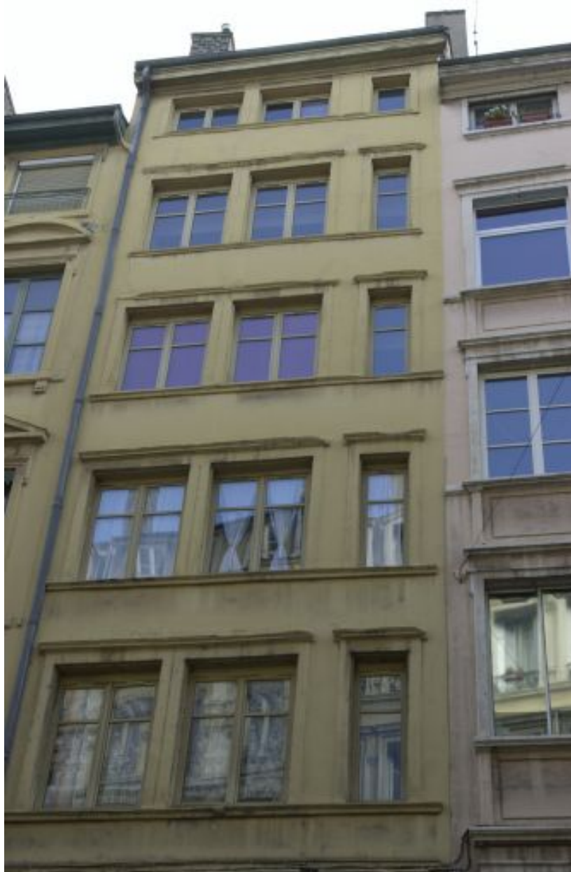
Façade, niveaux 3 à 7