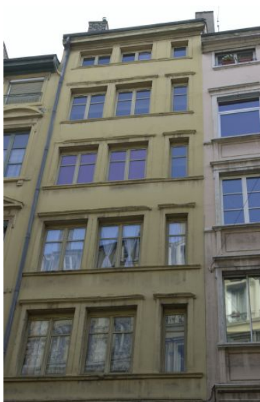
Façade, niveaux 3 à 7 IVR82_20036901108NUCA