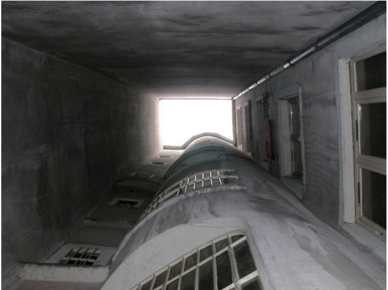
Cour, vue générale par-dessous