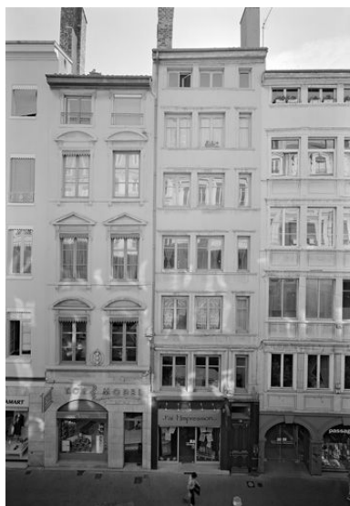
Façade, vue générale IVR82_20056901729P