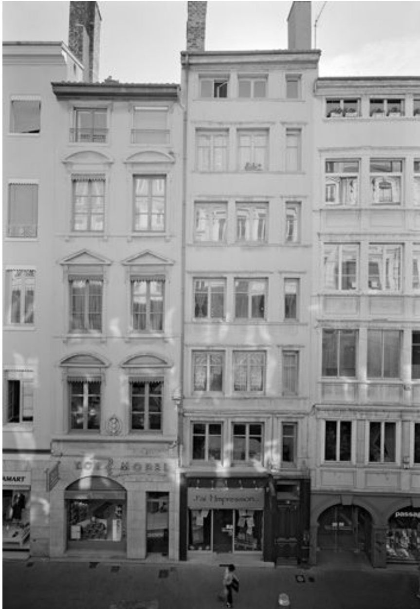
Façade, vue générale