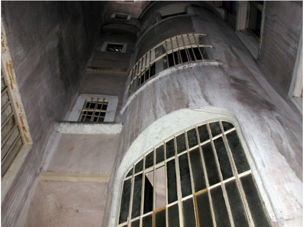
Cour, tour d'escalier et anciennes galeries murées