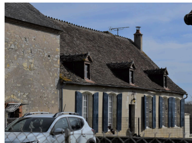
Vue de la façade occidentale. IVR84_20240300028NUC4A