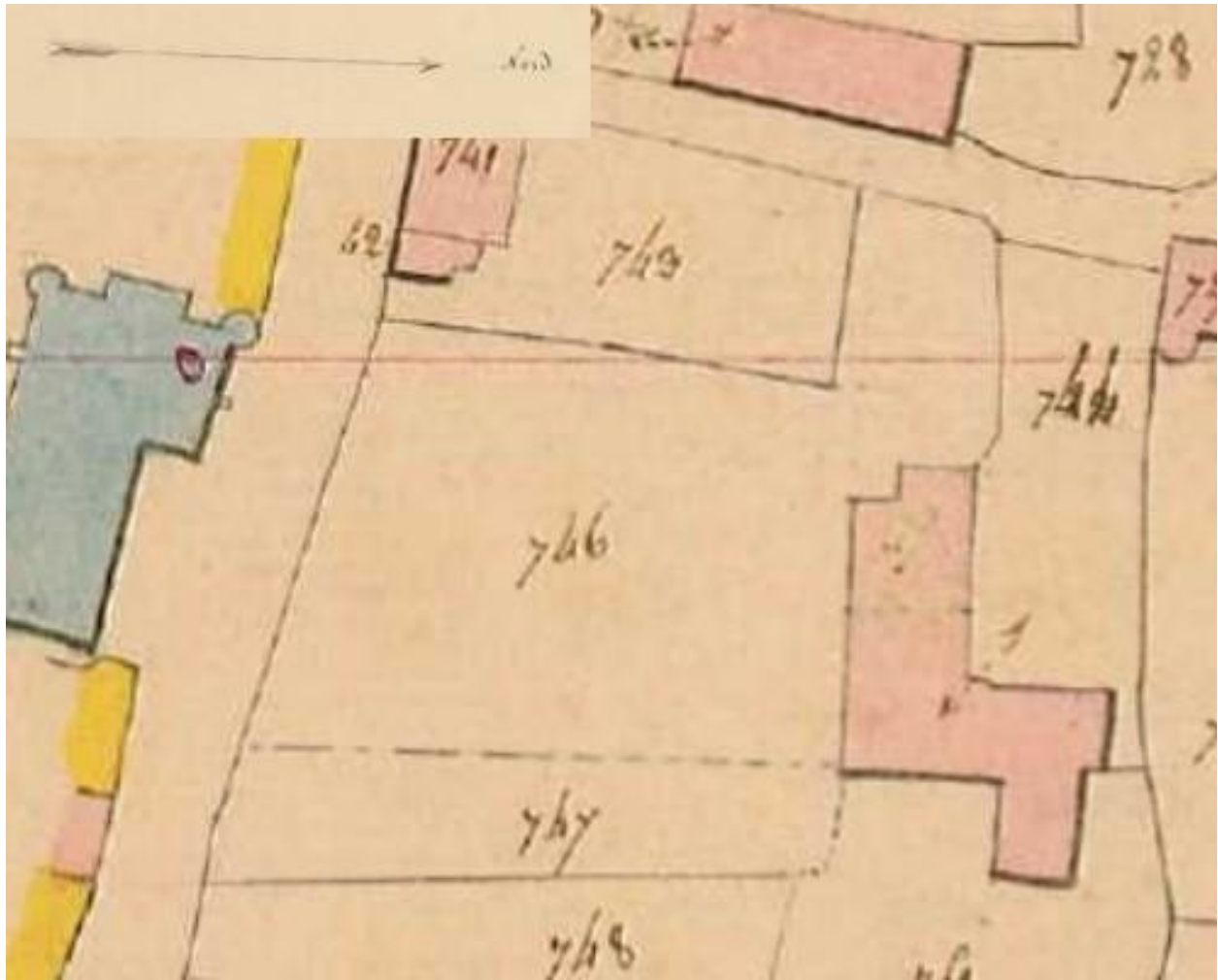
Extrait du plan cadastral dit napoléonien de 1831 (AD 03 : 3P 3056 - Château-sur-Allier : section A4 parcelle 744.