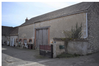
Vue du côté est, sur cour. IVR84_20240300029NUC4A

IVR84_20240300039NUDA