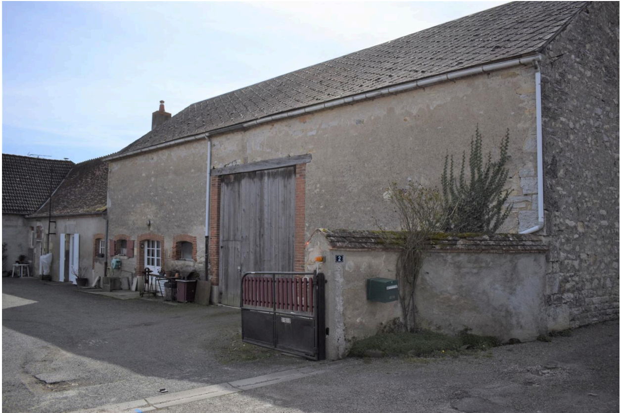
Vue du côté est, sur cour.