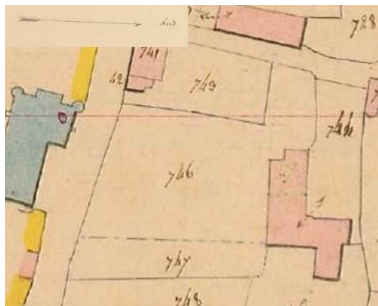
Extrait du plan cadastral dit napoléonien de 1831 (AD 03 : 3P 3056 - Château-sur- Allier : section A4 parcelle 744. IVR84_20240300040NUCA