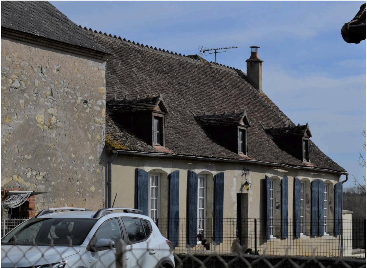
Vue de la façade occidentale.