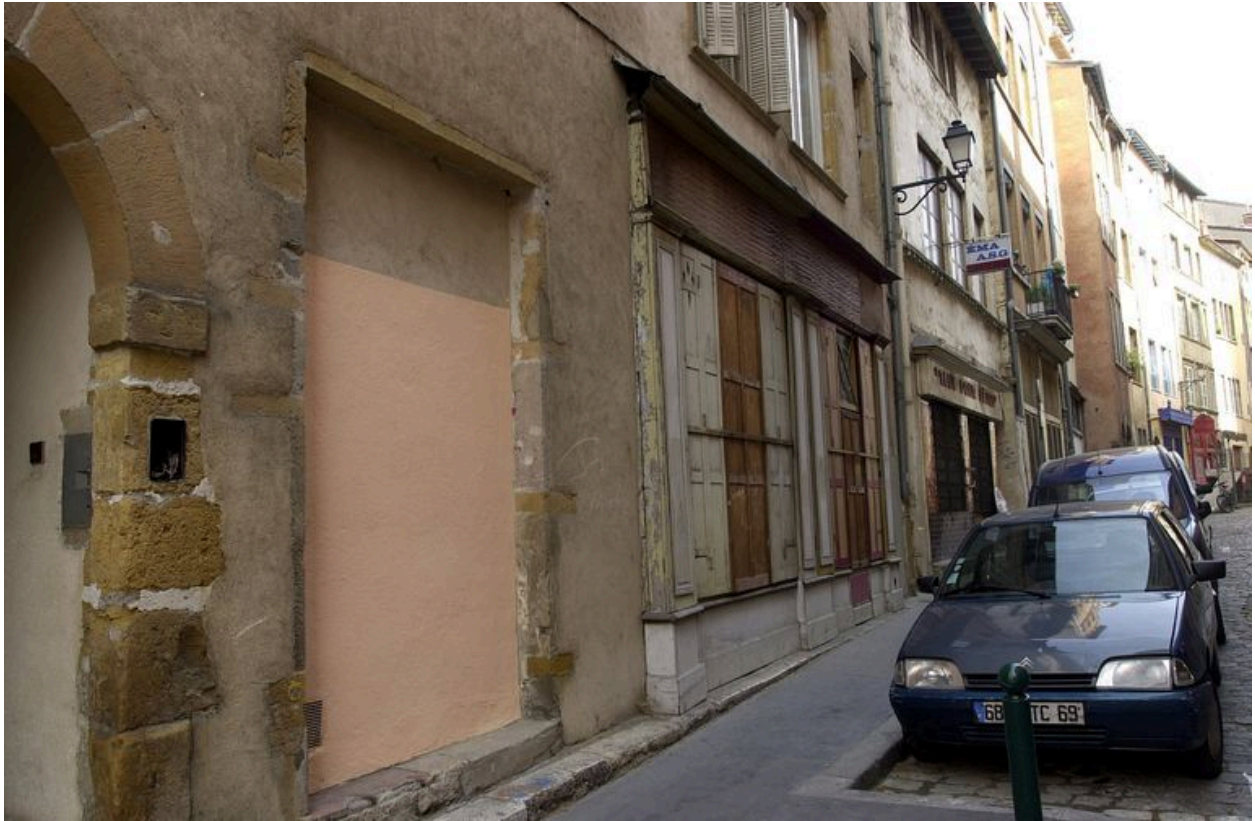
Vue générale du rez-de-chaussée