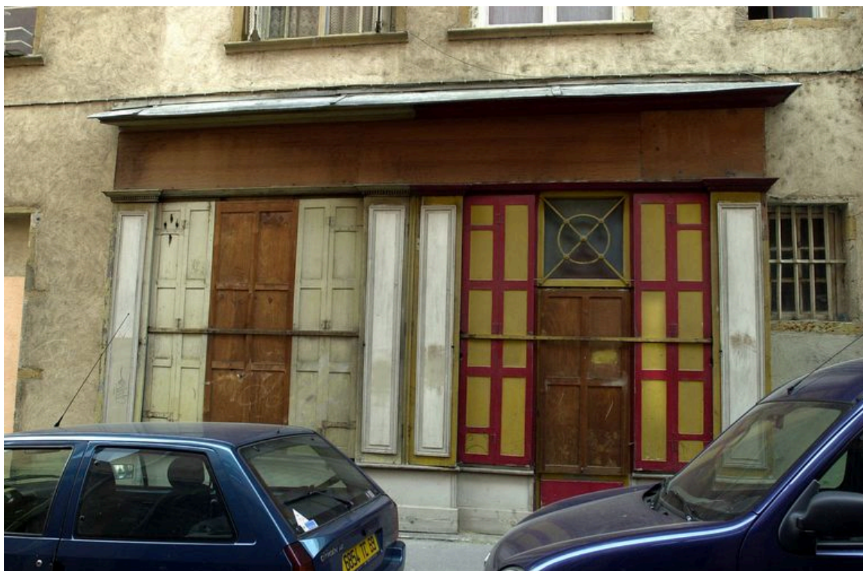
Devanture de la boutique