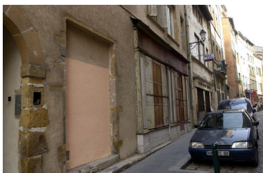
Vue générale du rez-de-chaussée IVR82_20036902531NUCA