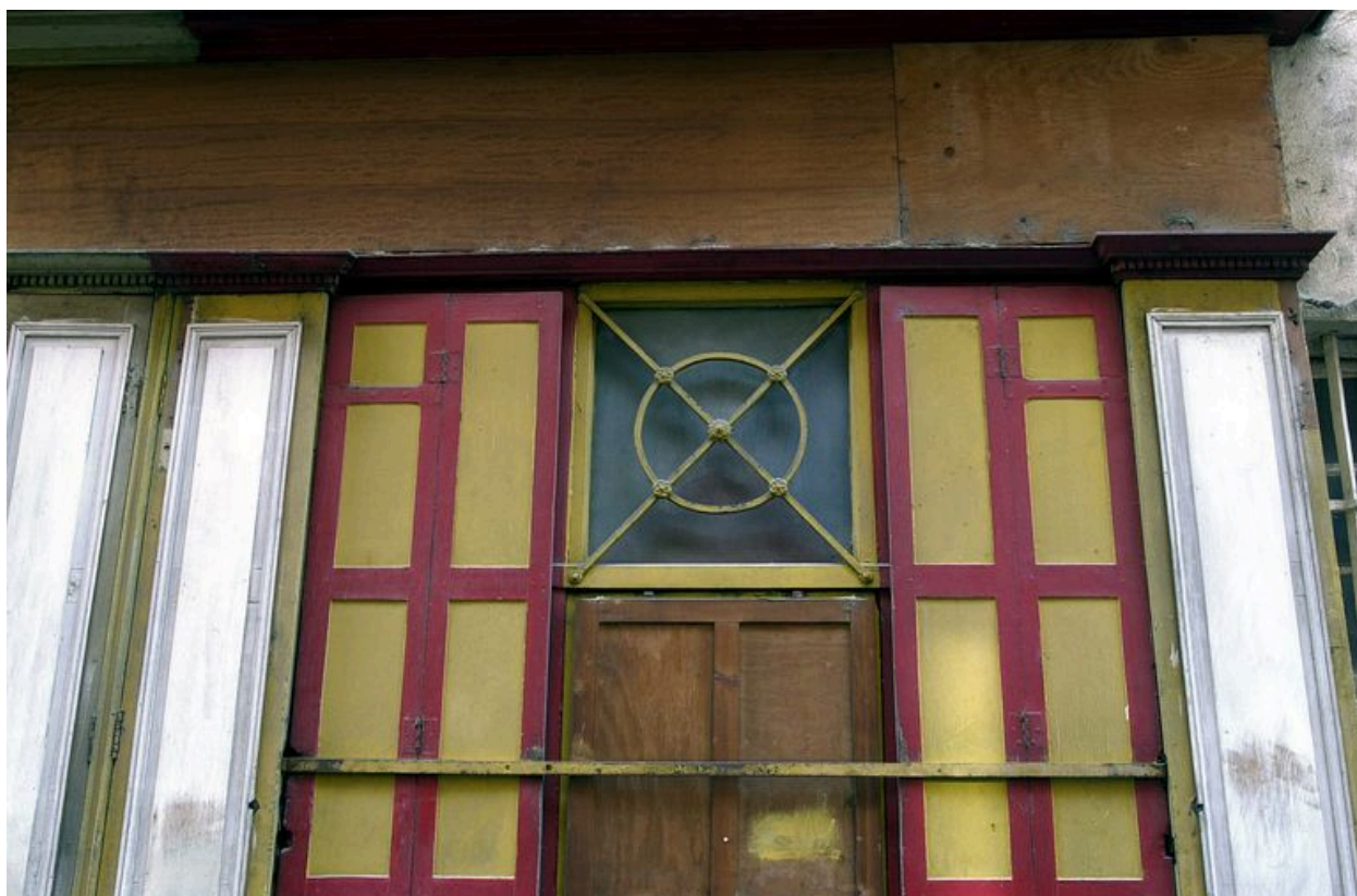
Détail de la devanture