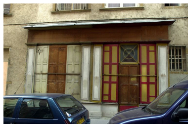
Devanture de la boutique IVR82_20036902532NUCA