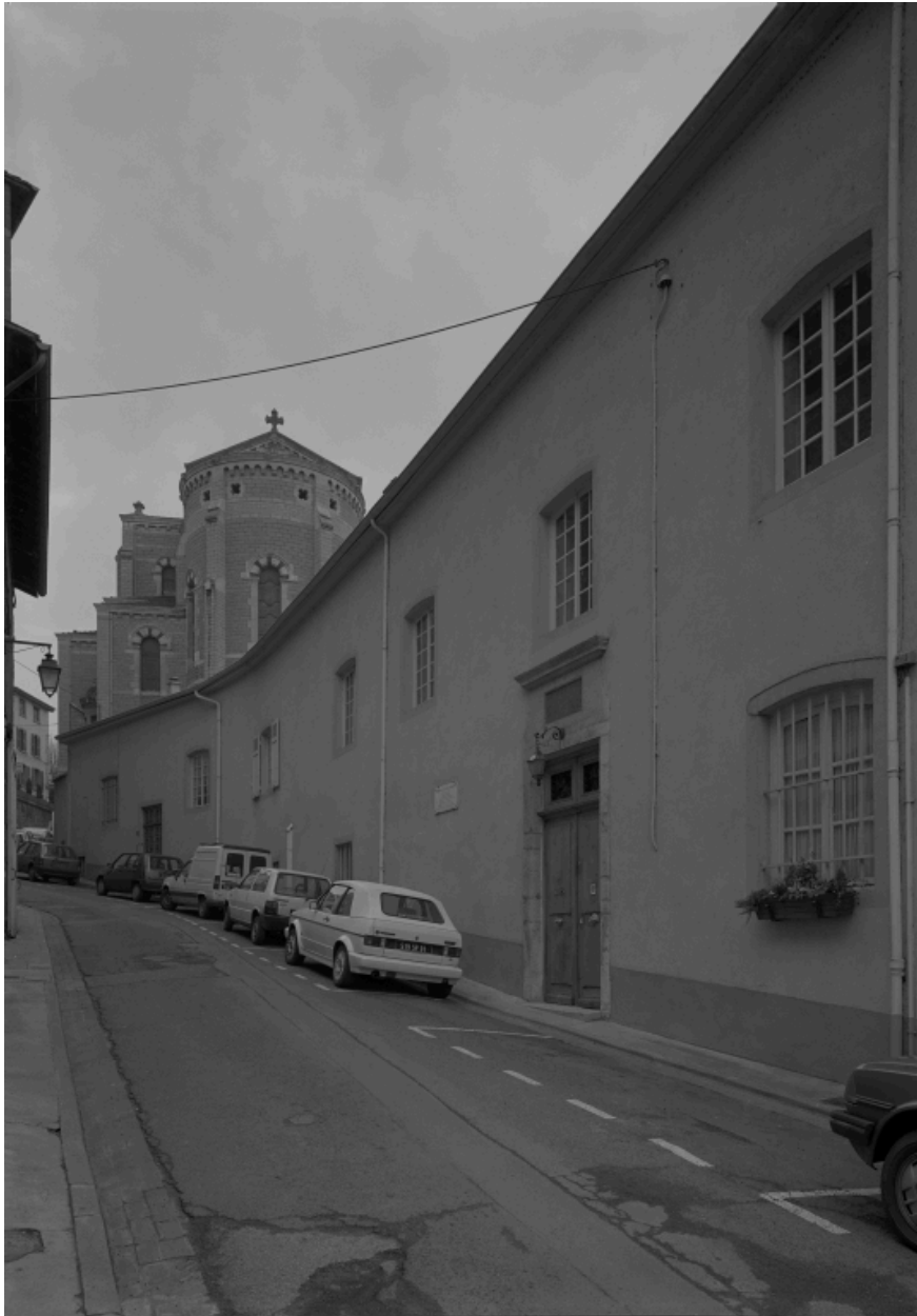
Elévation sur rue.