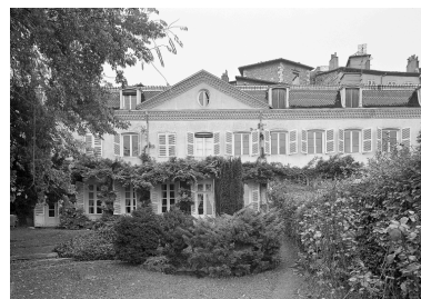
Elévation sur jardin.