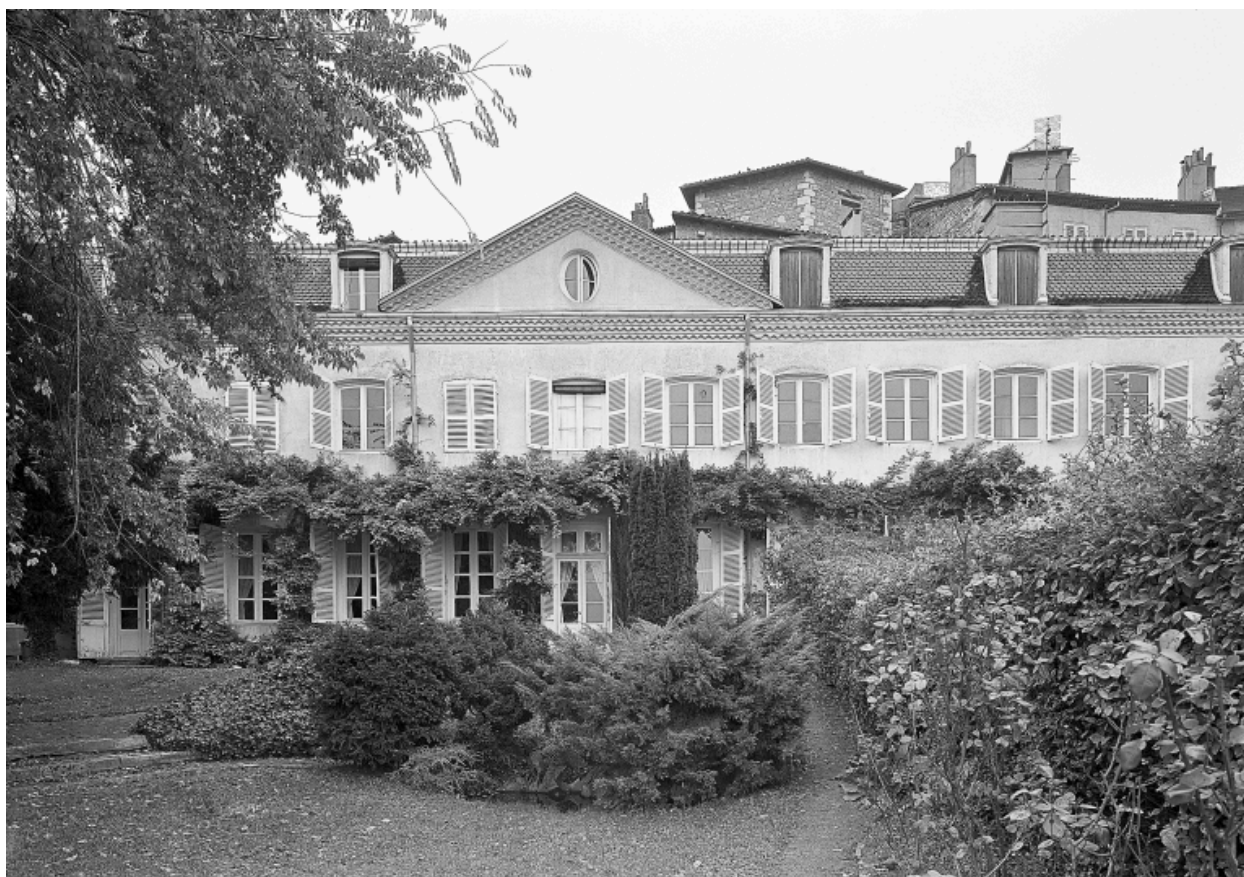
Elévation sur jardin.