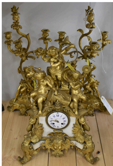
Vue générale de la garniture de cheminée IVR84_20226303210NUC4A