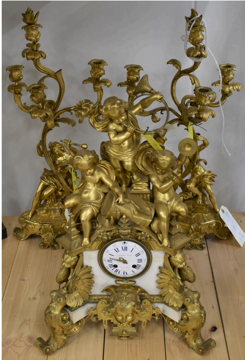
Vue générale de la garniture de cheminée