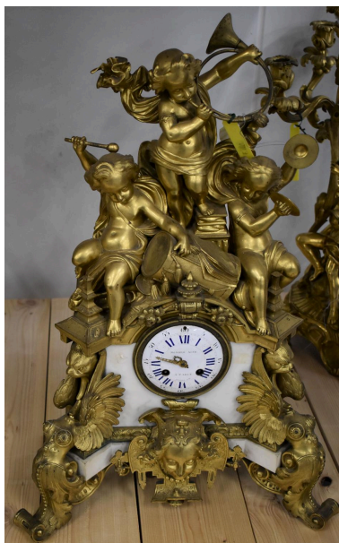
Vue générale de la pendule IVR84_20226303212NUC4A