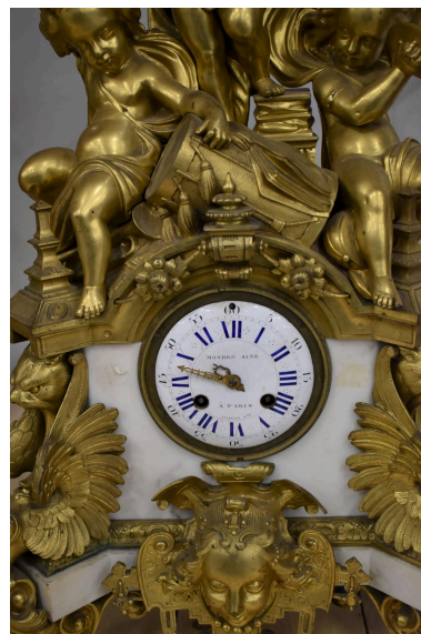
Détail de la pendule