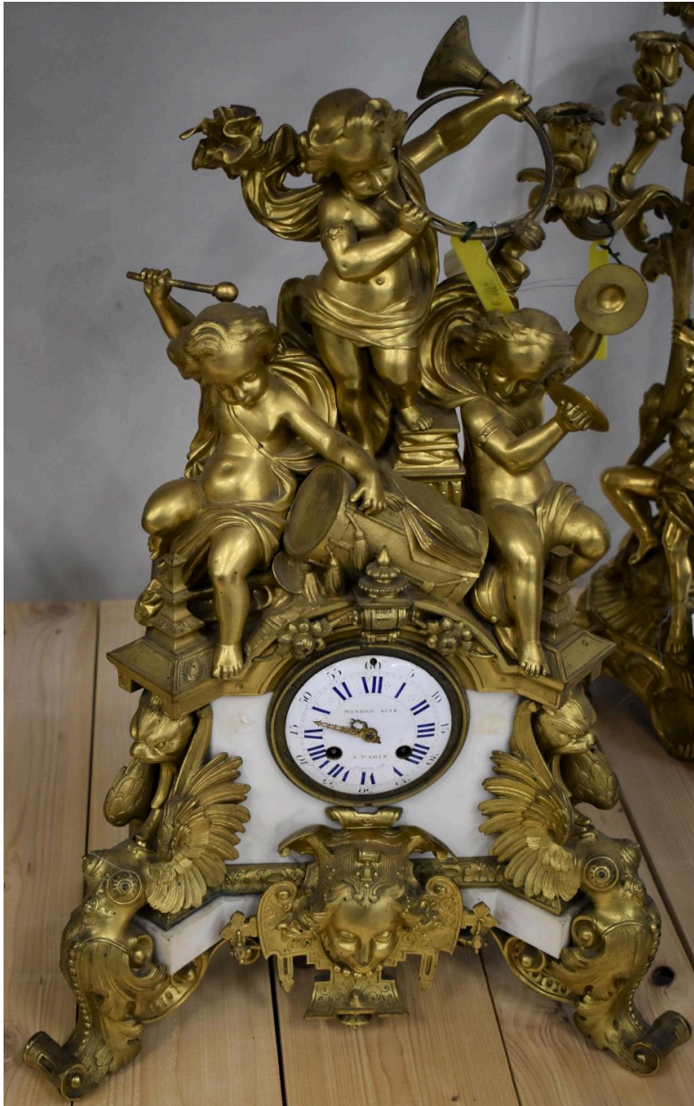
Vue générale de la pendule