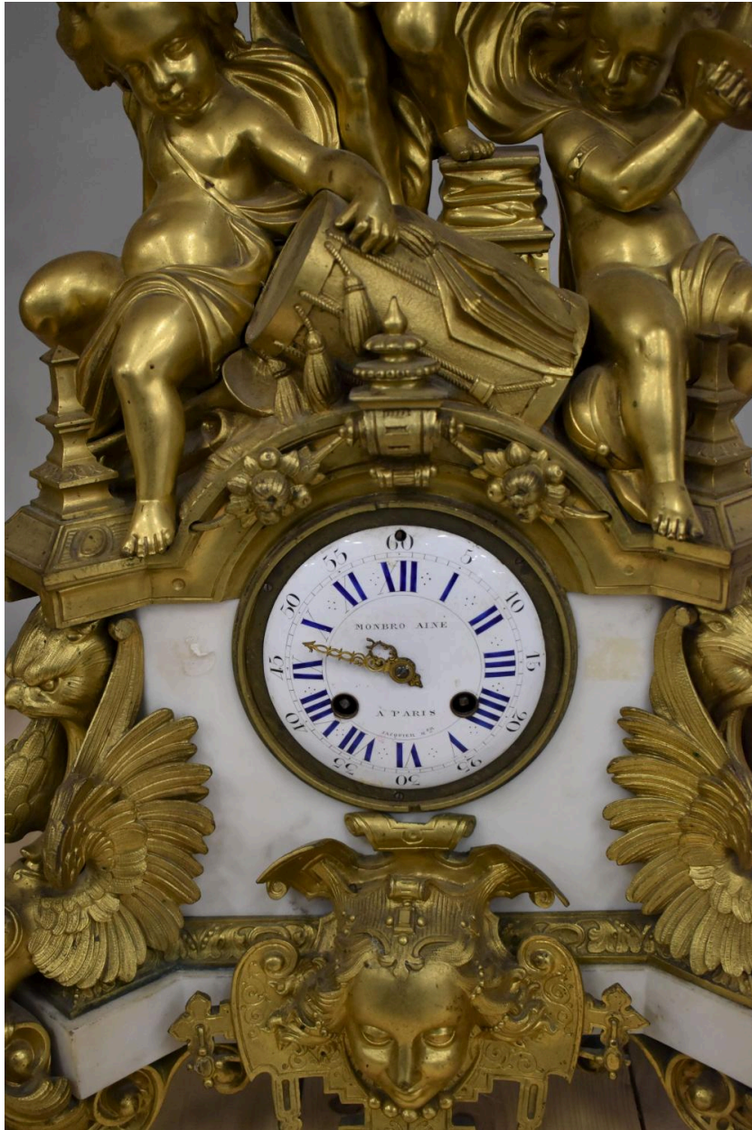
Détail de la pendule