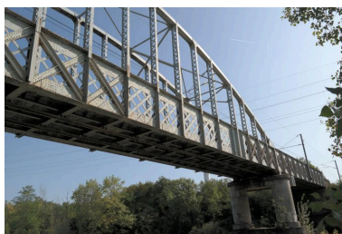
Pont ferroviaire de Vongy, vue de la pile centrale