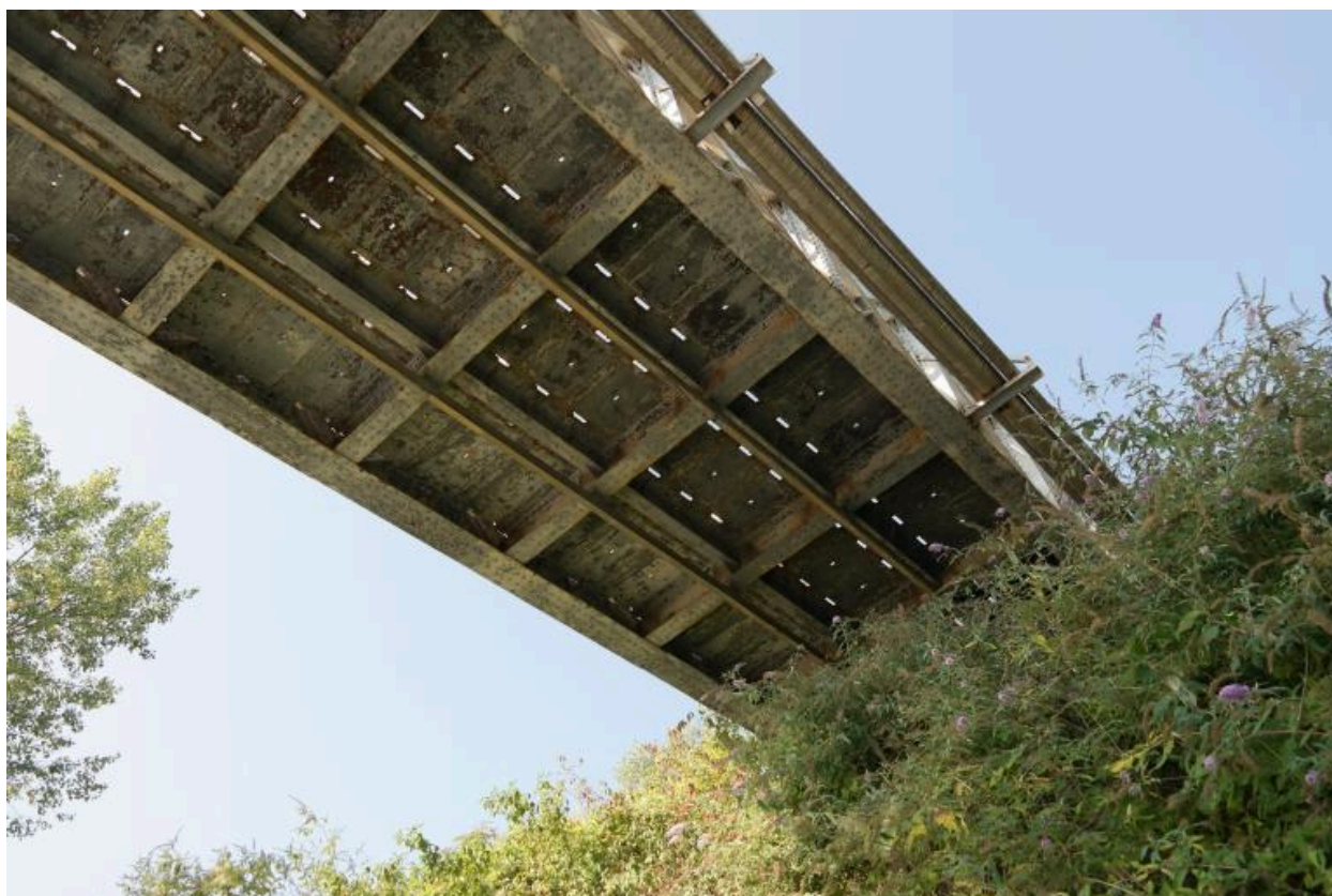
Pont ferroviaire de Vongy, vue de dessous