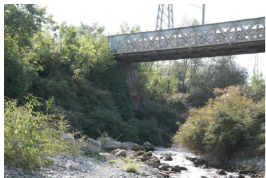
Pont ferroviaire de Vongy, culée rive droite