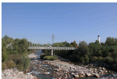
Pont ferroviaire de Vongy, vue de la face amont IVR84_20197401228NUCA