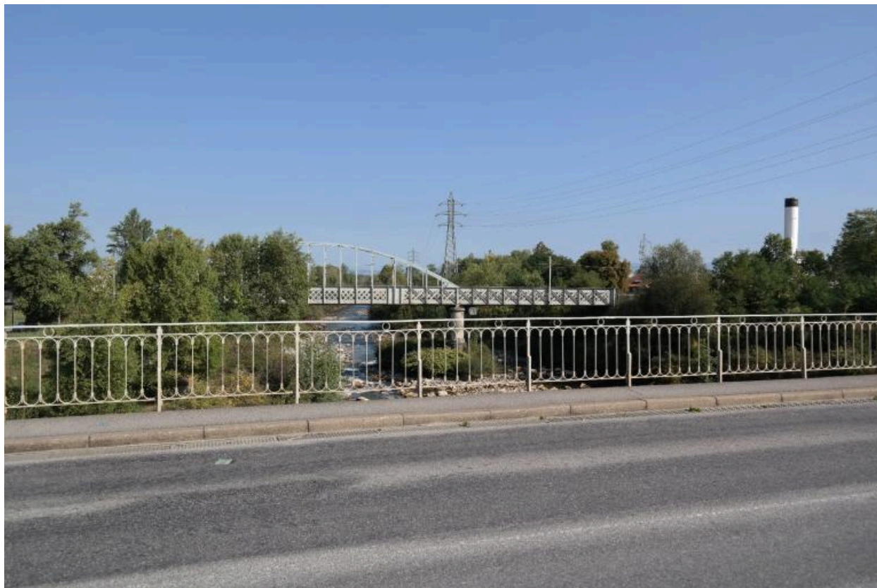
Pont ferroviaire de Vongy depuis le pont de Dranse