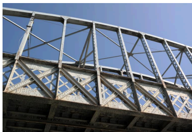
Pont ferroviaire de Vongy, détail de la structure métallique