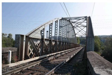
Pont ferroviaire de Vongy, vue du tablier et des garde-corps IVR84_20207401539NUCA