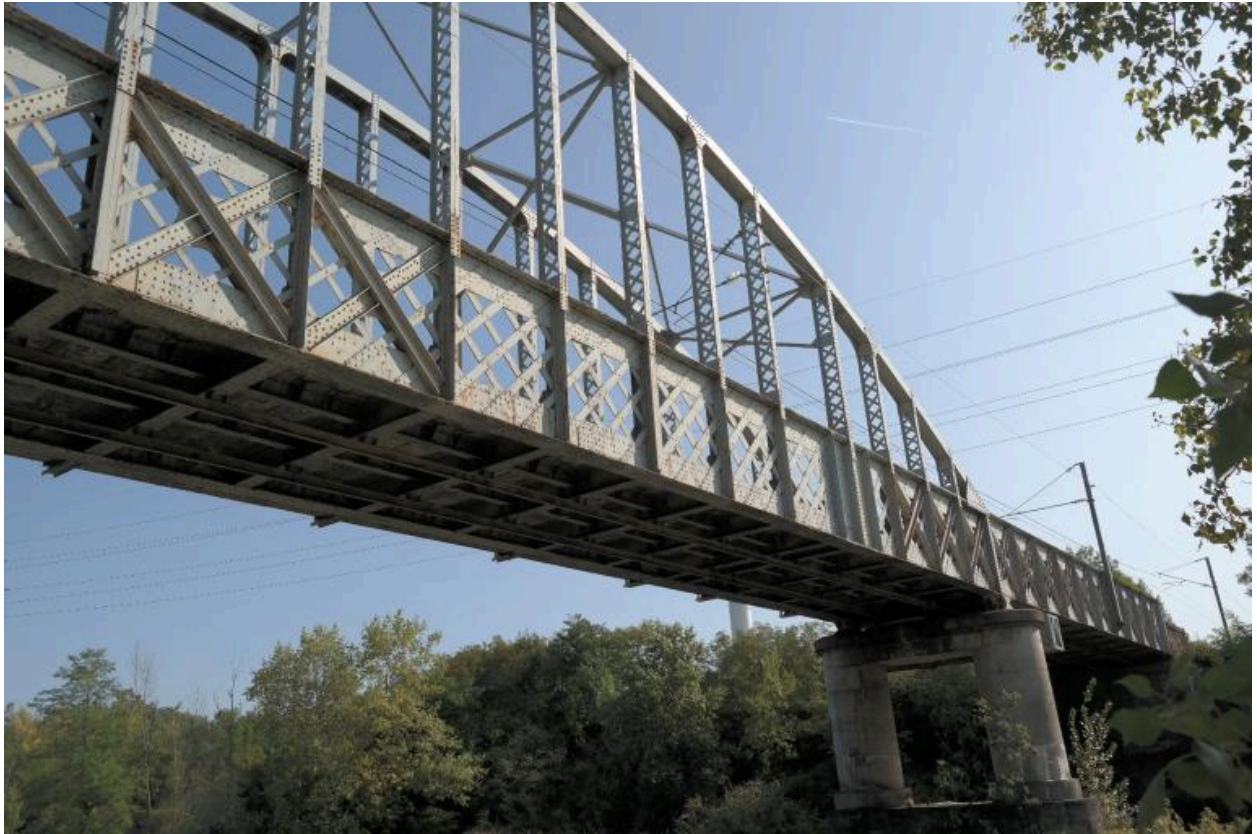
Pont ferroviaire de Vongy, vue de la pile centrale