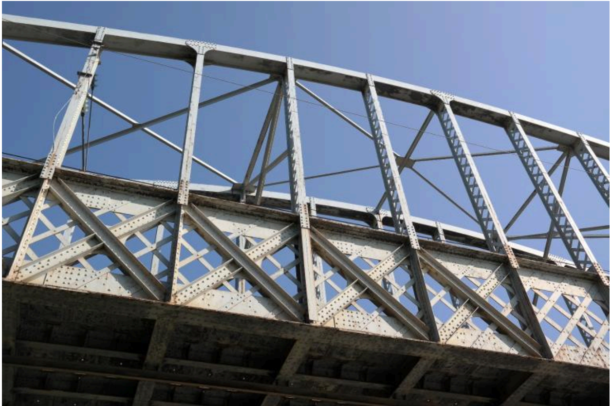
Pont ferroviaire de Vongy, détail de la structure métallique