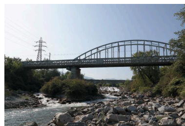
Pont ferroviaire de Vongy, vue de la face aval IVR84_20207401538NUCA