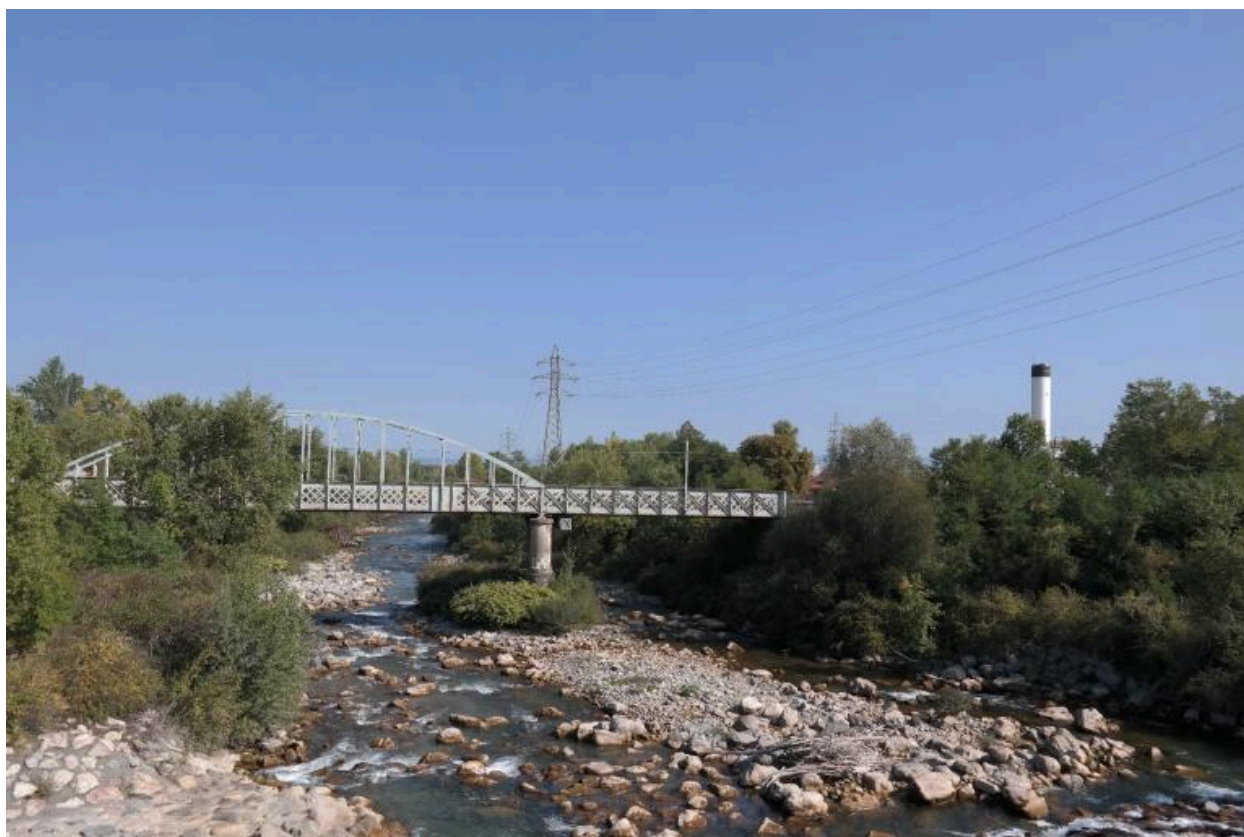
Pont ferroviaire de Vongy, vue de la face amont