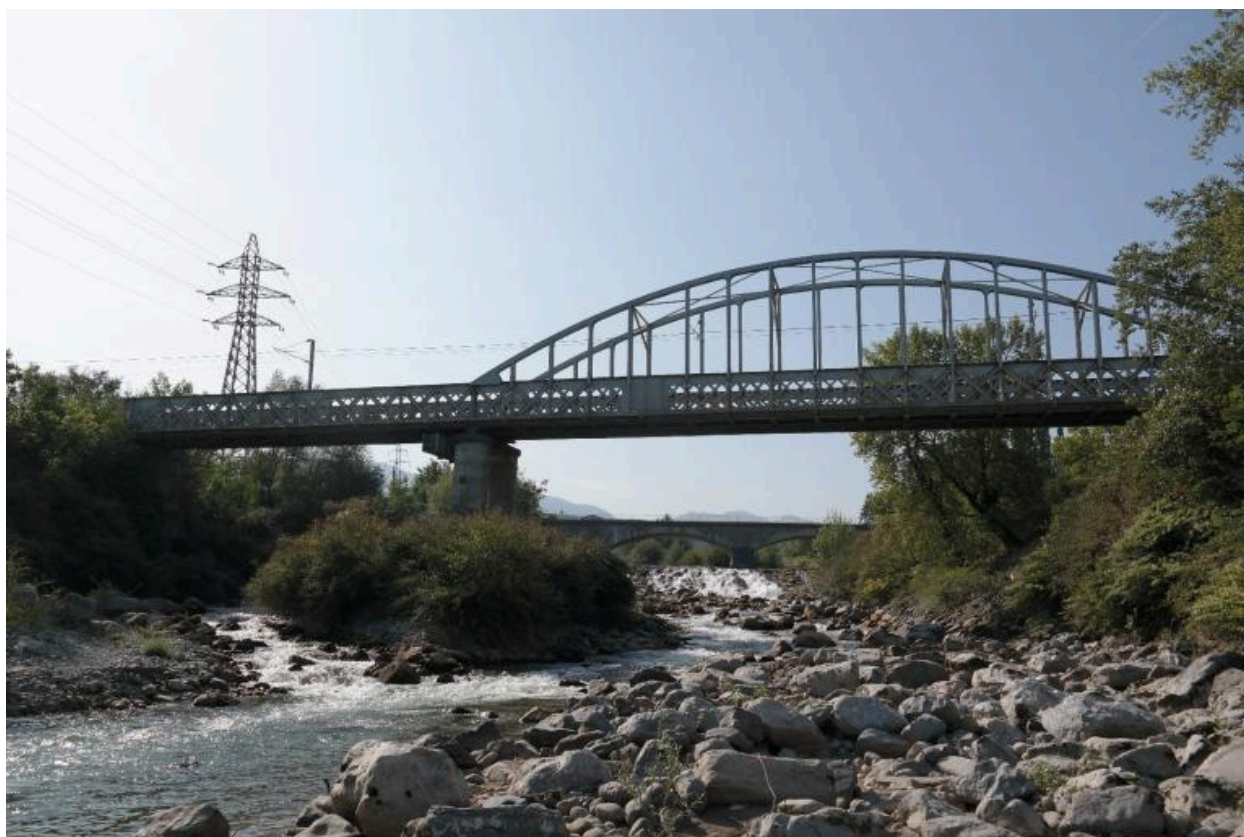
Pont ferroviaire de Vongy, vue de la face aval