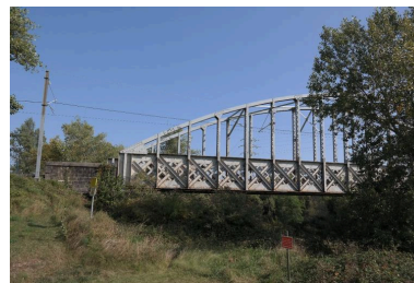
Pont ferroviaire de Vongy, détail rive gauche IVR84_20207401544NUCA