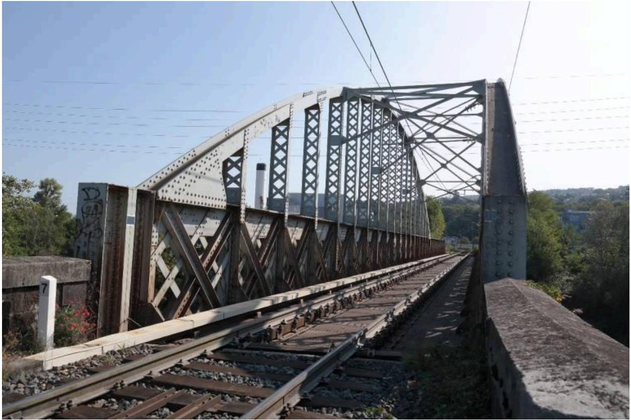
Pont ferroviaire de Vongy, vue du tablier et des garde-corps