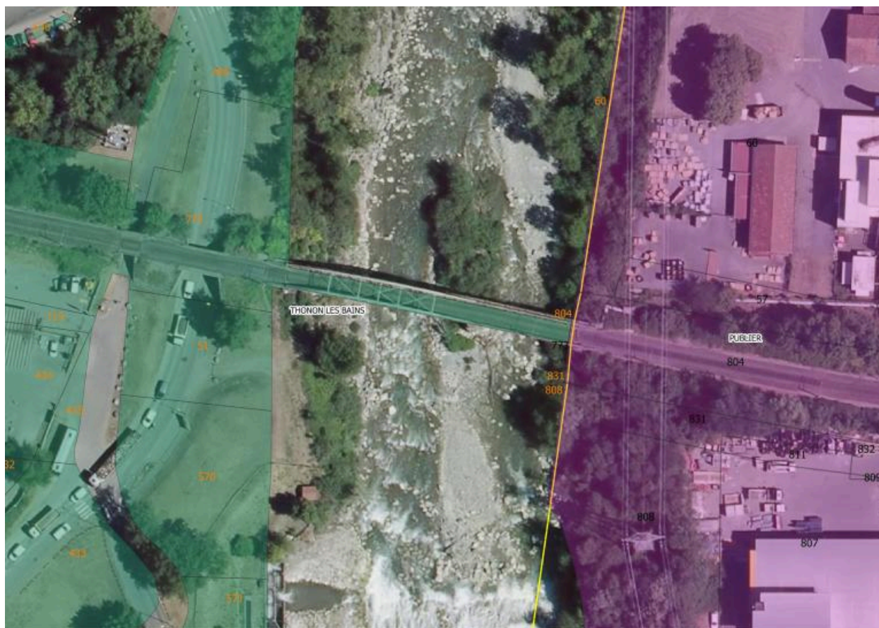
Cadastre des commune de Thonon-les-Bains et de Publier. 2017. Département de la Haute-Savoie. SIG