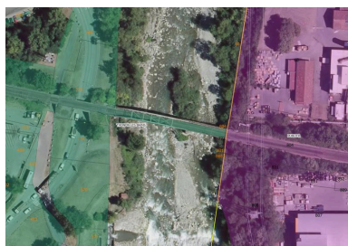
Cadastré des commune de Thonon-les-Bains et de Publier. 2017. Département de la Haute-Savoie. SIG IVR84_20207401545NUCA