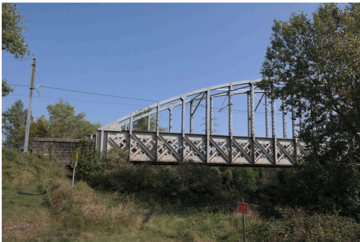
Pont ferroviaire de Vongy, détail rive gauche