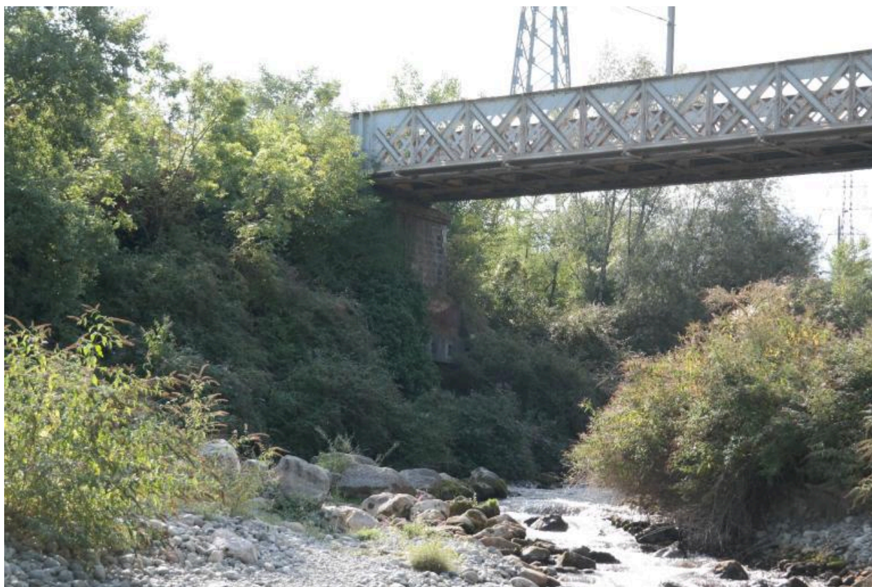
Pont ferroviaire de Vongy, culée rive droite