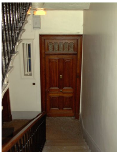
Vue d'une porte palière IVR82_20006900614NUCA