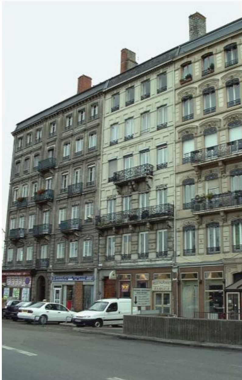
Elévation principale, cours de Verdun-Perrache