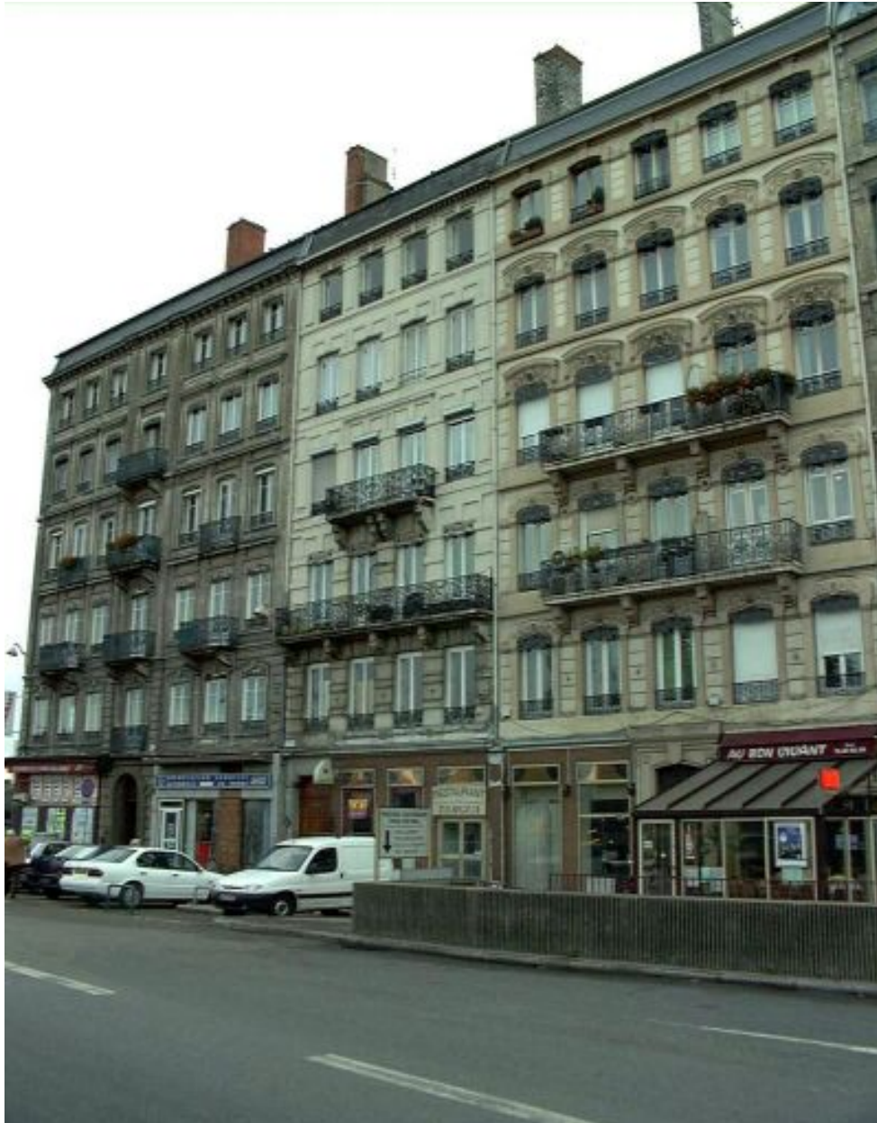
Vue d'ensemble des 36, 38, 40 cours de Verdun-Perrache