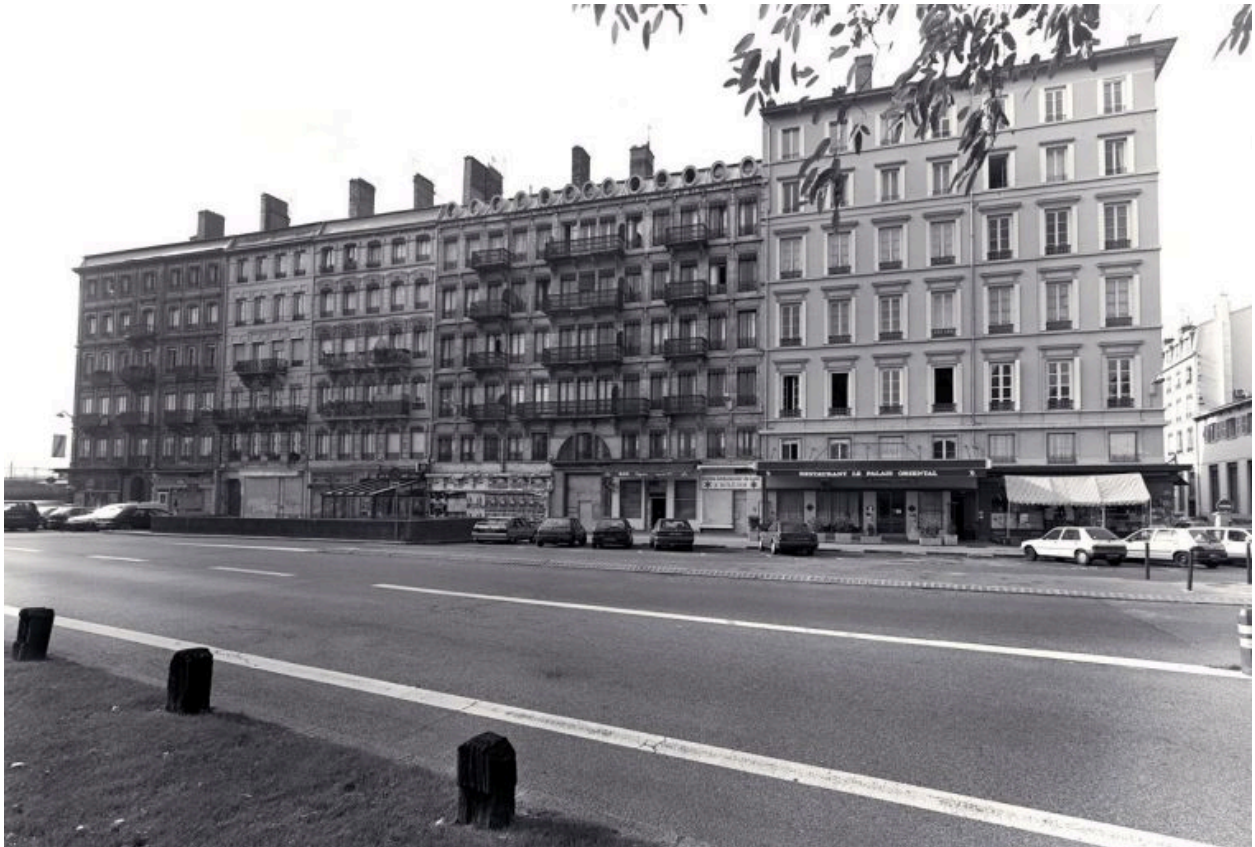
Vue d'ensemble des immeubles, 30-40 cours de Verdun-Perrache