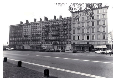
Vue d'ensemble des immeubles, 30-40 cours de Verdun-Perrache IVR82_20016902480V