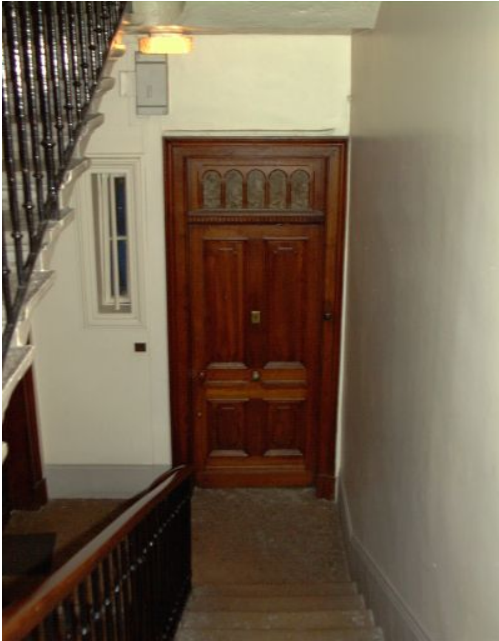
Vue d'une porte palière