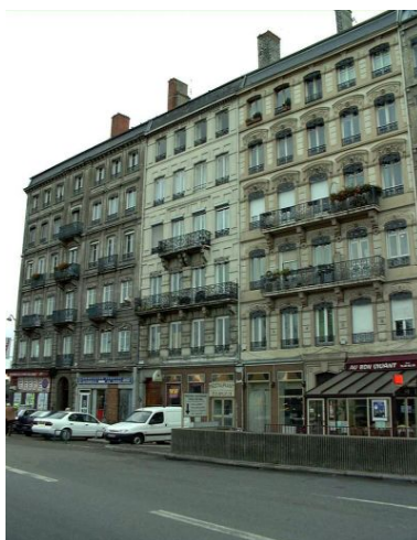
Vue d'ensemble des 36, 38, 40 cours de Verdun-Perrache