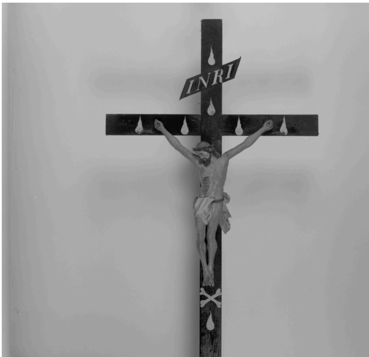
Croix de confrérie.