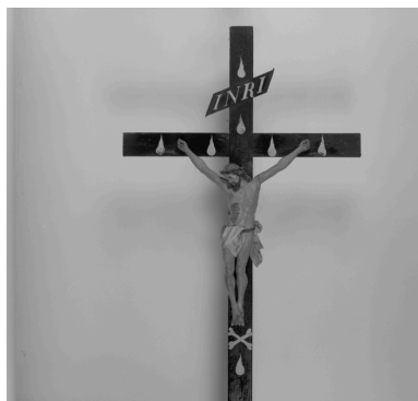
Croix de confrérie.