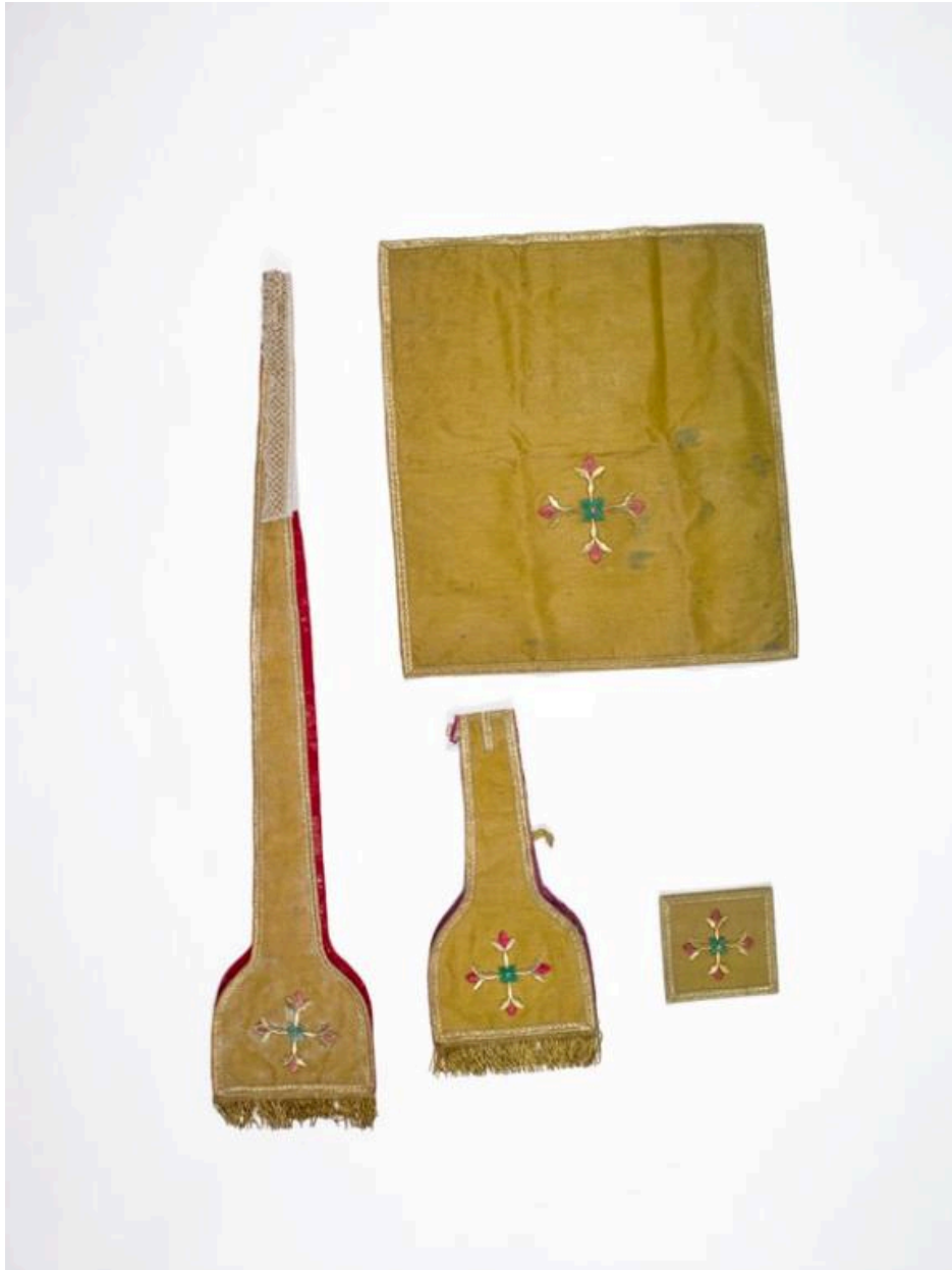
Vue générale de l'étole, du manipule, du voile de calice et de la pale