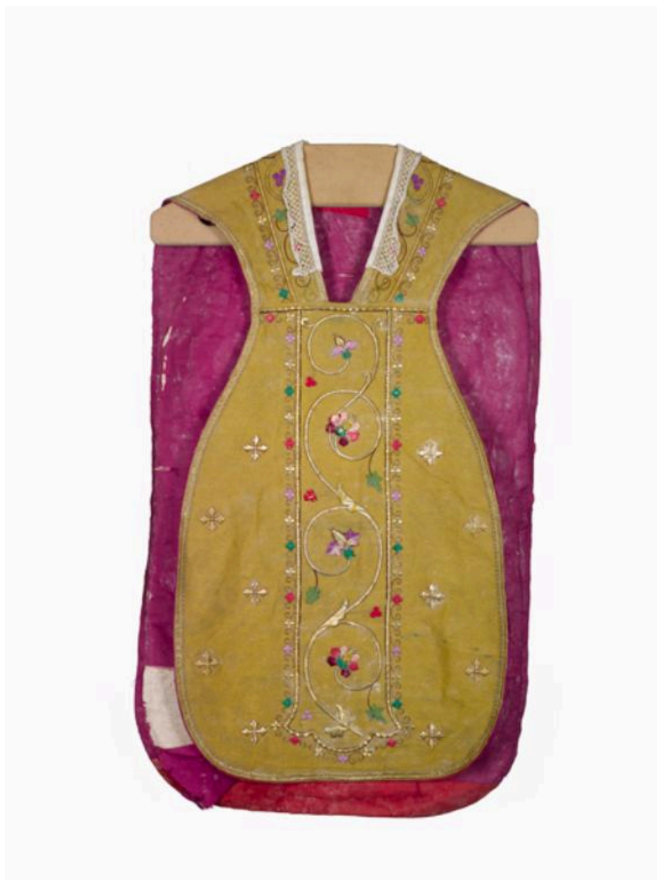
Vue générale du devant de la chasuble