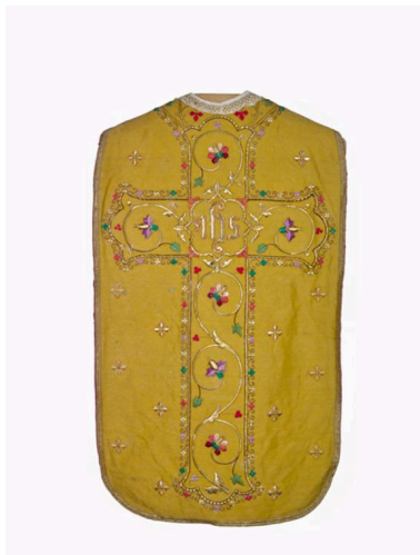
Vue générale du dos de la chasuble IVR84_20166300188NUC4A