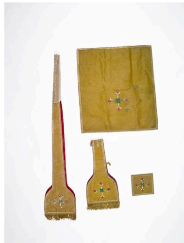
Vue générale de l'étole, du manipule, du voile de calice et de la pale IVR84_20166300211NUC4A