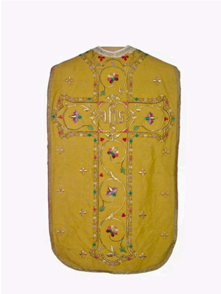
Vue générale du dos de la chasuble