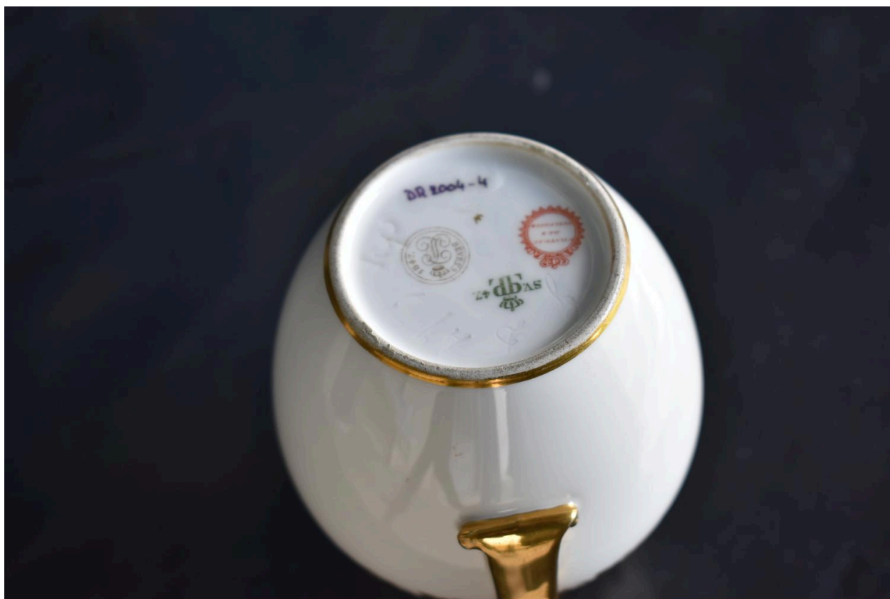
Vue de dessous : les marques.