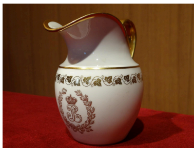
Vue générale IVR84_20216300303NUC4A