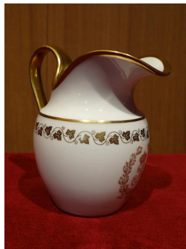
vue générale IVR84_20216300304NUC4A