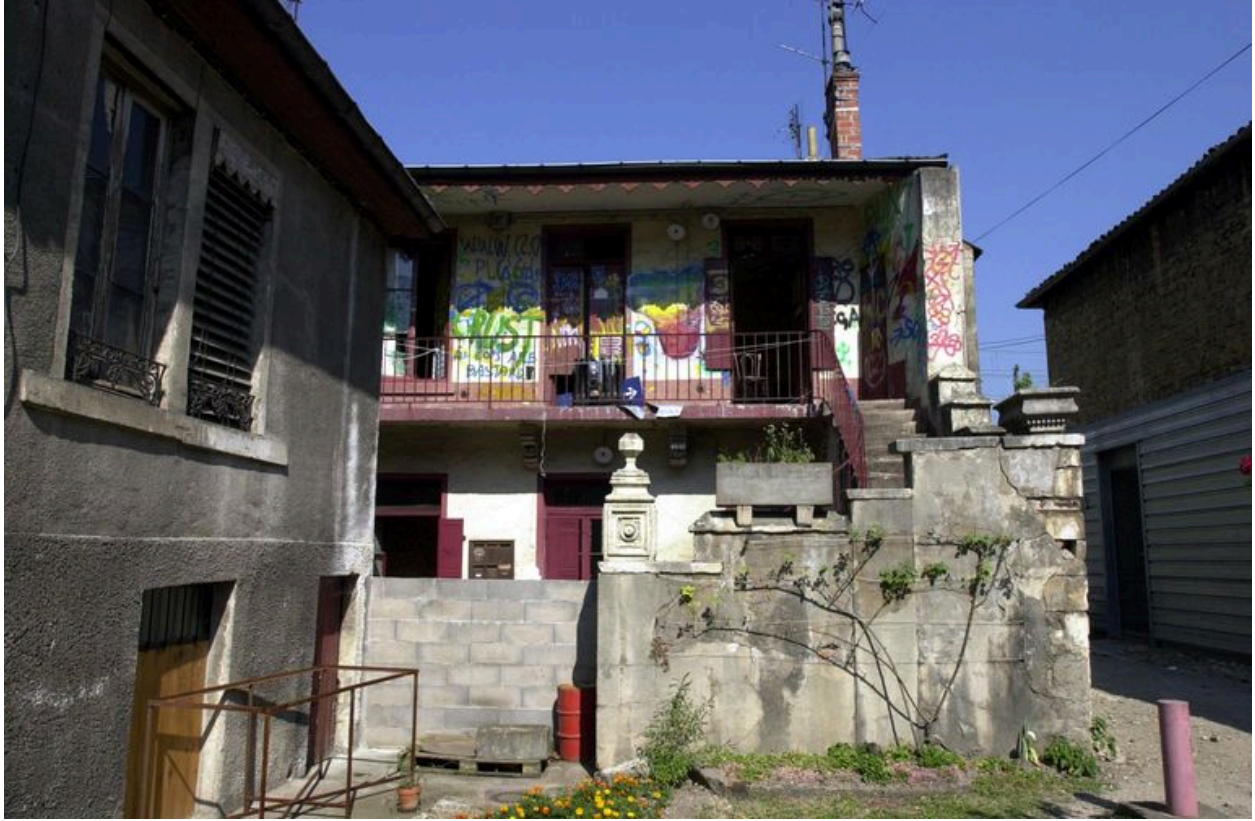
Elévation postérieure de la maison alignée sur rue