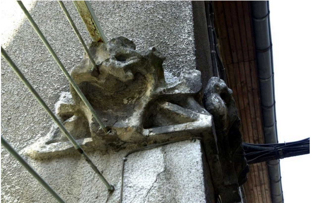
Angle nord-est de l'immeuble : détail d'un remploi d'élément sculpté datant du XVe siècle ?