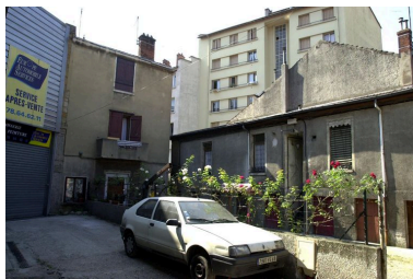
Vue partielle de l'immeuble perpendiculaire à la rue et vue de la maison située en fond de parcelle IVR82_20016902247NUCA