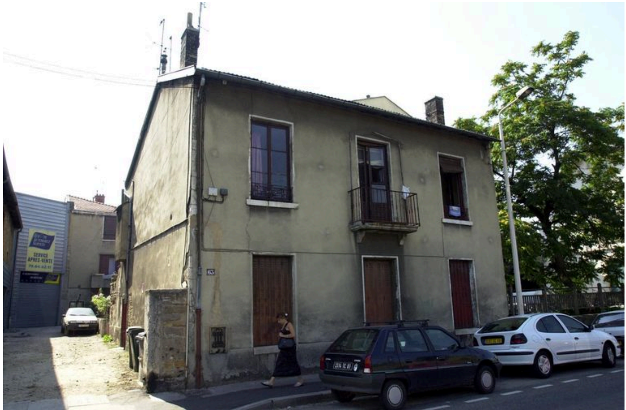
Maison alignée sur rue : élévation antérieure