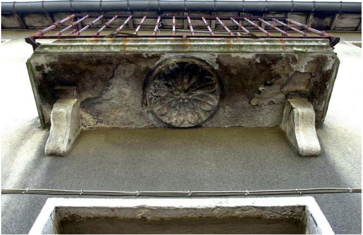
Maison alignée sur rue : rosace ornant la partie inférieure du balcon