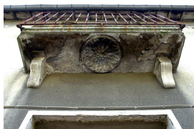
Maison alignée sur rue : rosace ornant la partie inférieure du balcon IVR82_20016902245NUCA