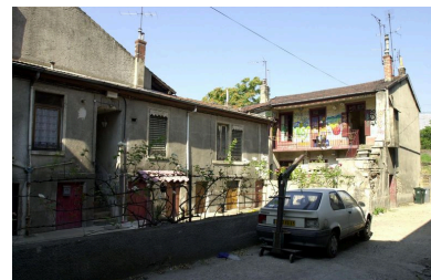
Elévation postérieure de la maison alignée sur rue et élévation antérieure de l'immeuble perpendiculaire à la rue IVR82_20016902246NUCA