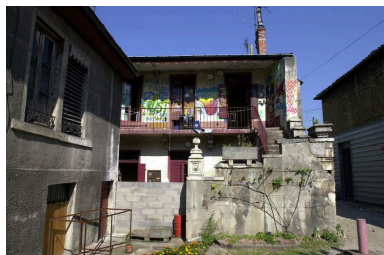
Elévation postérieure de la maison alignée sur rue IVR82_20016902260NUCA