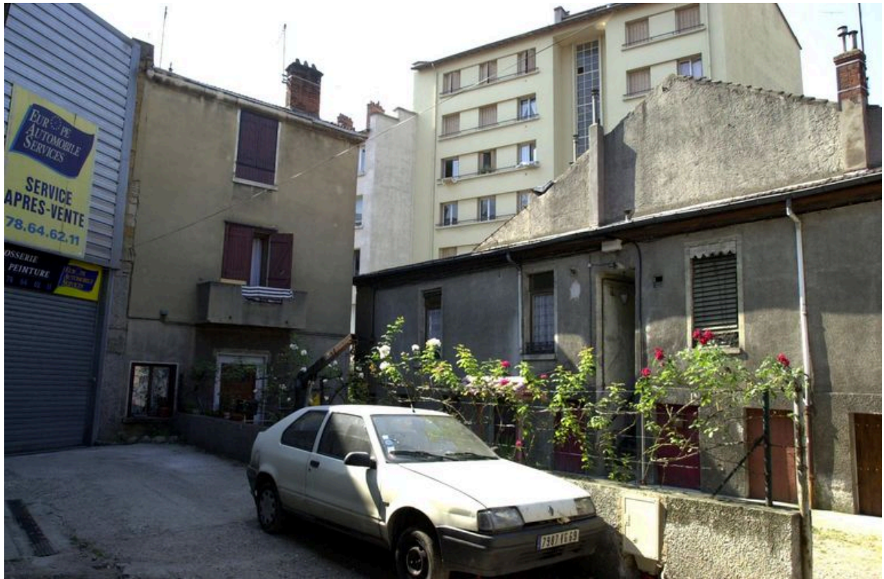
Vue partielle de l'immeuble perpendiculaire à la rue et vue de la maison située en fond de parcelle