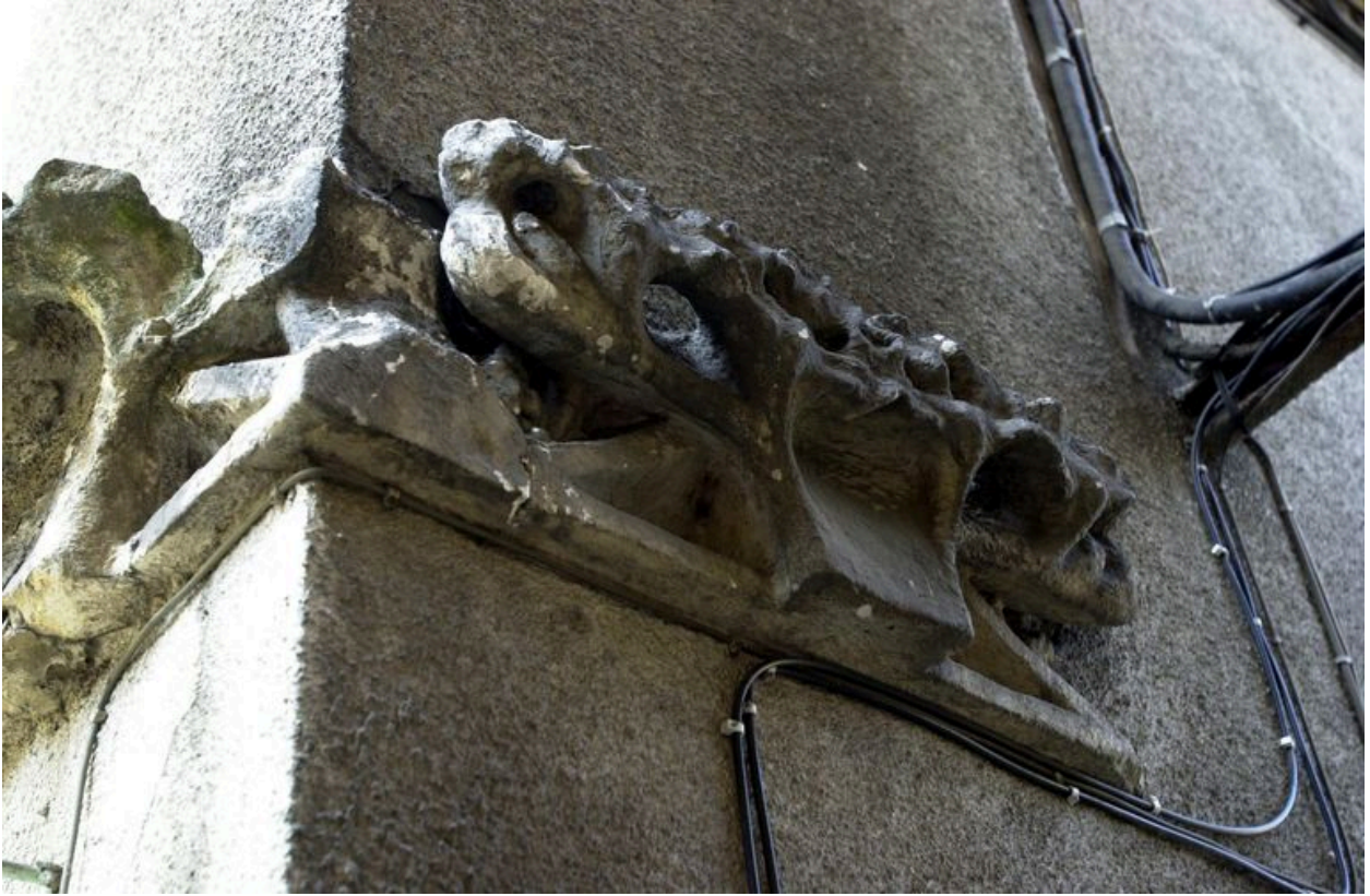
Angle nord-est de l'immeuble : détail d'un remploi d'élément sculpté datant du XVe siècle ?