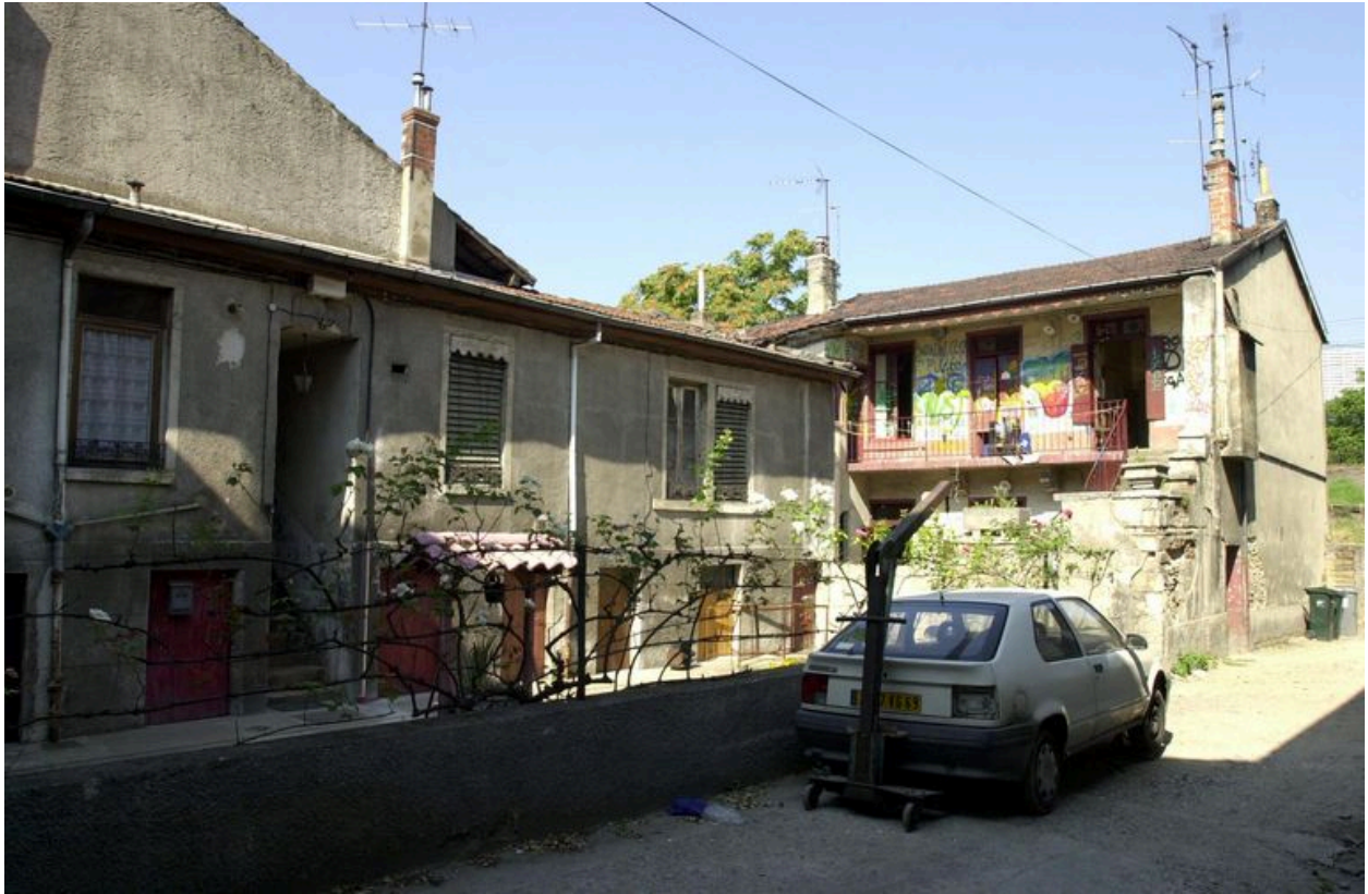
Élévation postérieure de la maison alignée sur rue et élévation antérieure de l'immeuble perpendiculaire à la rue