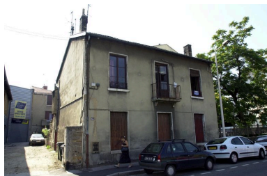
Maison alignée sur rue : élévation antérieure