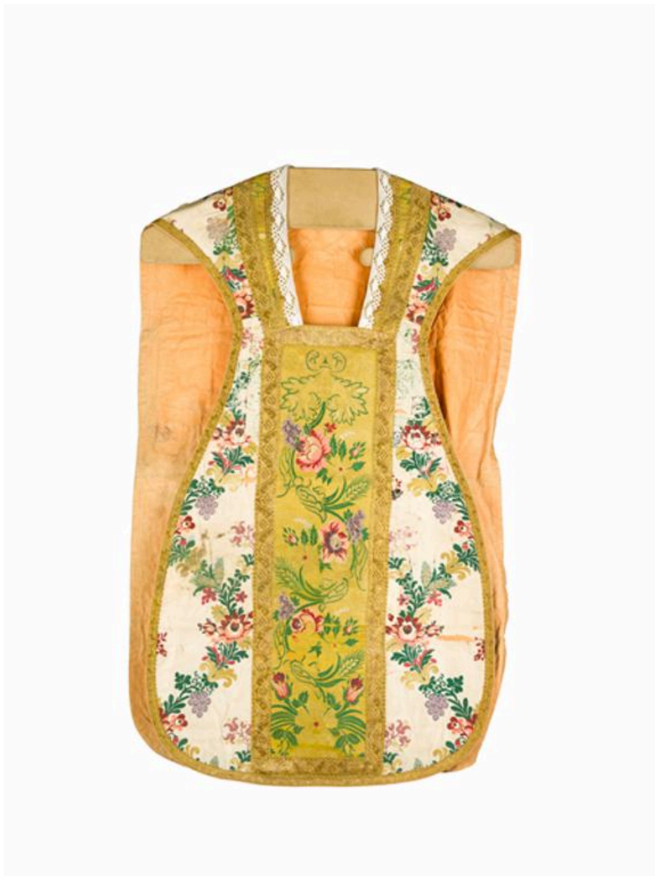
Vue du devant.