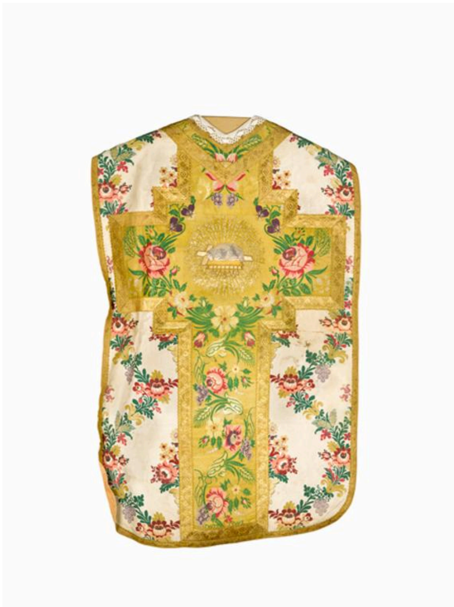
Vue du dos de la chasuble