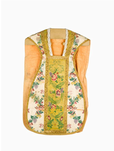
Vue du devant. IVR84_20181500085NUC4A