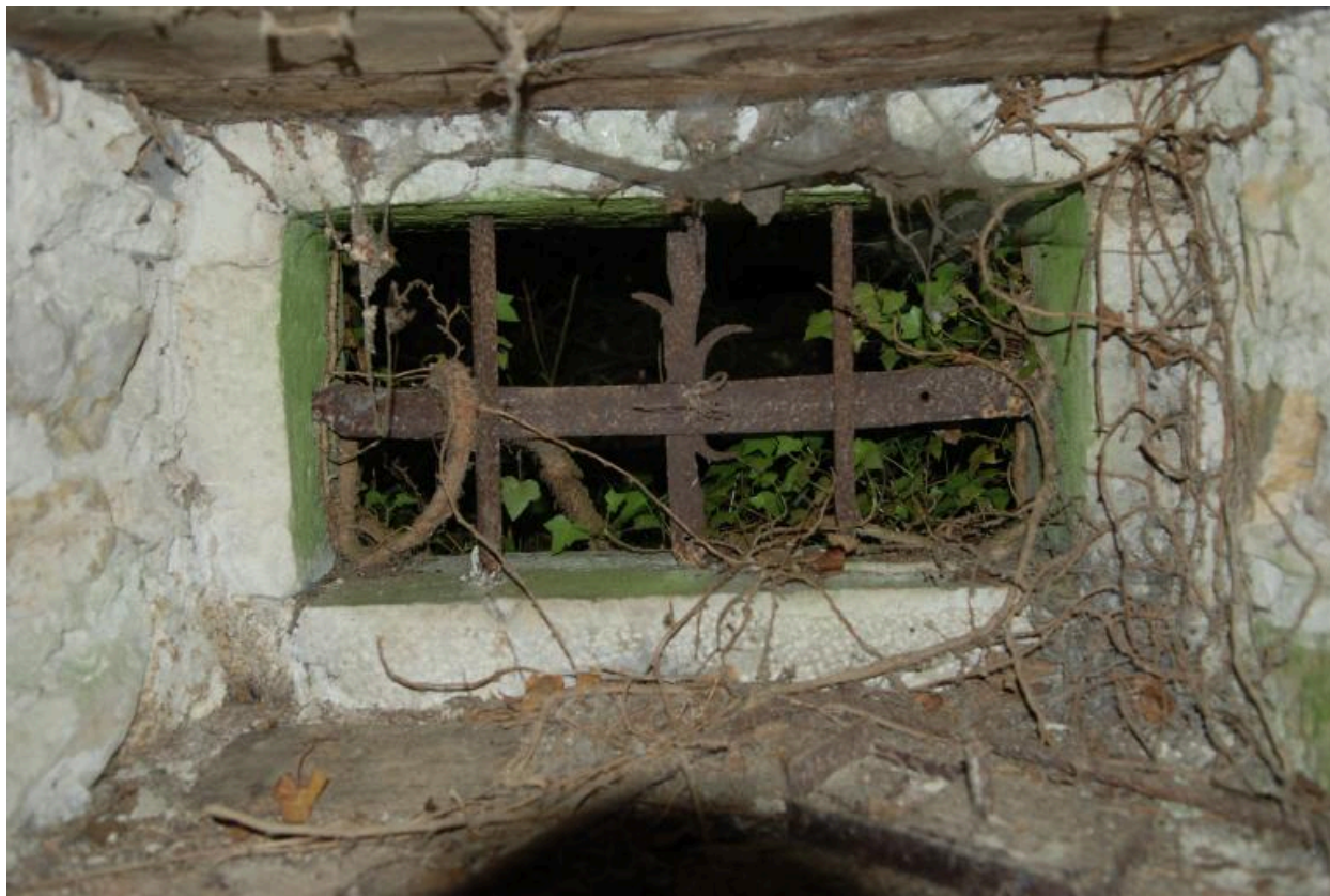
Jour avec barreaux en fer forgé.