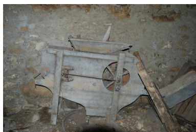
Vanneuse dans l'étable IVR84_20197400058NUCA