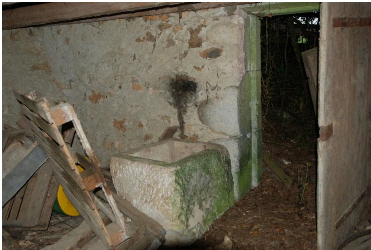
Vue intérieure de la cave avec le bloc en calcaire (saloir ?)