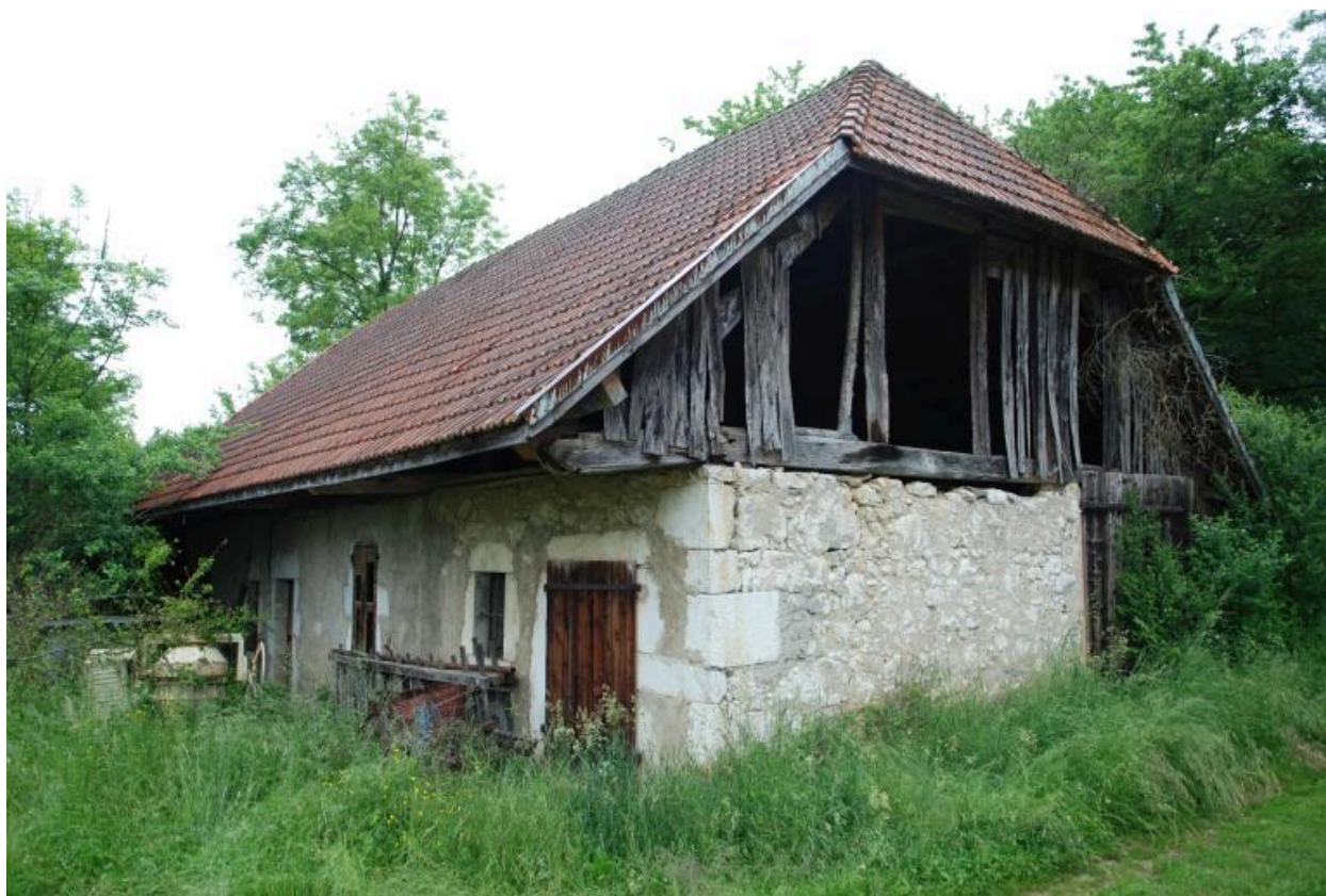
Vue d'ensemble de trois-quarts avant droit.