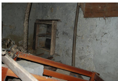
Placard mural.