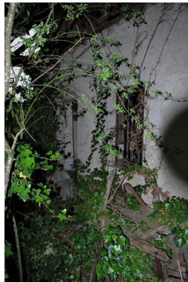
Détail de l'extrémité gauche de la façade principale, entrée de pièce. IVR84_20197400054NUCA