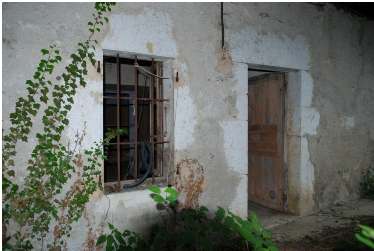
Détail de la partie centrale de la façade, porte d'entrée