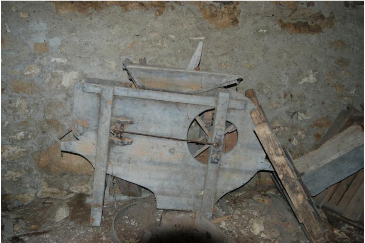
Vanneuse dans l'étable