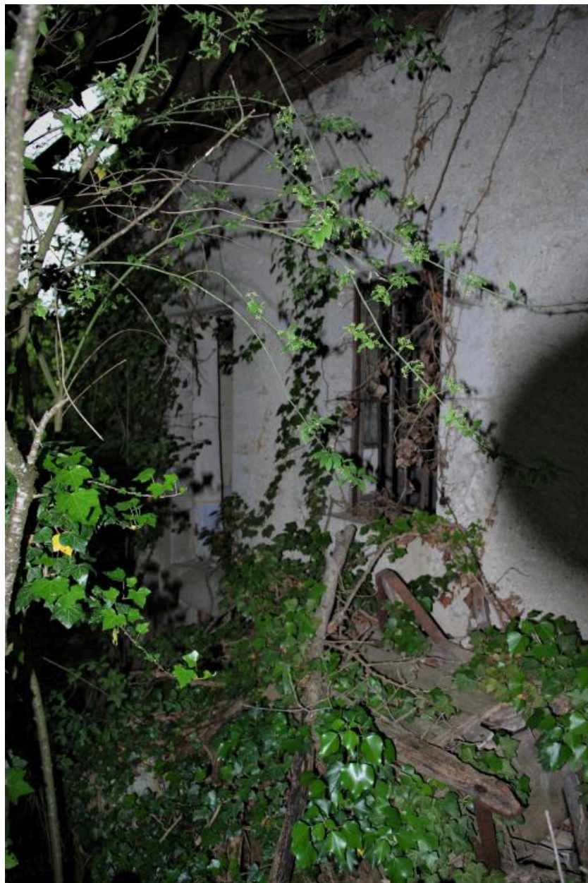
Détail de l'extrémité gauche de la façade principale, entrée de pièce.