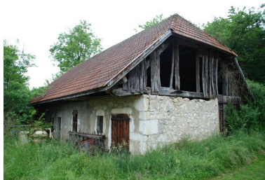
Vue d'ensemble de trois-quarts avant droit.