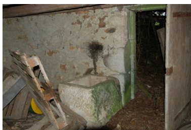
Vue intérieure de la cave avec le bloc en calcaire (saloir ?) IVR84_20197400056NUCA