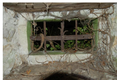
Jour avec barreaux en fer forgé. IVR84_20197400057NUCA