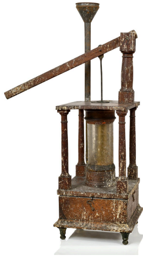
Pompe aspirante et foulante, vue 4 IVR84_20256901818NUCA