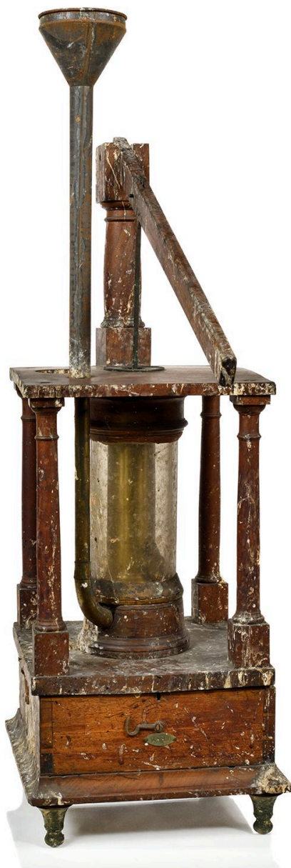
Pompe aspirante et foulante, vue 1