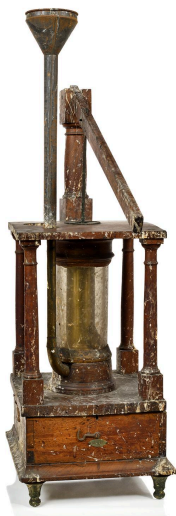
Pompe aspirante et foulante, vue 1 IVR84_20256901815NUCA