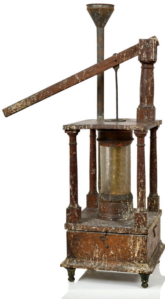
Pompe aspirante et foulante, vue 4