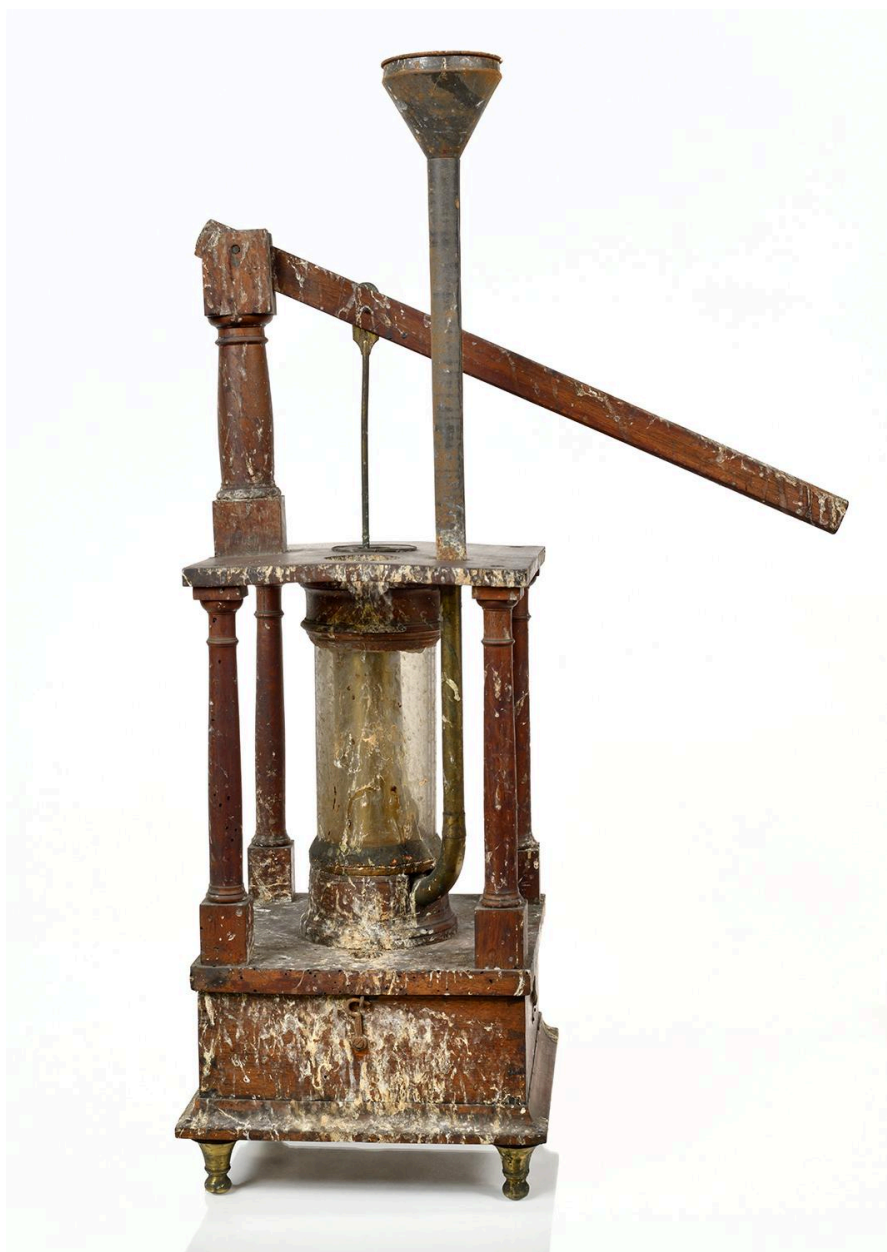
Pompe aspirante et foulante, vue 2