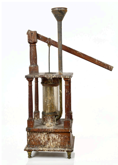
Pompe aspirante et foulante, vue 2 IVR84_20256901816NUCA