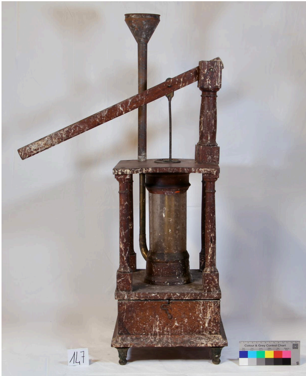
Pompe vue de face