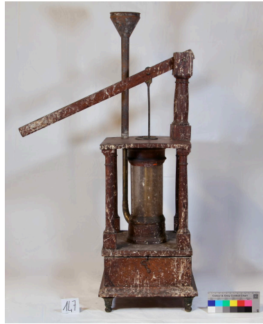
Pompe vue de face