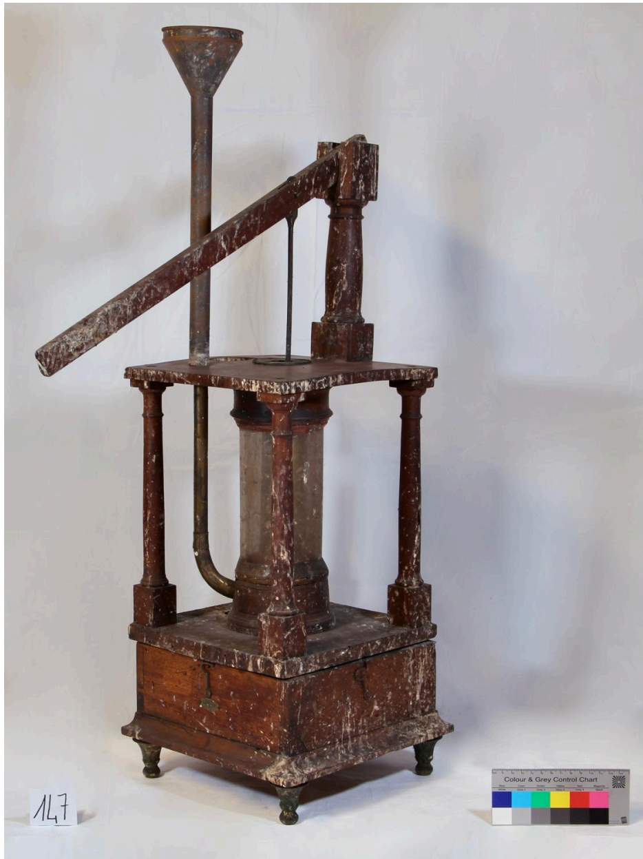
Pompe, vue de côté