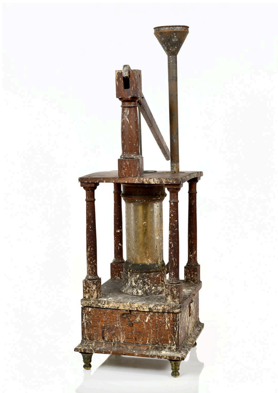
Pompe aspirante et foulante, vue 3