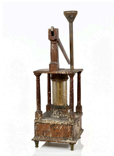
Pompe aspirante et foulante, vue 3