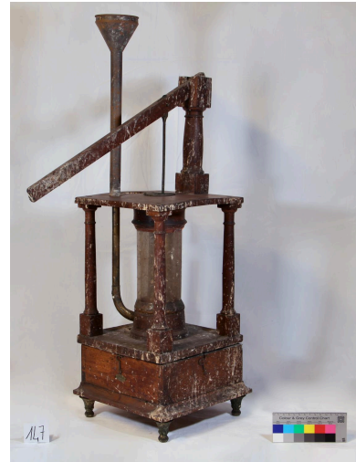
Pompe, vue de côté IVR84_20256901228NUCA