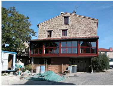
Vue d'ensemble de la façade sud. IVR82_20114201102NUCA