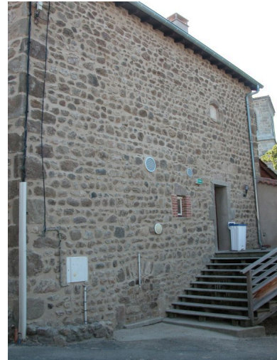
Vue d'ensemble de la façade ouest. IVR82_20114201103NUCA