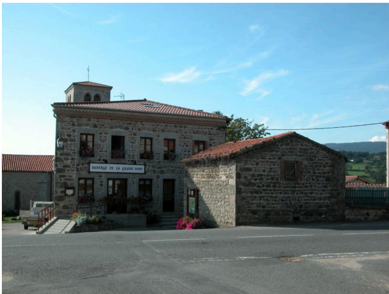
Vue d'ensemble de l'auberge depuis le nord.