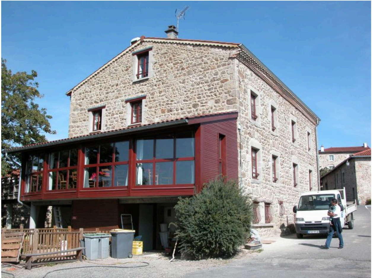
Vue d'ensemble de trois-quarts depuis le sud-ouest.