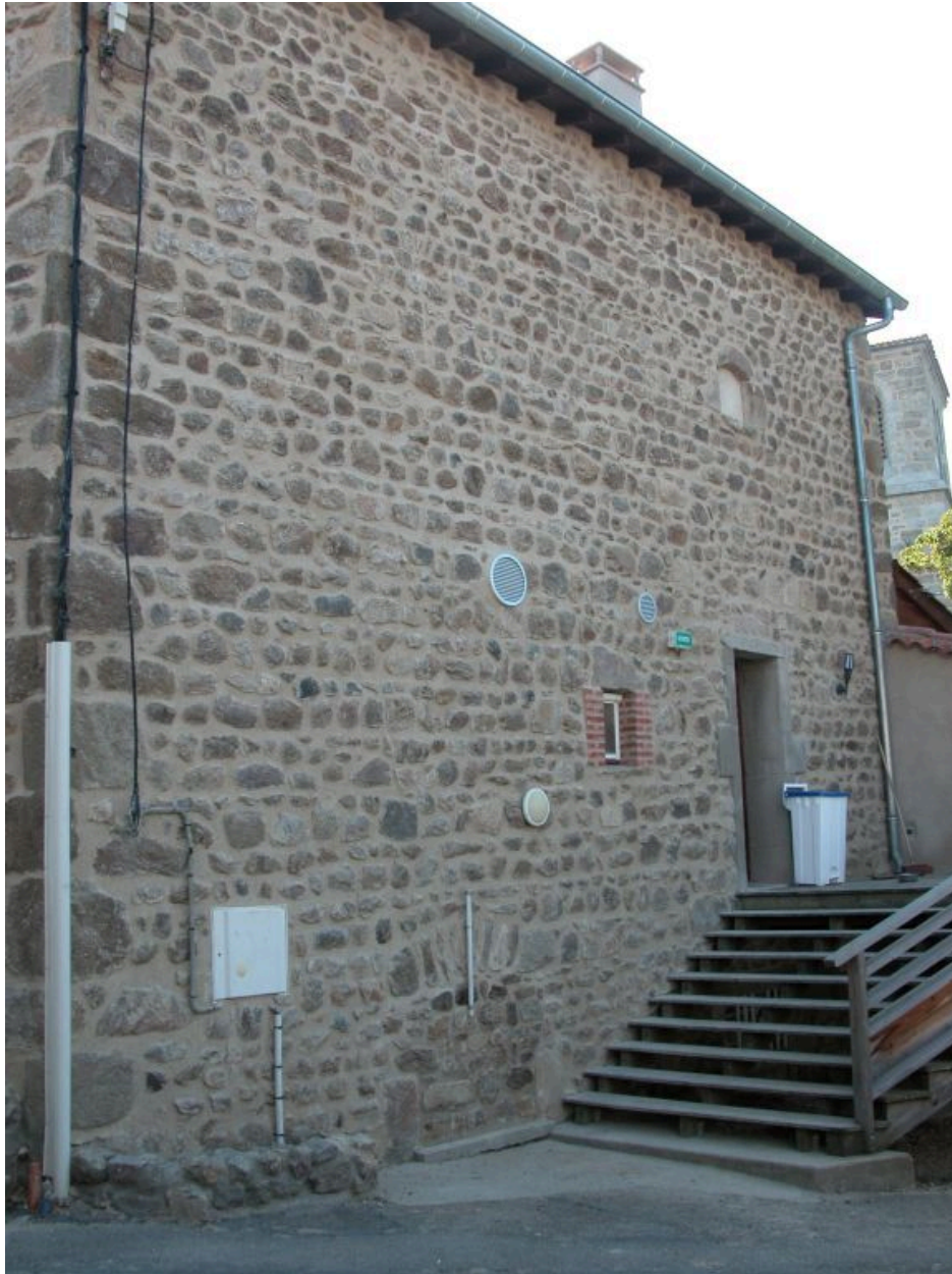
Vue d'ensemble de la façade ouest.