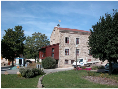
Vue d'ensemble de la façade latérale est. IVR82_20114201101NUCA