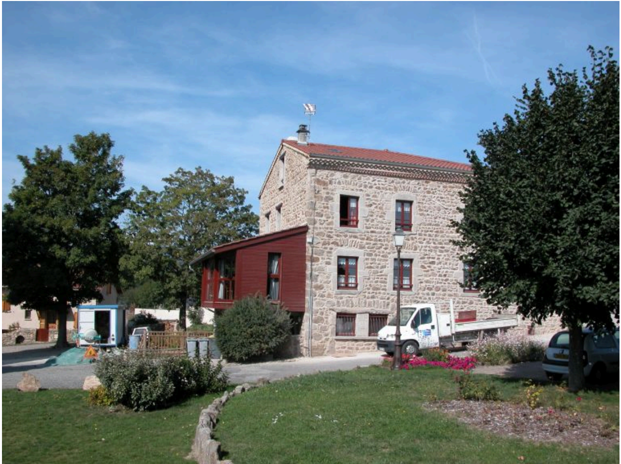
Vue d'ensemble de la façade latérale est.