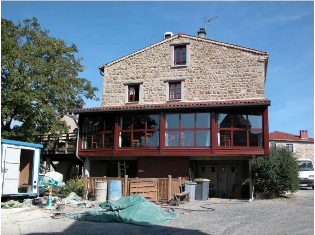
Vue d'ensemble de la façade sud.