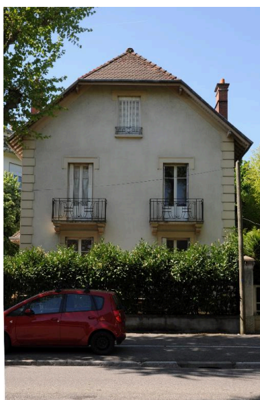
Façade sur rue IVR82_20147300585NUCA