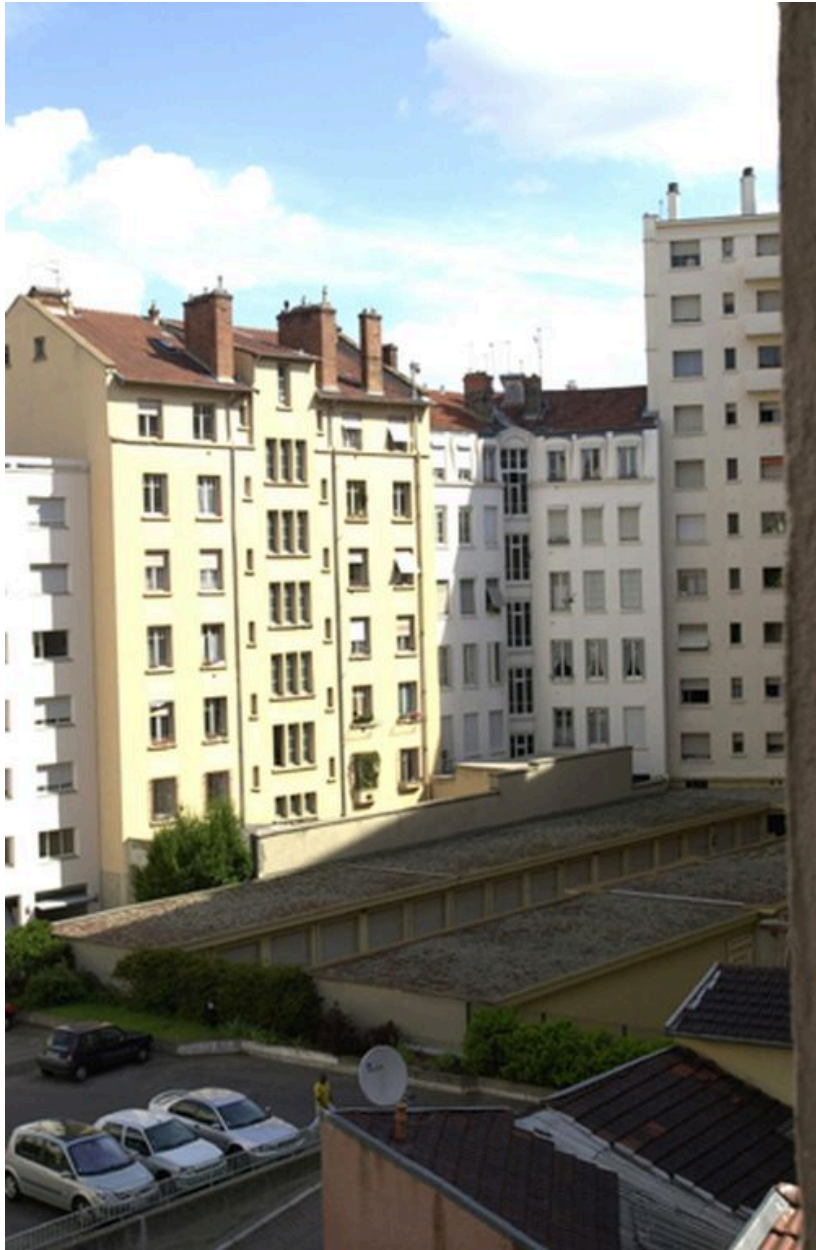
Vue des garages construits dans la cour