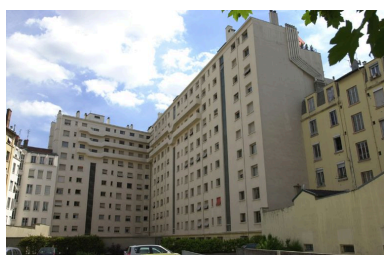
Elévation postérieure IVR82_20046904720NUCA