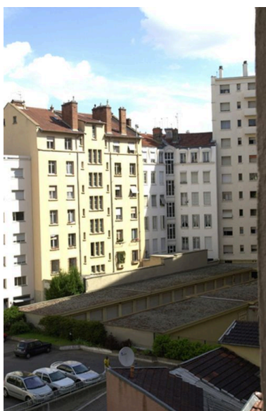
Vue des garages construits dans la cour