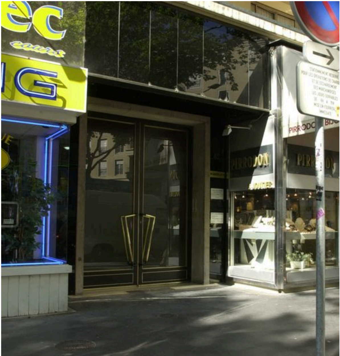
Porte d'entrée, 42 cours Gambetta