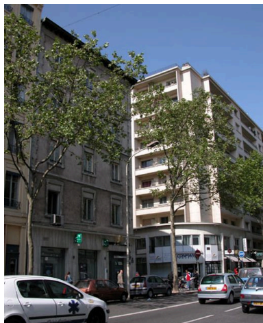
Vue partielle depuis le nord-est IVR82_20046904663NUCA