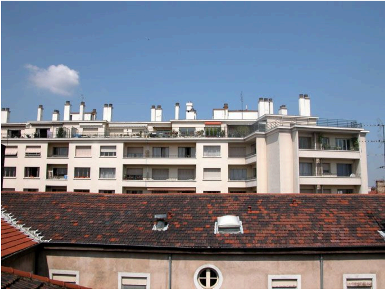
Vue des étages supérieurs, rue Sébastien-Gryphe