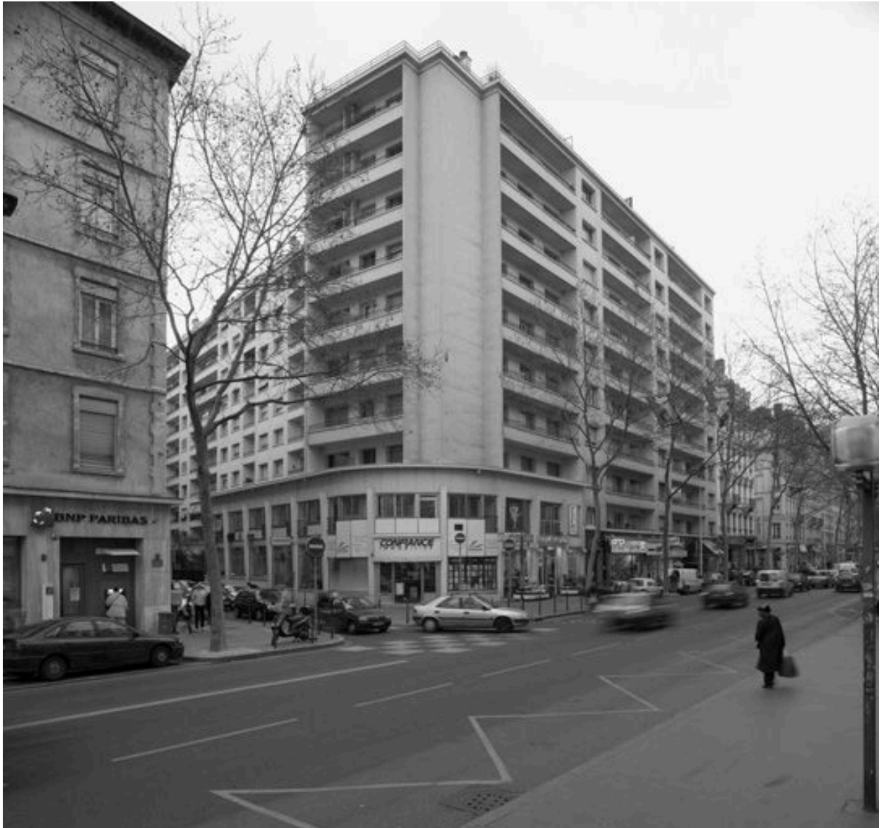
Vue générale de l'angle du cours Gambetta et de la rue Sébastien-Gryphe