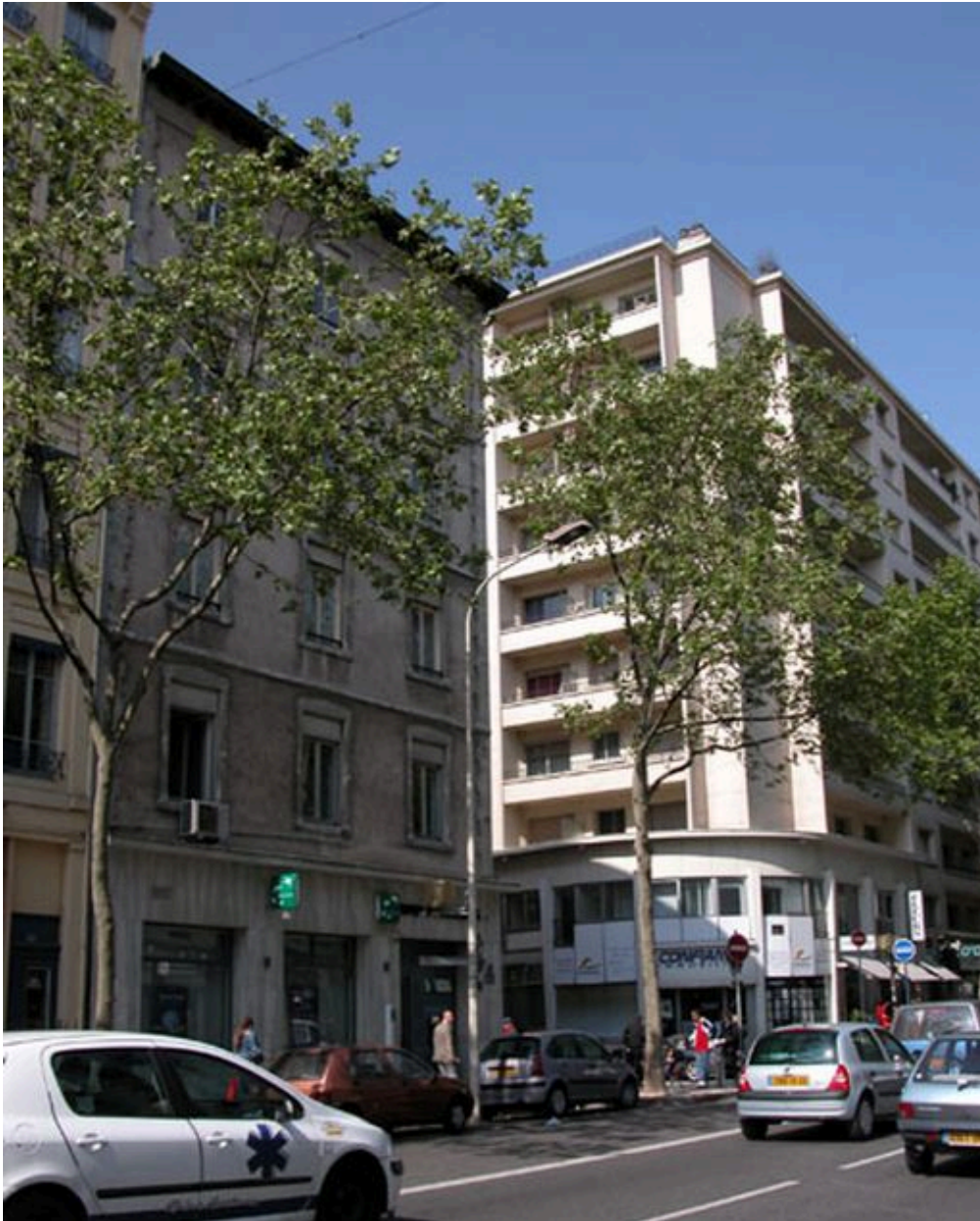
Vue partielle depuis le nord-est