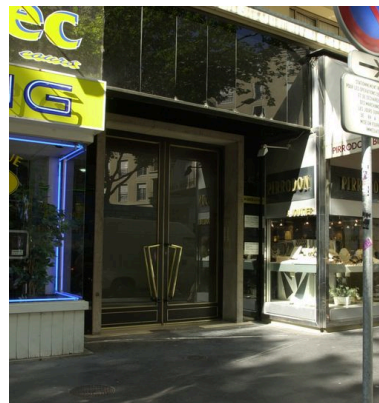
Porte d'entrée, 42 cours Gambetta IVR82_20046904729NUCA