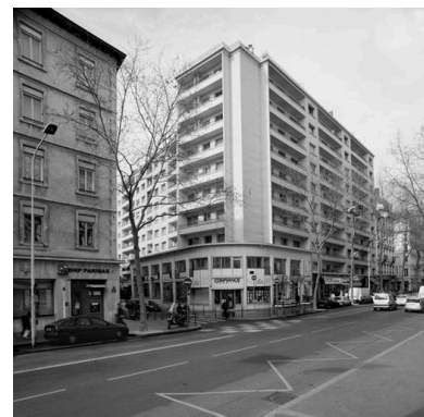
Vue d'ensemble depuis le nord-est IVR82_20056900637NUC