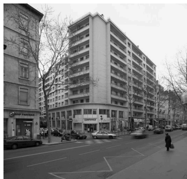
Vue générale de l'angle du cours Gambetta et de la rue Sébastien-Gryphe