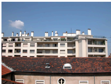
Vue des étages supérieurs, rue Sébastien-Gryphe IVR82_20046904677NUCA