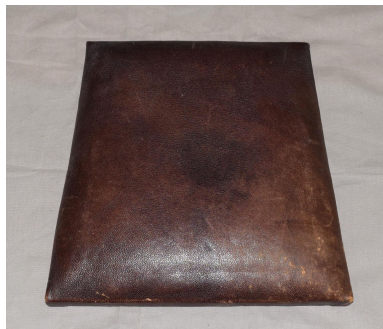
Vue générale IVR84_20226302423NUC4A