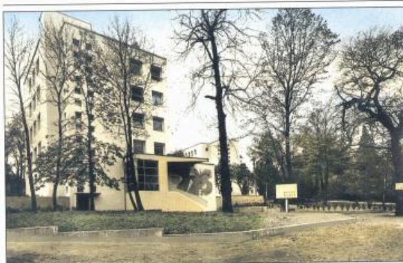
Le Lycée vers 1960 : bâtiment administratif