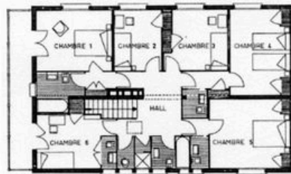
Plan de l'étage